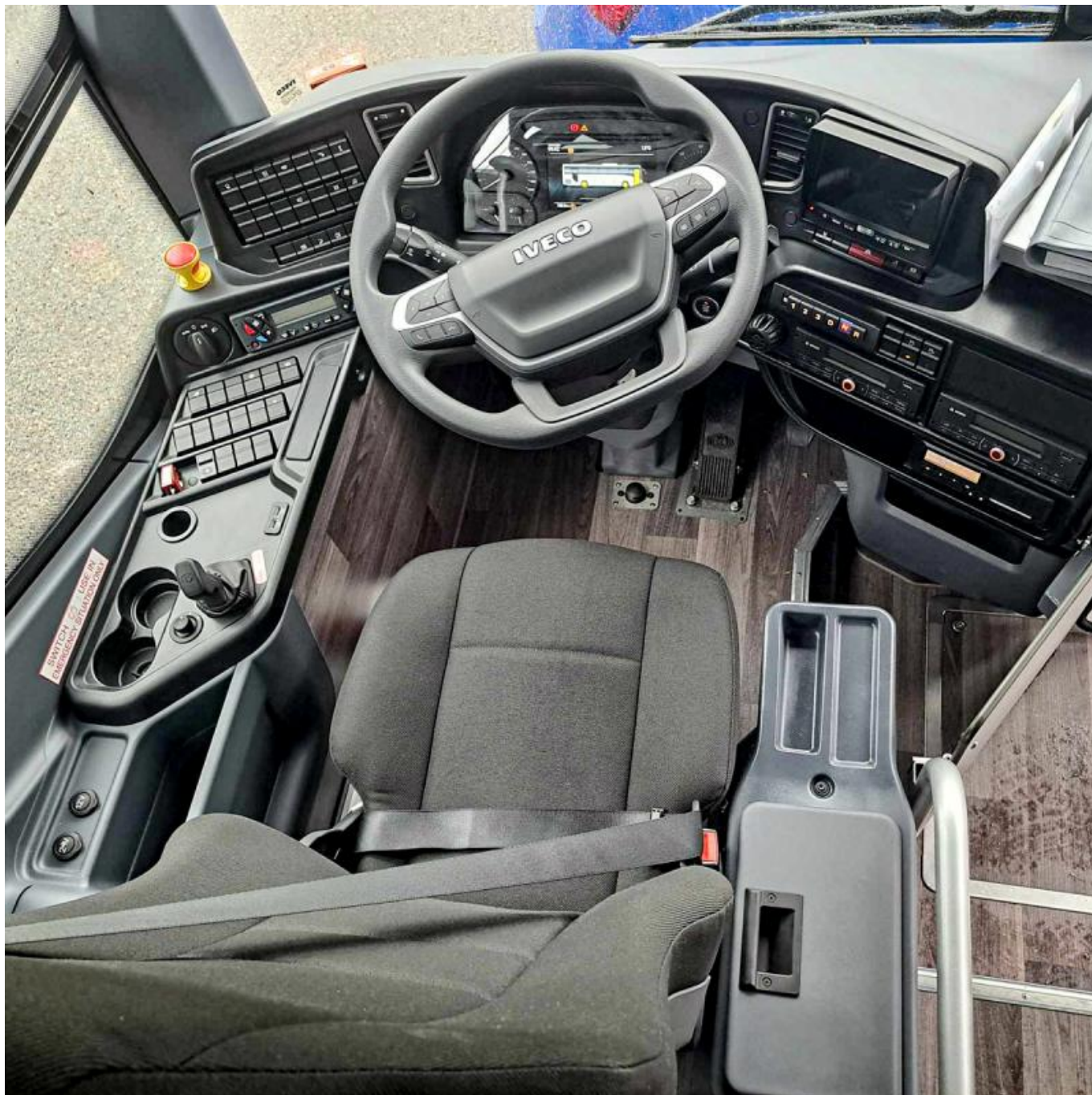
Stanoviště řidiče autobusu Iveco Evadys pro ČD BUS.

Čtyři zakoupené autobusy Evadys budou po konci mistrovství světa a změně designu využívány primárně pro náhradní autobusovou dopravu pro cestující Českých drah. Stejně tak se po republice rozprchnou i některé z „mistrovských“ vozů. Doplní tak poměrně skromnou sestavu pouhých 17 nových vozů Evadys na našich silnicích, z nichž všechny až na jeden představují 12metrové provedení a povětšinou patří Policii ČR, Armádě nebo příbuzným složkám.