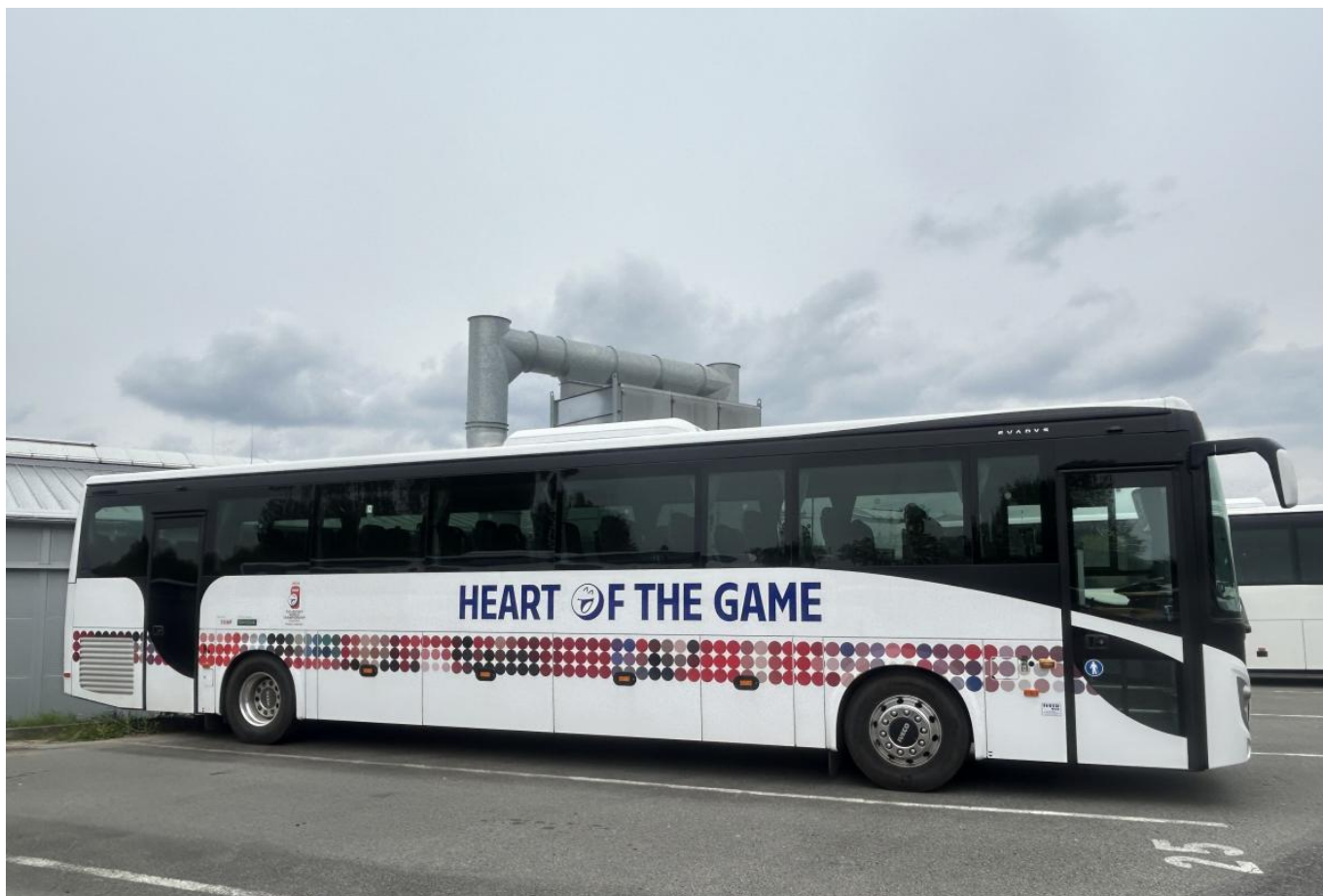
Část autobusů je v netradiční konfiguraci s druhými dveřmi v zadní části vozu.

Připomeňme, že ČD Bus vznikl přejmenováním dopravce VYDOS BUS z Vyškova, kterého České dráhy koupily v dubnu 2022 s tím, že s flotilou disponibilních autobusů (kterou později začaly samy rozšiřovat novými vozy) hodlaly zajišťovat především přepravu v rámci výluk kdekoli v rámci České republiky, což mělo společnosti umožnit zbavit se částečně závislosti na soukromých dopravcích, od nichž si do té doby 100 % výkonů pronajímaly (mnohdy za vskutku vysoké ceny). Dříve uzavřené smlouvy s VYDOS BUSem zůstaly v platnosti (MHD Vyškov a v té době i výlukový provoz na rameni Brno - Blansko).