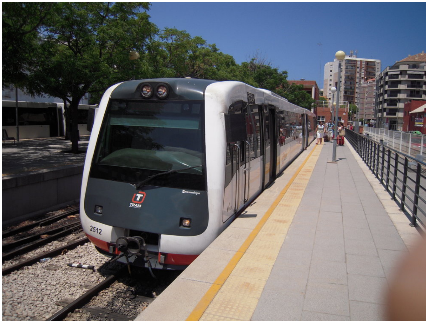
Denia a motorové jednotky řady 2500