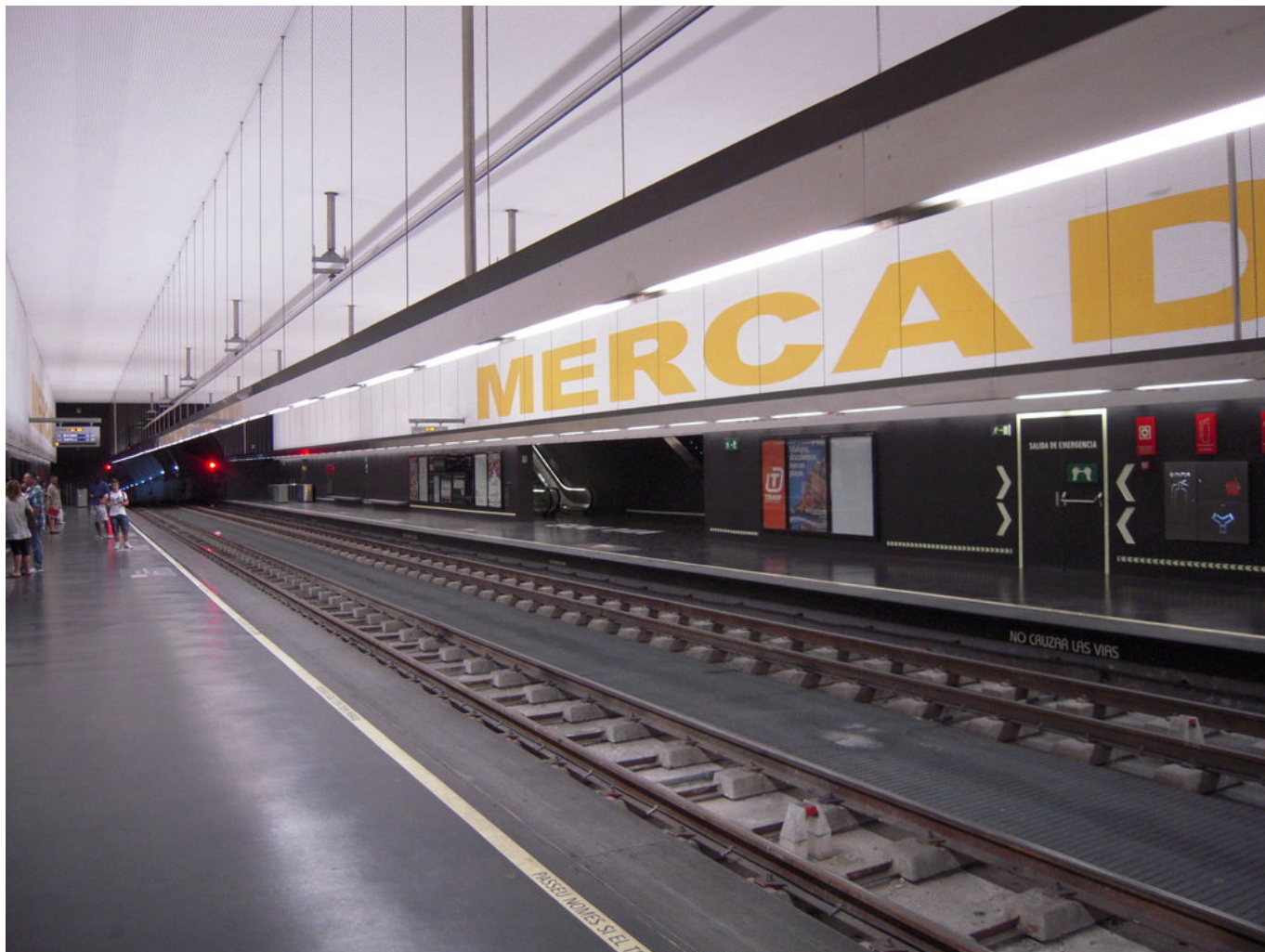
Podzemní zastávka Mercado