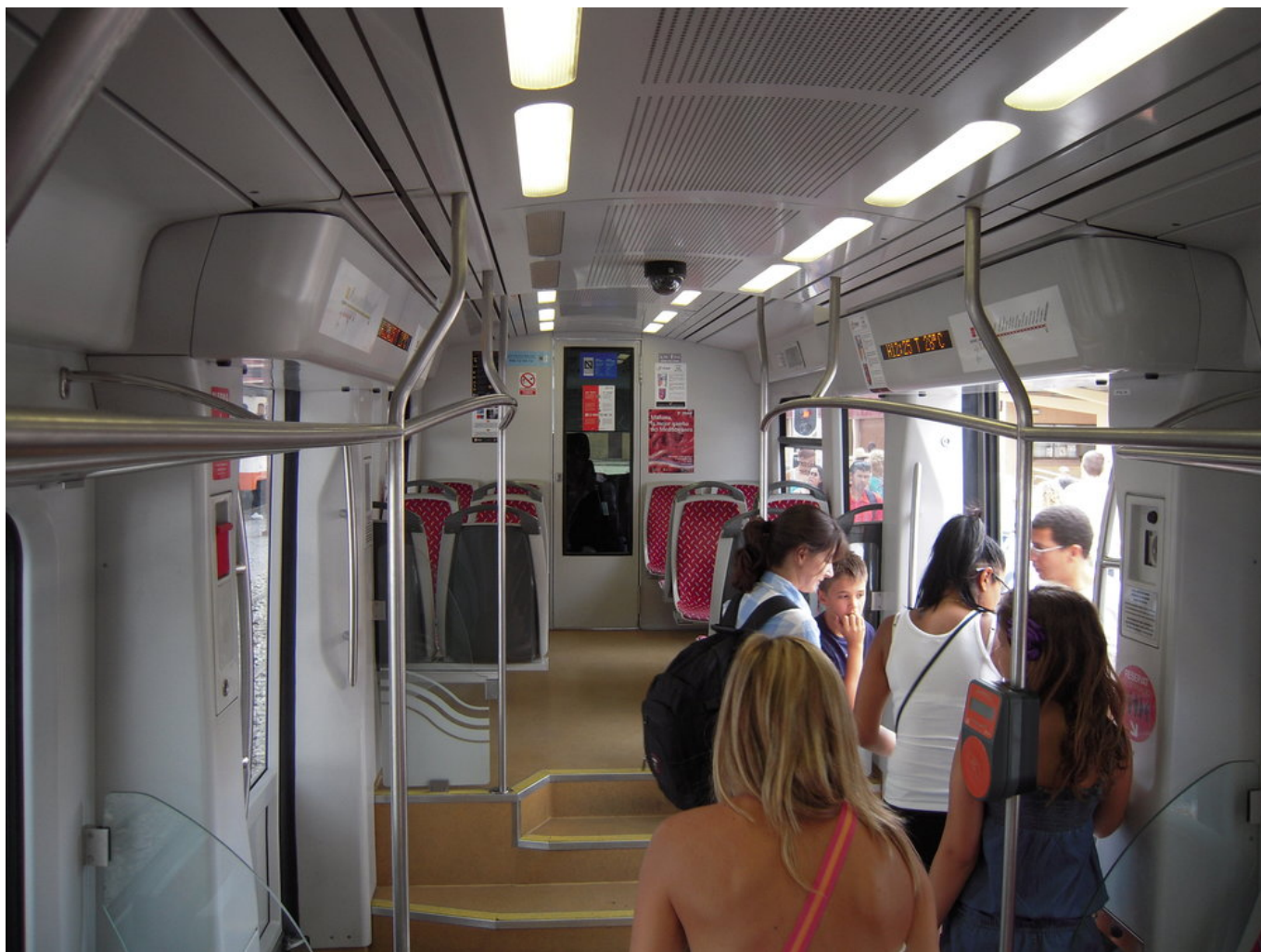
Interiér tramvaje Vossloh řady 4100