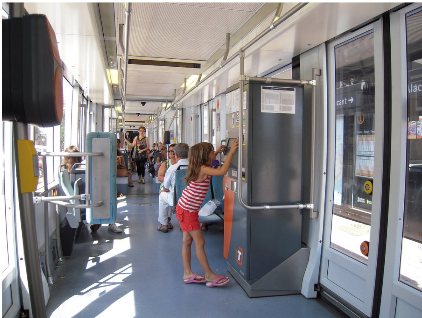
Interiér tramvaje Bombardier řady 4200