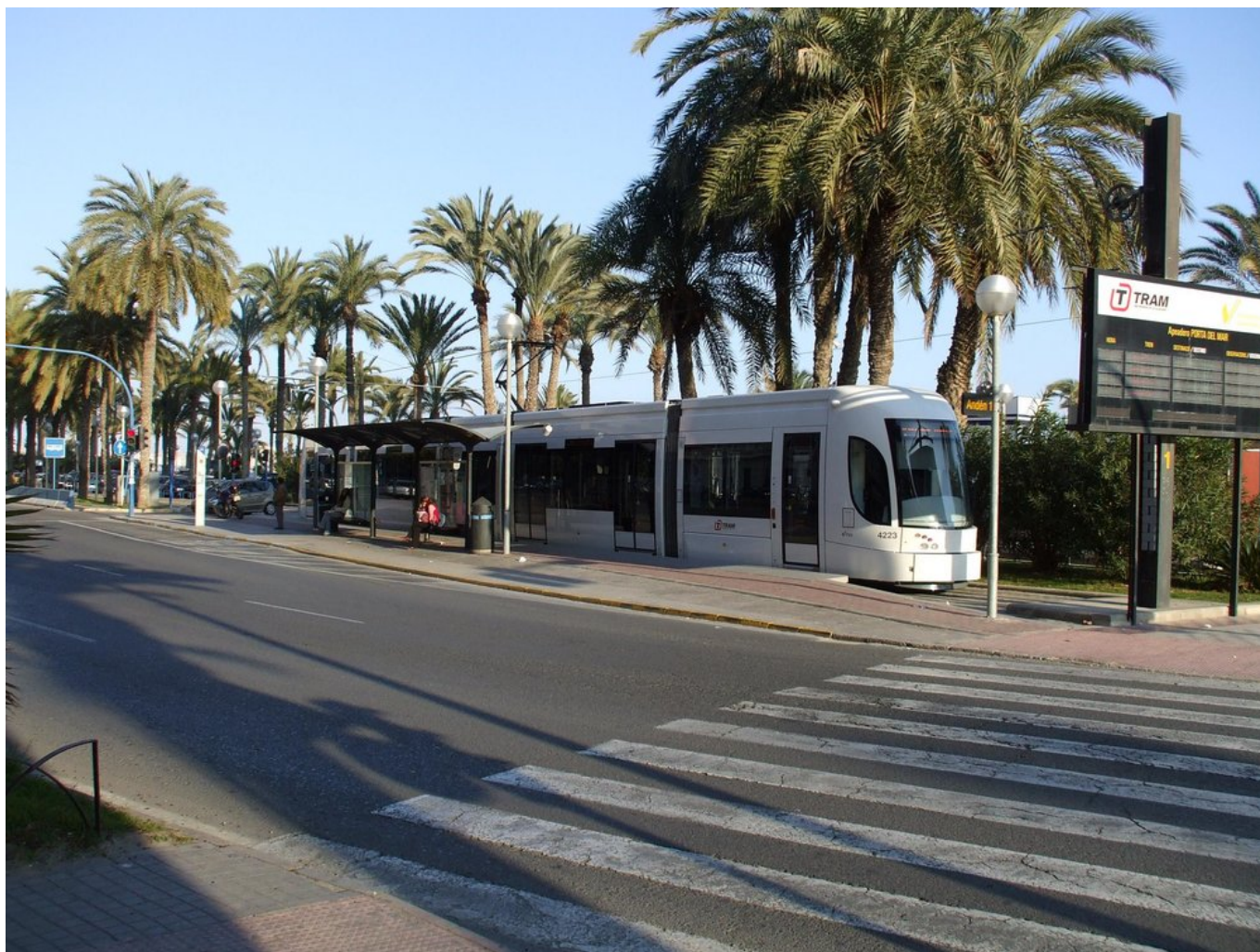
Zastávka Puerta del Mar v lednu 2008