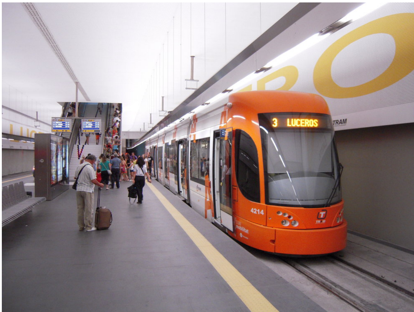
Konečná zastávka Luceros s tramvají řady 4200