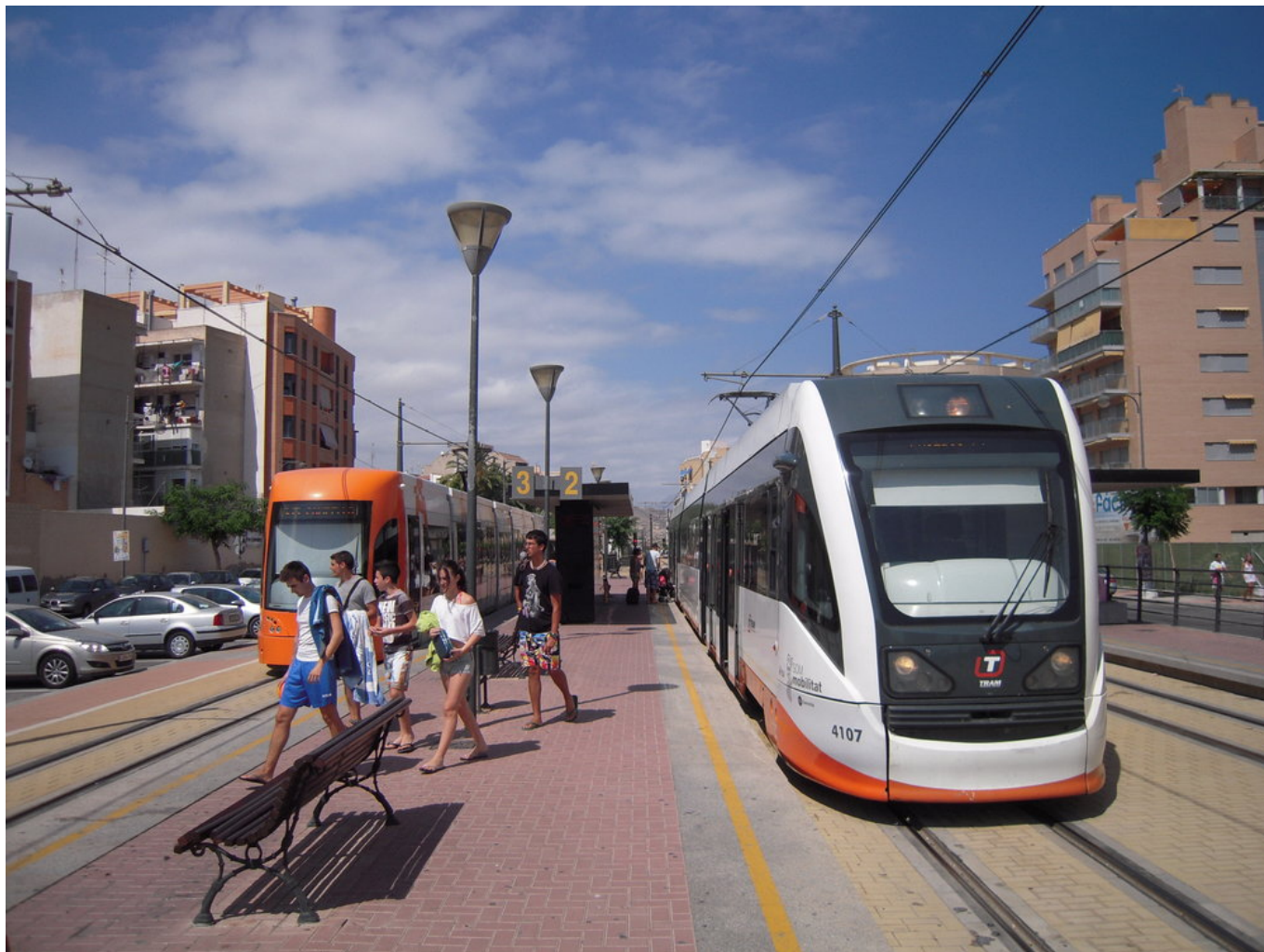
Zastávka El Campello