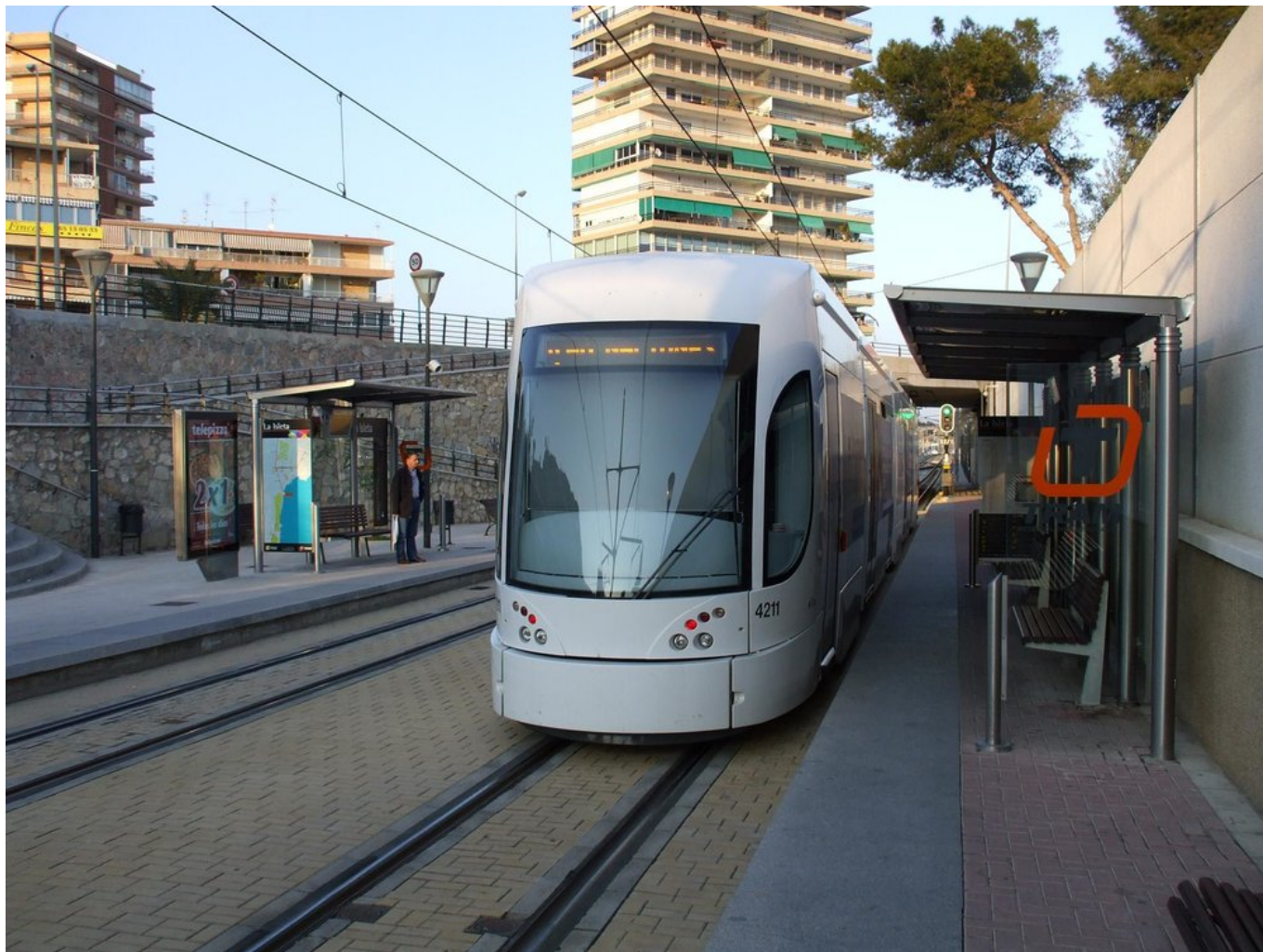
Zastávka La Isleta v roce 2008