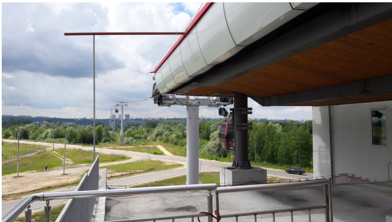
Dolní stanice lanové dráhy (Bor)