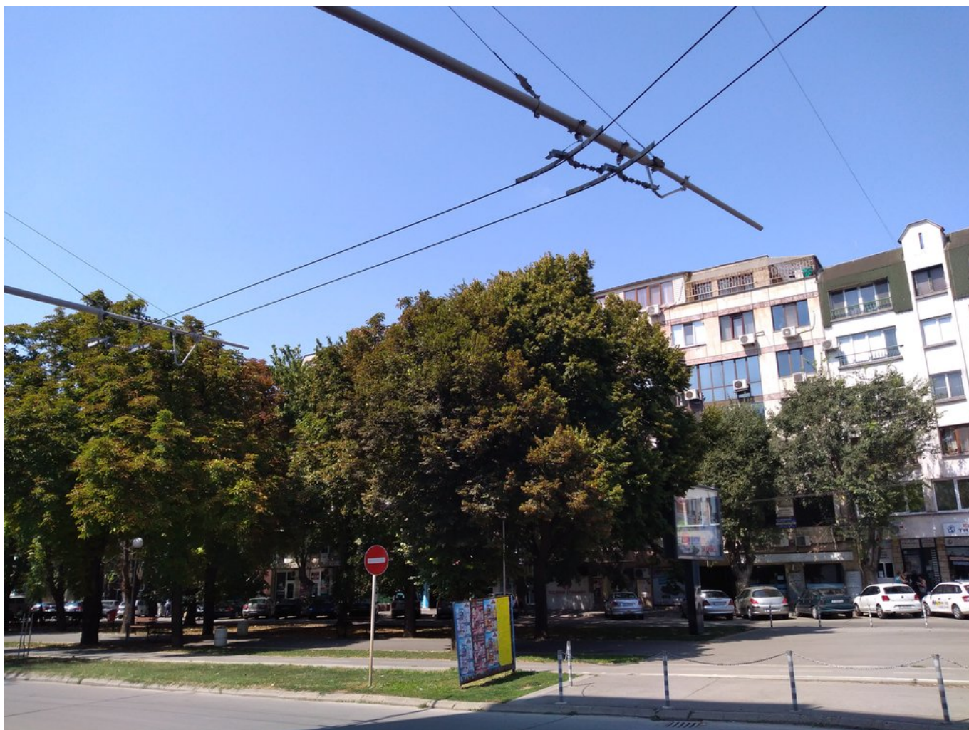
Naprosto funkční trať k hotelu Riga zůstává bez užitku. (4x)