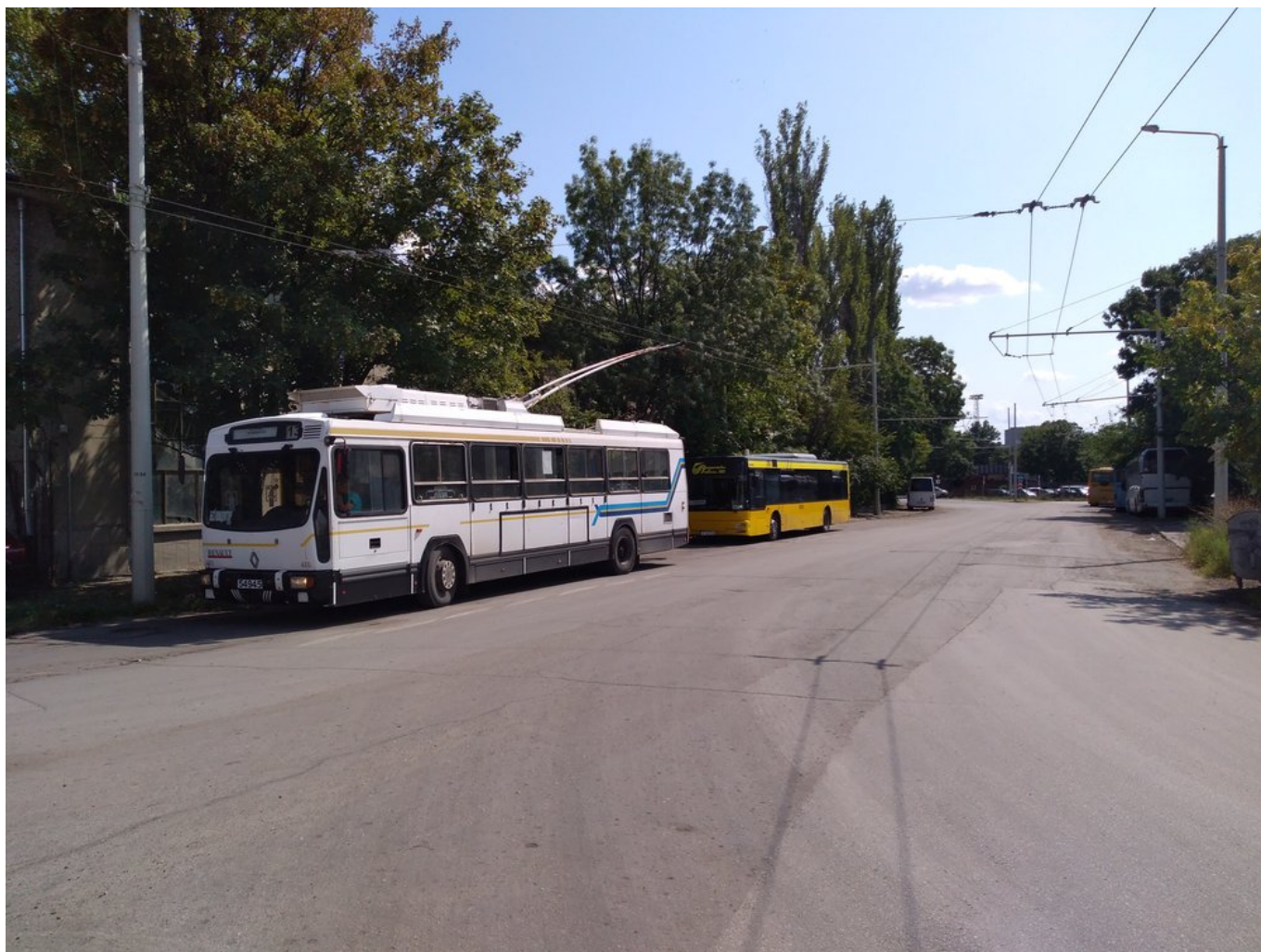
Točna u konečné Gara raspredělitelna (3x).