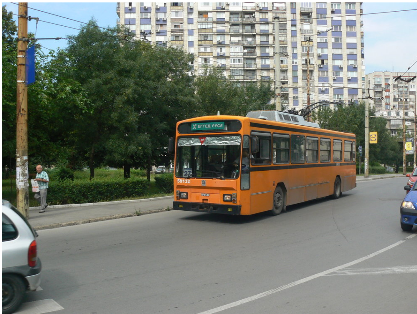
Následující galerie ukazuje snímky z roku 2014. (autor: 13x Zdeněk Sýkora)