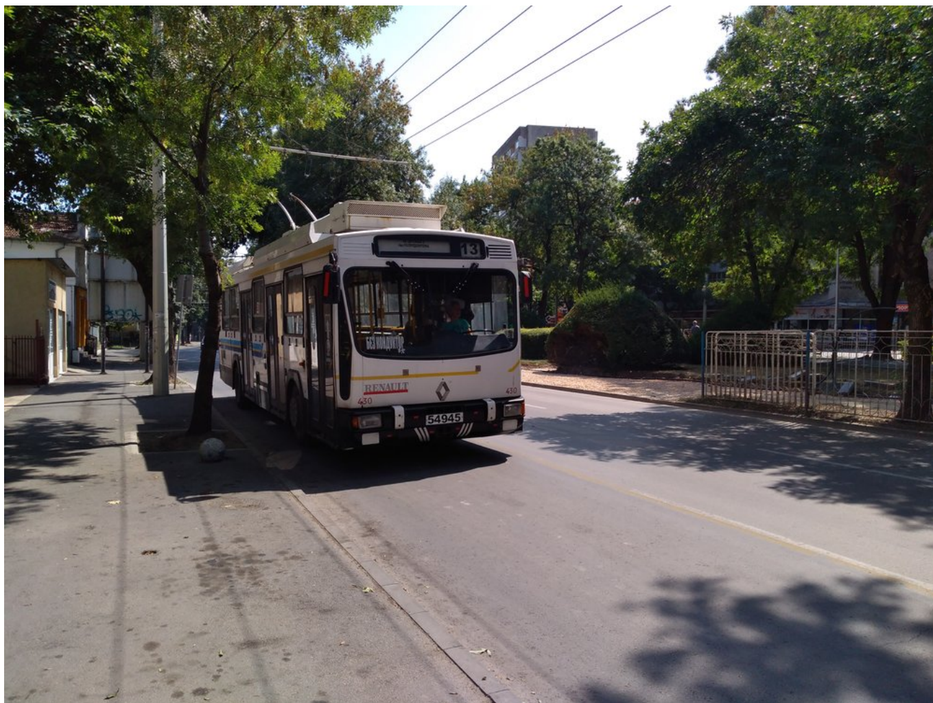
V centru města.