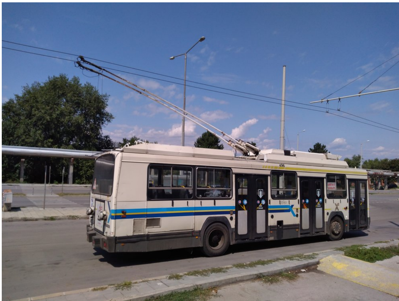
Konečná Zacharen zavod. (2x)