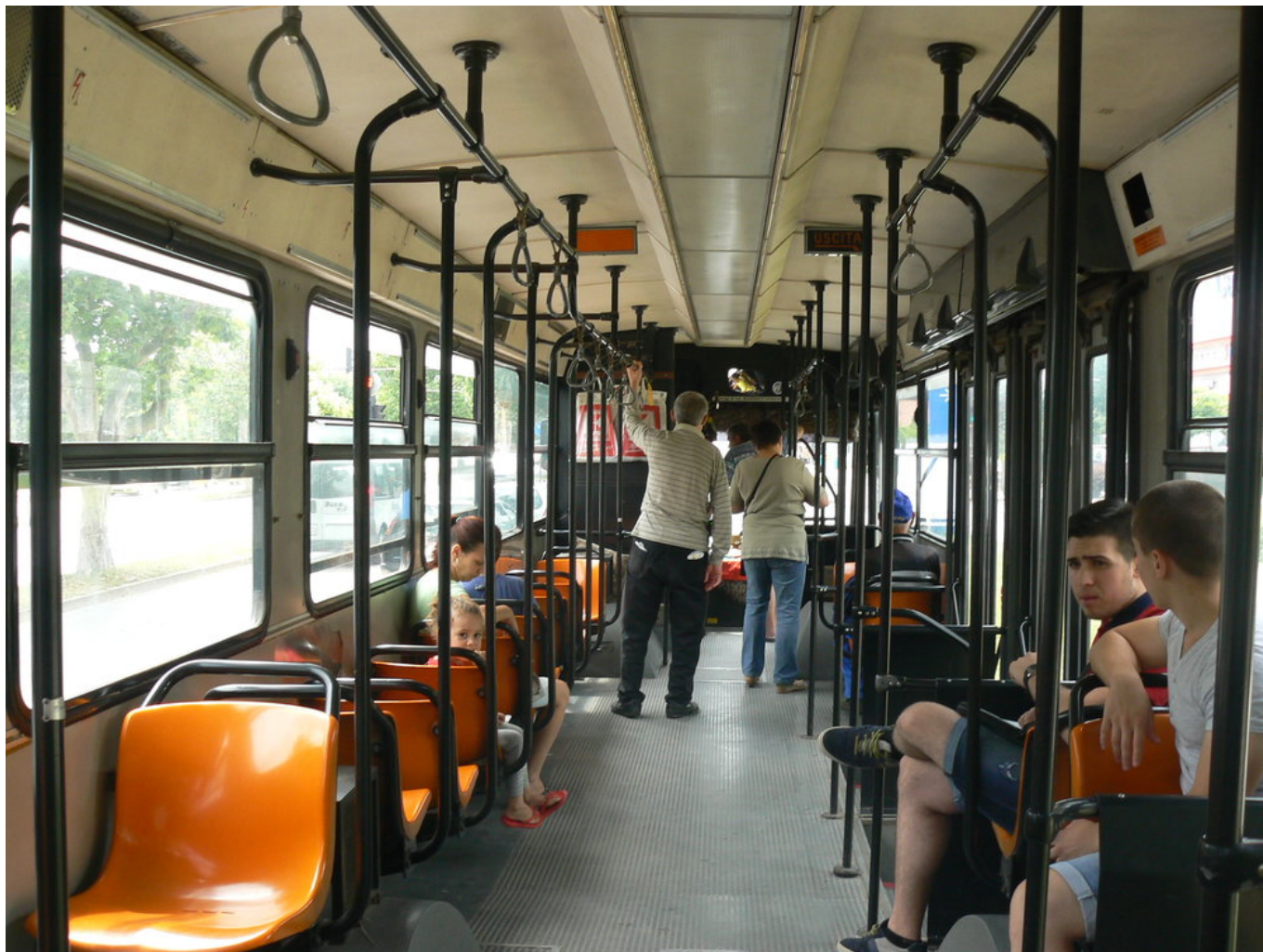
Interiér milánského vozu.