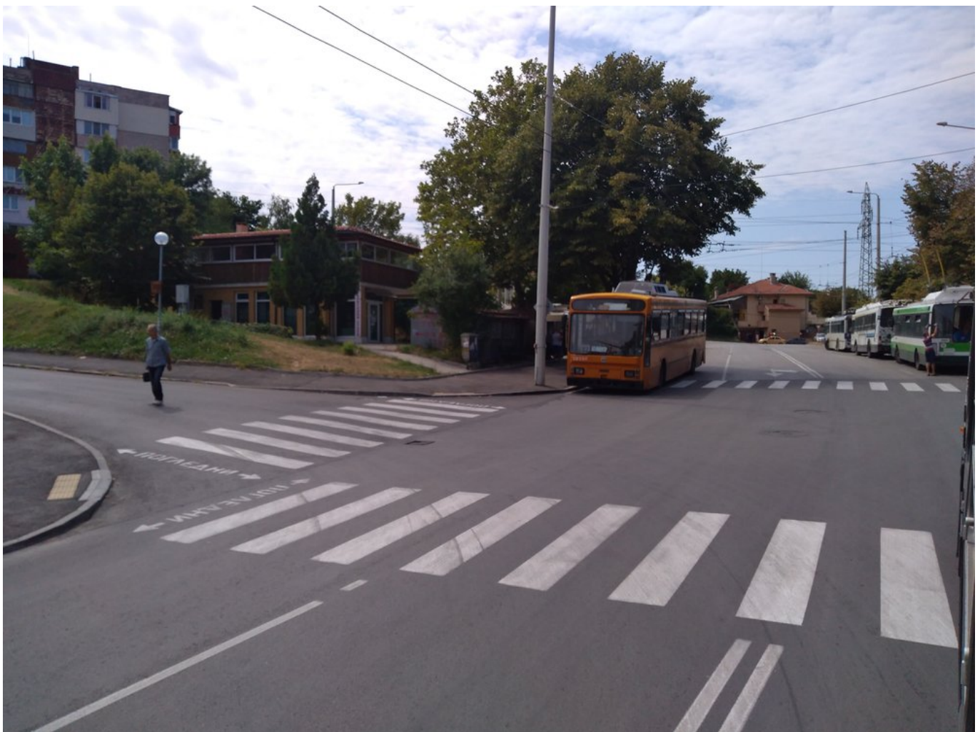
Při příjezdu na konečnou Družba-3.

Dodejme, že v Ruse jezdily hned dva elektrobusy SOR. Jeden z nich, typu SOR EBN 10.5, který začal svou kariéru v Banské Bystrici a Bratislavě, se ve městě objevil na zkoušku v roce 2015 a dnes jezdí v Krnově a druhý, typu SOR EBN 8, který byl testován i v Budějovicích, Banské Bystrici, Havířově a dalších bulharských městech, tam dorazil na počátku roku 2018 a měl tam parazitovat na různých trolejbusových linkách. Nepodařilo se zjistit, kde je elektrobus nyní.