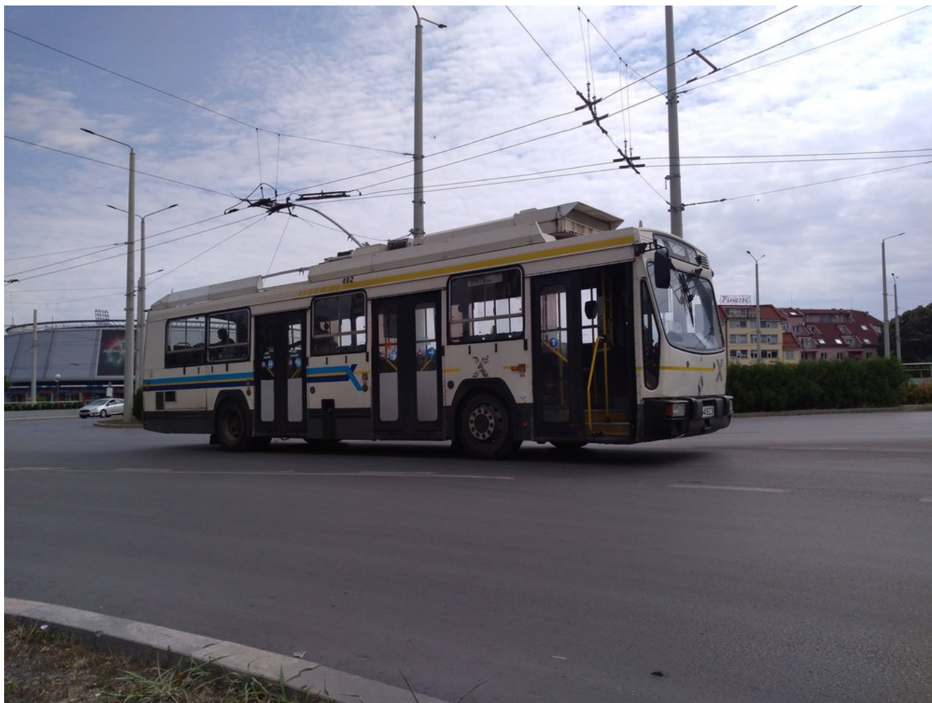
Vyprošťování ex-limožského vozu Renault ER100 ev. č. 492. (2x)