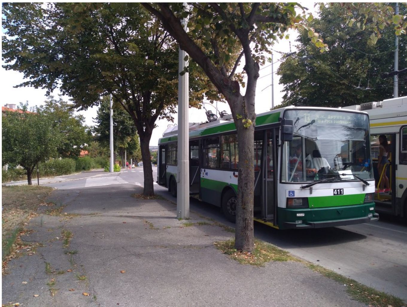
Snažila se schovat, ale nakonec byla po celodenním hledání odhalena. Jediná dne 17. 8. 2019 nasazená ex-plzeňská 21 Tr ACI při 3hodinové odpolední siestě.