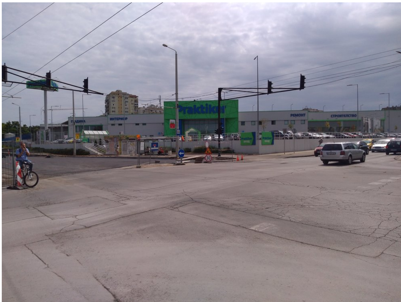
Momentálně neprůjezdný úsek na třídě Lipník.