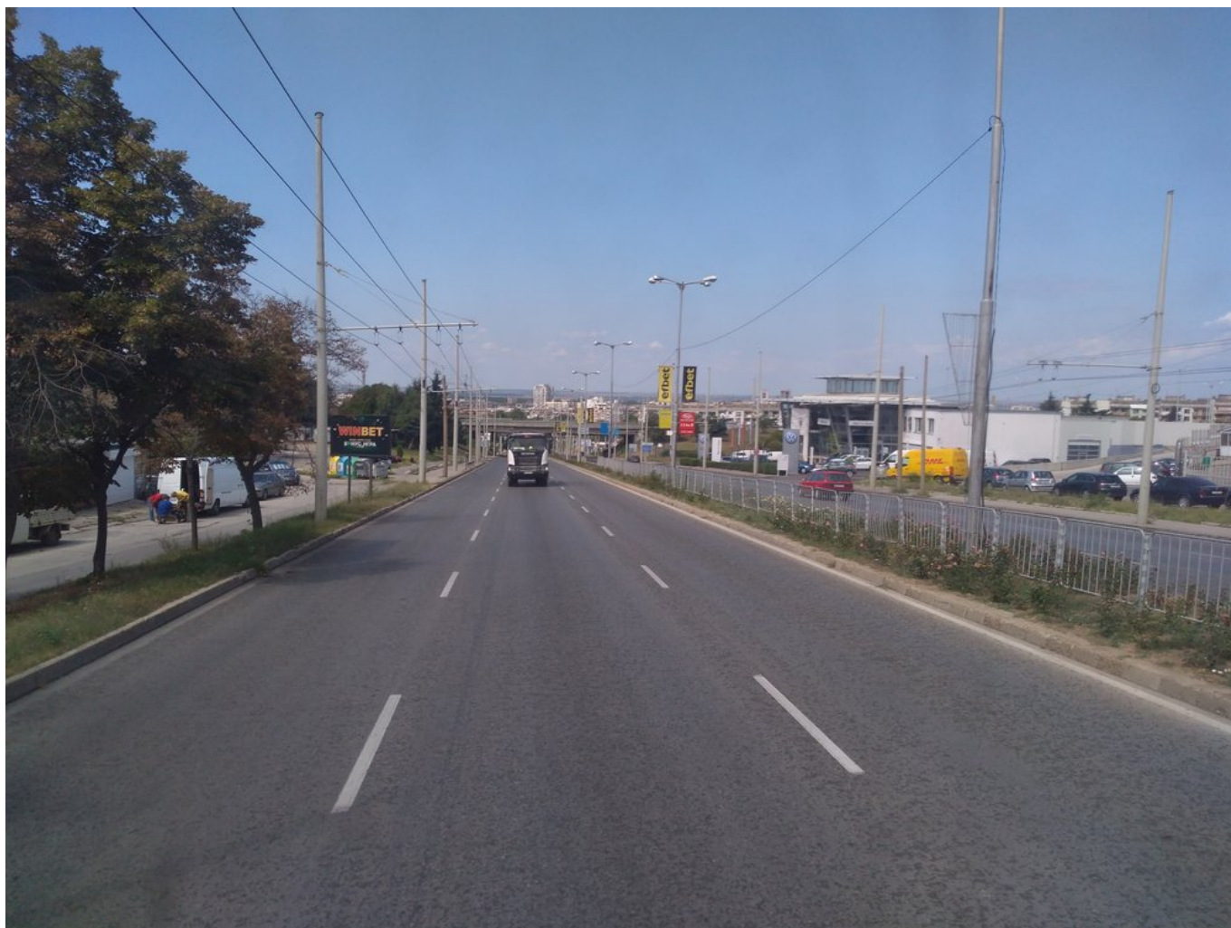
Při cestě z centra na sídliště Družba-3.