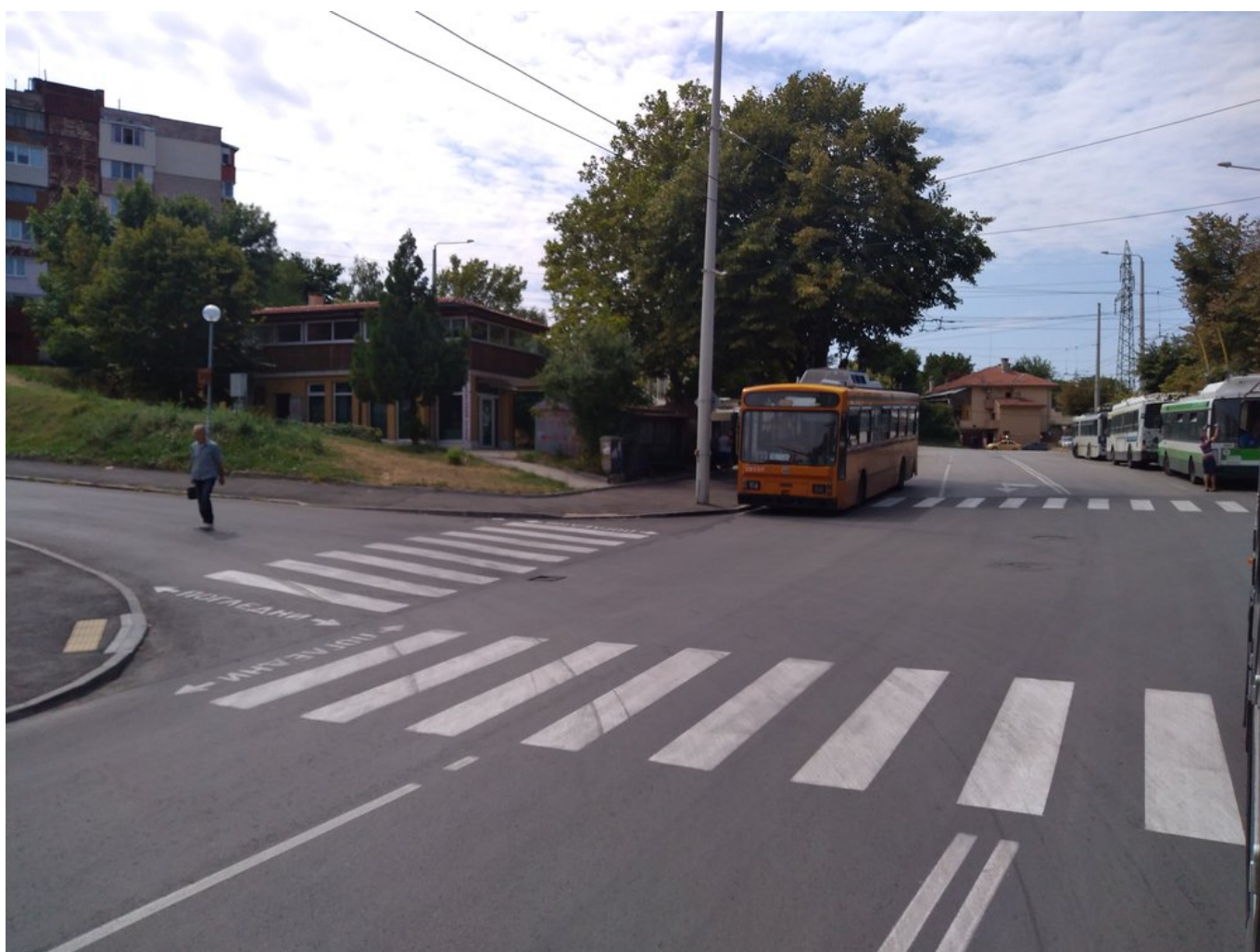
Při příjezdu na konečnou Družba-3.

Dodejme, že v Ruse jezdily hned dva elektrobusy SOR. Jeden z nich, typu SOR EBN 10.5, který začal svou kariéru v Banské Bystrici a Bratislavě, se ve městě objevil na zkoušku v roce 2015 a dnes jezdí v Krnově a druhý, typu SOR EBN 8, který byl testován i v Budějovicích, Banské Bystrici, Havířově a dalších bulharských městech, tam dorazil na počátku roku 2018 a měl tam parazitovat na různých trolejbusových linkách. Nepodařilo se zjistit, kde je elektrobus nyní.