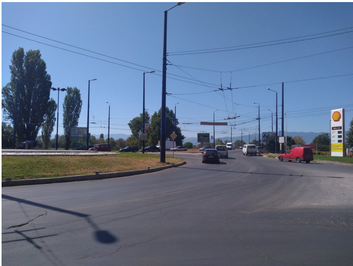
Tentýž "kruháč" ze severní strany.