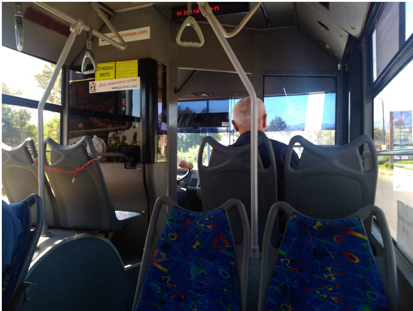
Pohled do potmělého interiéru vozu LAZ. Nad místem řidiče si lze povšimnout, jak se interiér opotřebovává.