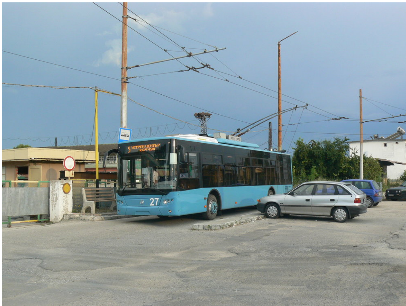
Ukrajinský LAZ E183A1 dodaný roku 2013.