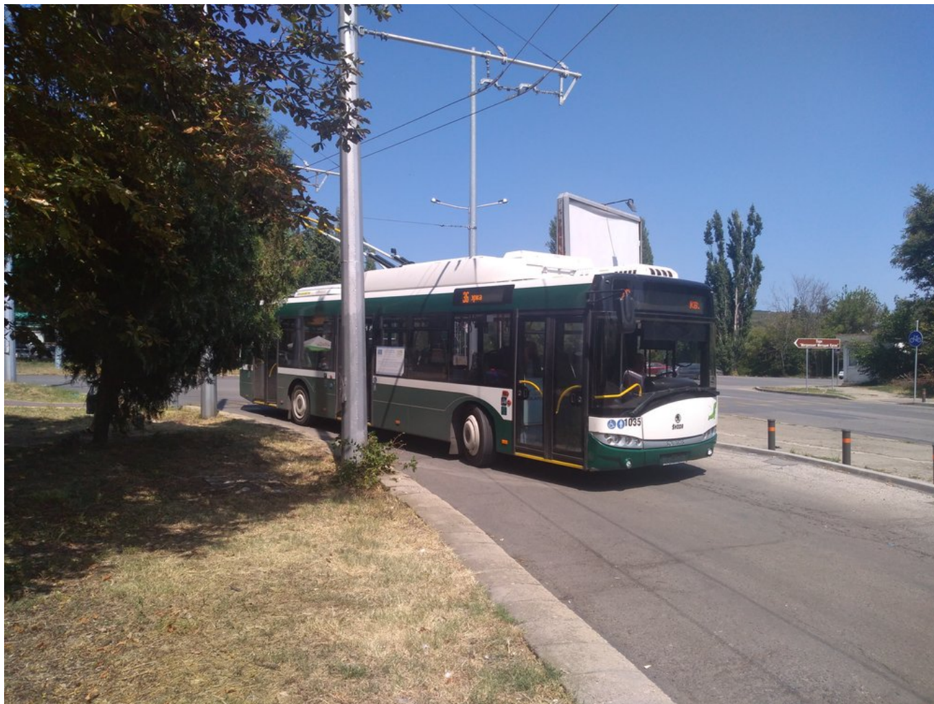
Konečná PZ "Zagorka" na severovýchodě města.