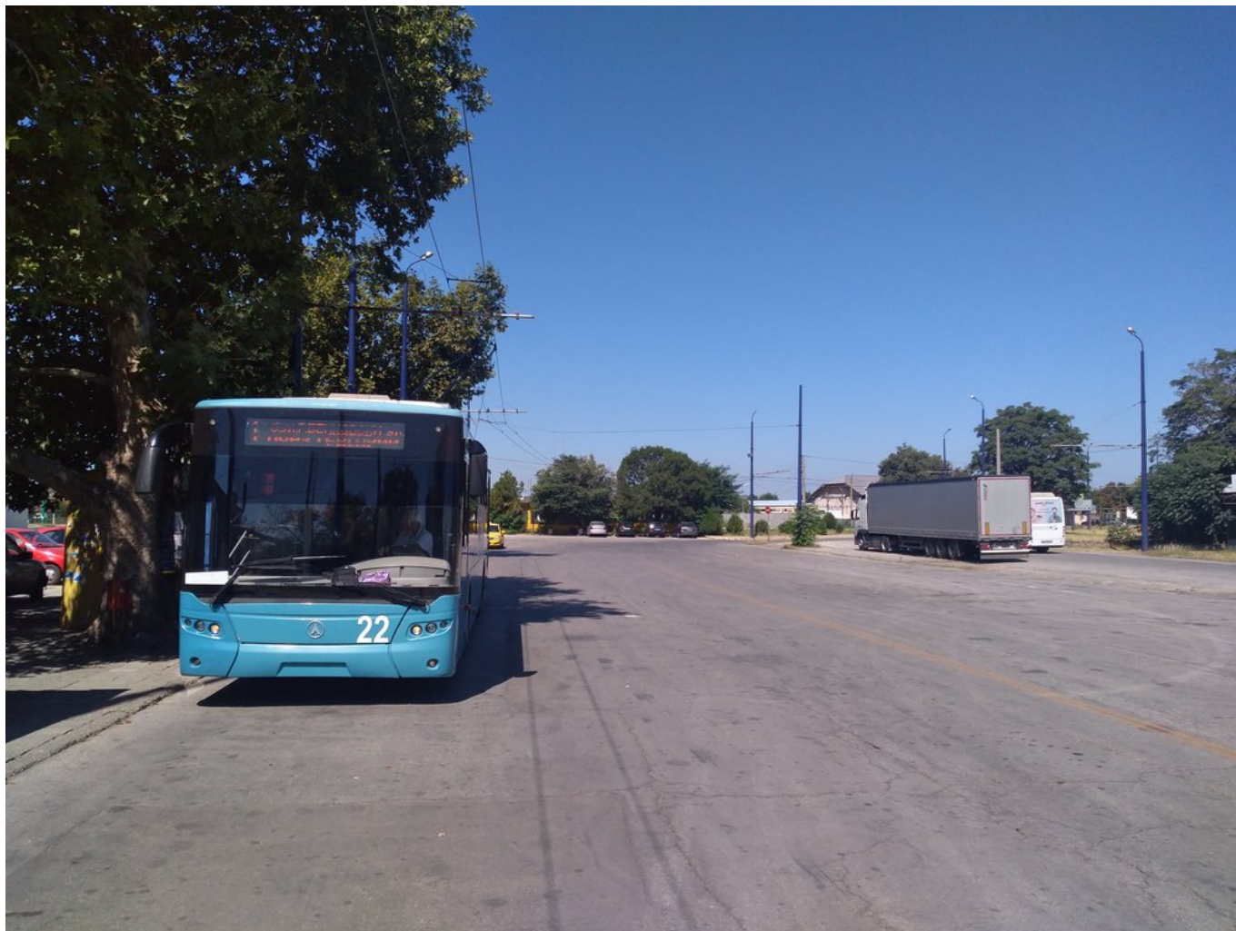
U nádraží (2x).