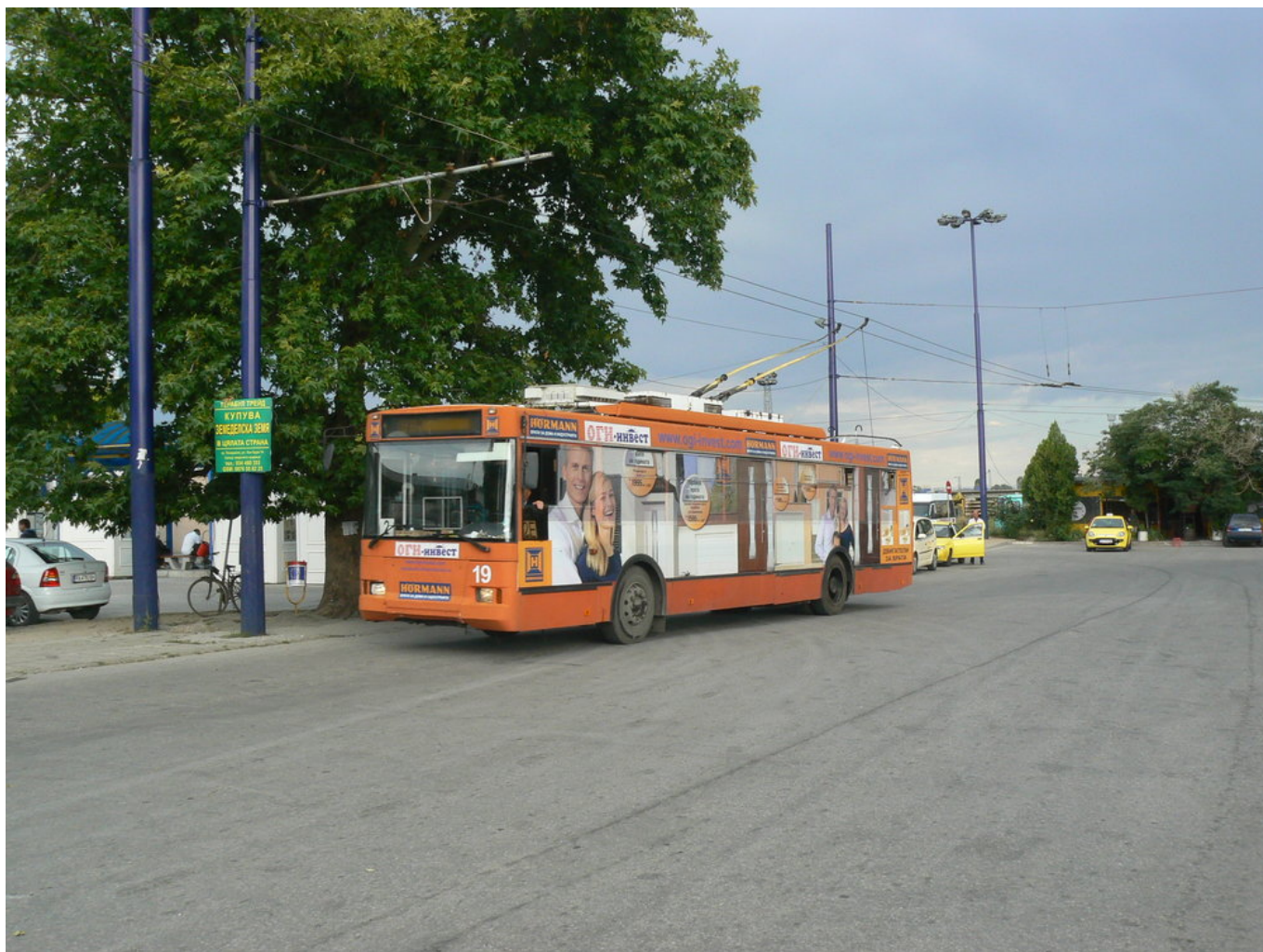
Trolza 5275.05 Optima.