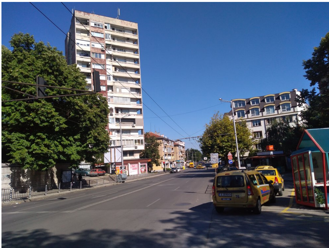
Tento a další snímky jsou již z centra města.