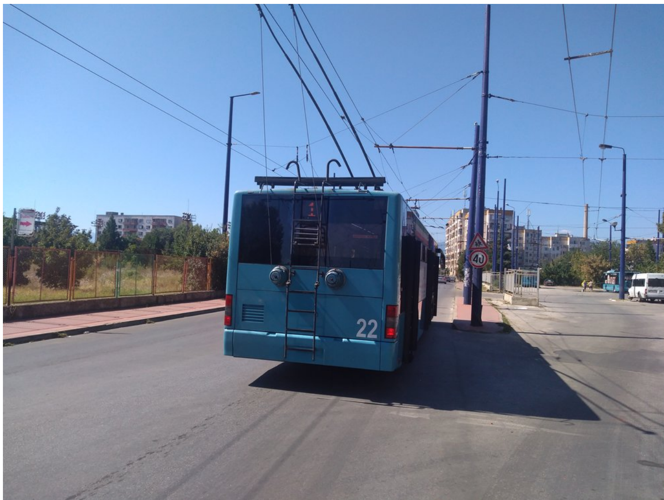
U vozovny na severozápadě města. (7x)