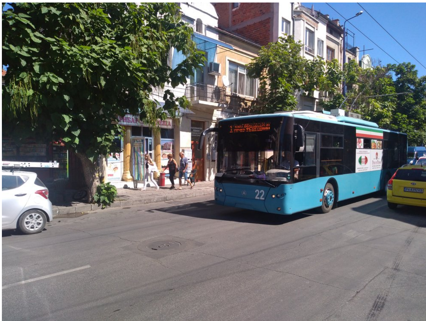
Trolejbus u centra (2x).