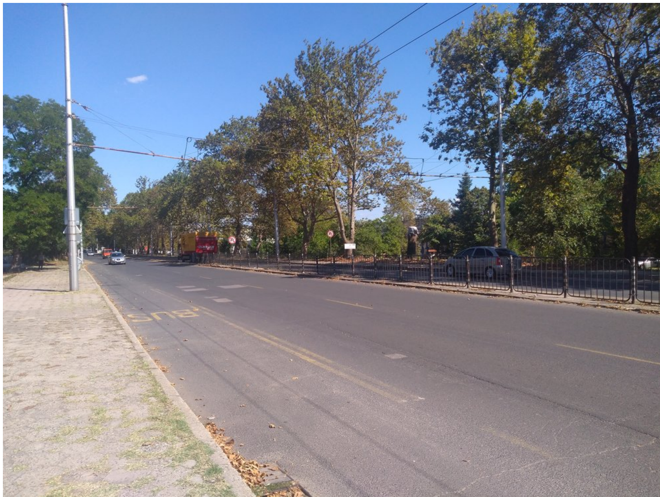
Pohled směrem k východní konečné.