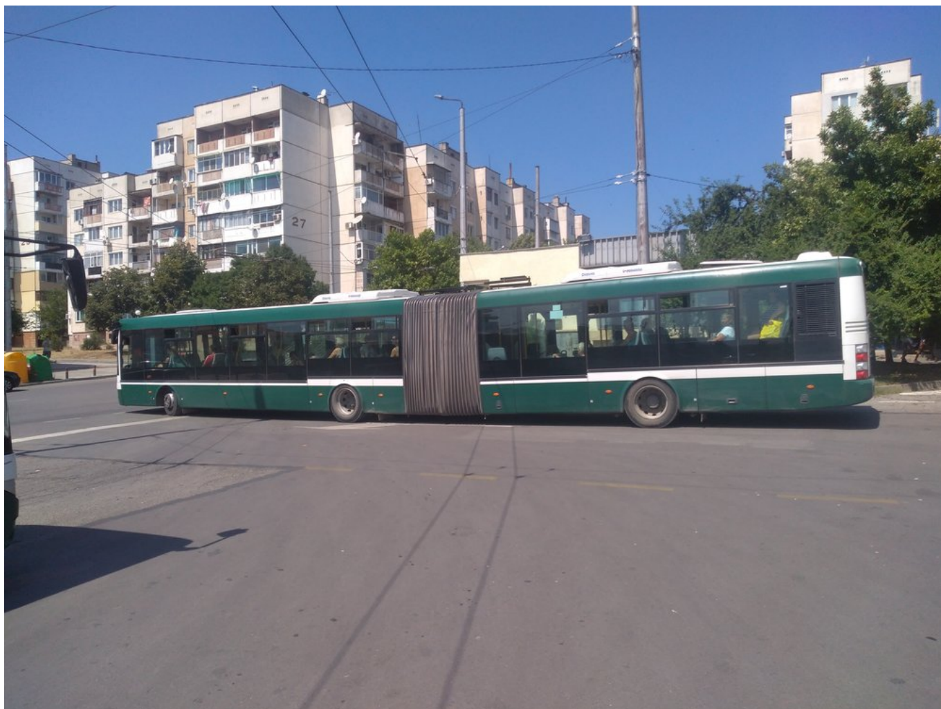
Ve městě jezdí několik kloubových vozů SOR.