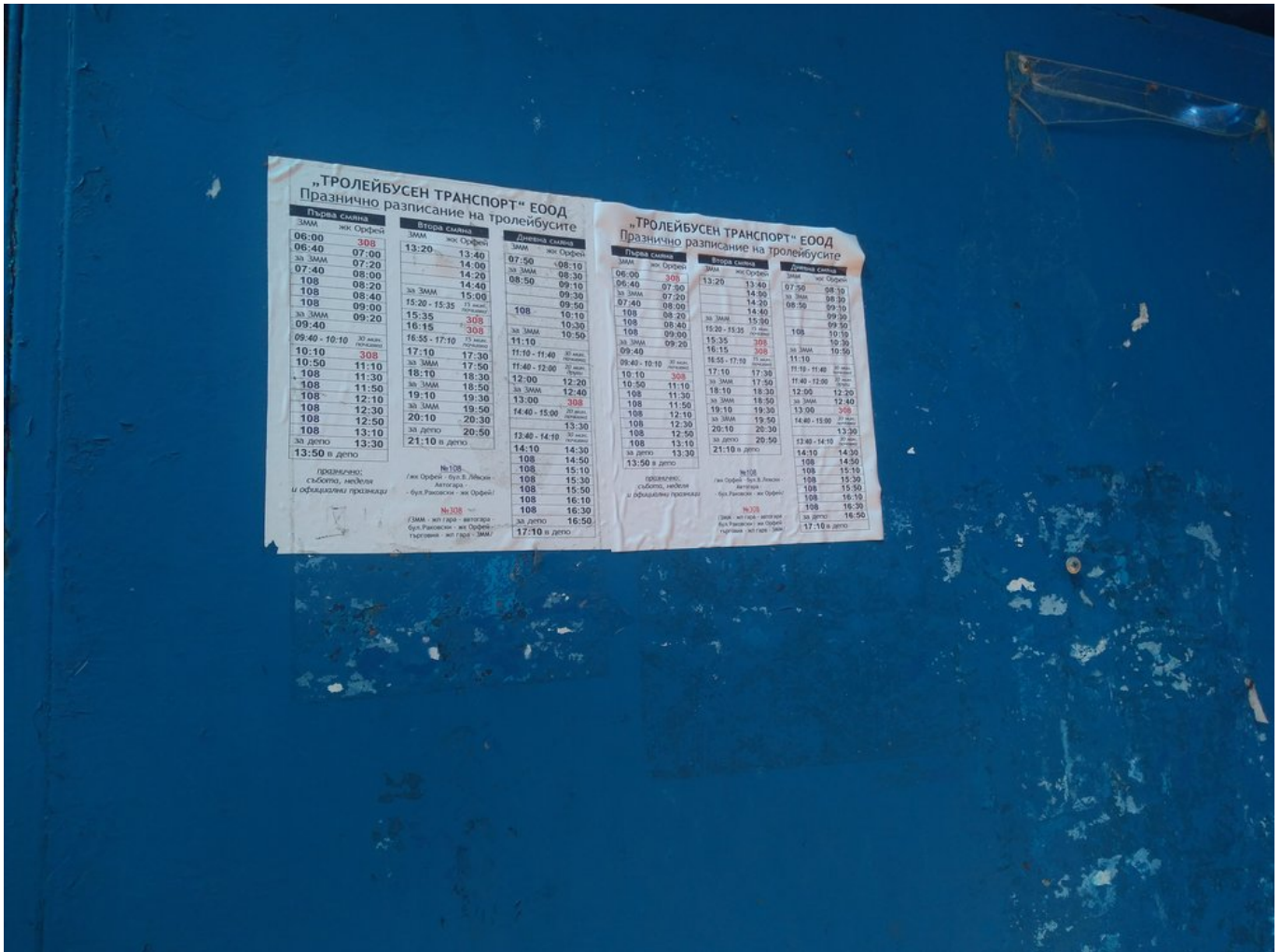
Jízdní řád u nádraží aneb v tom aby se čert vyznal...

Momentálně se o provoz na místní síti o délce zhruba 7,5 km (v jednom směru) starají už jen "čtrnáctky". Dvě z nich (14 Tr08/6) přišly roku 2008 ze Szegedu, původně ale byly zlínské. Další tři dorazily roku 2015 z Varny, jedna z nich (typu 14 Tr07, zbývající dvě odpovídaly provedení 14 Tr06) ovšem byla původně prešovská a navíc dorazila pouze na náhradní díly.