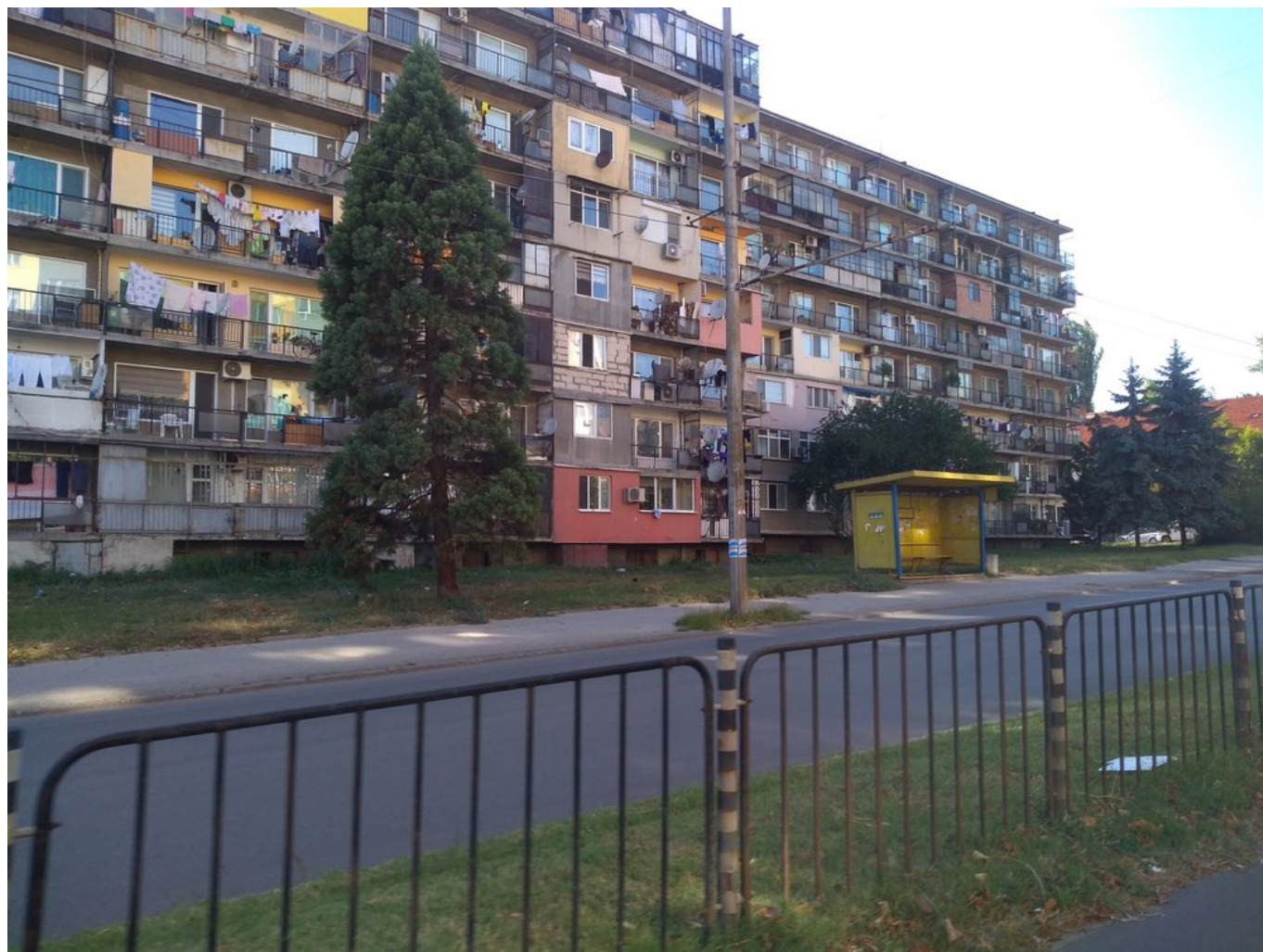
Severovýchodně od centra.