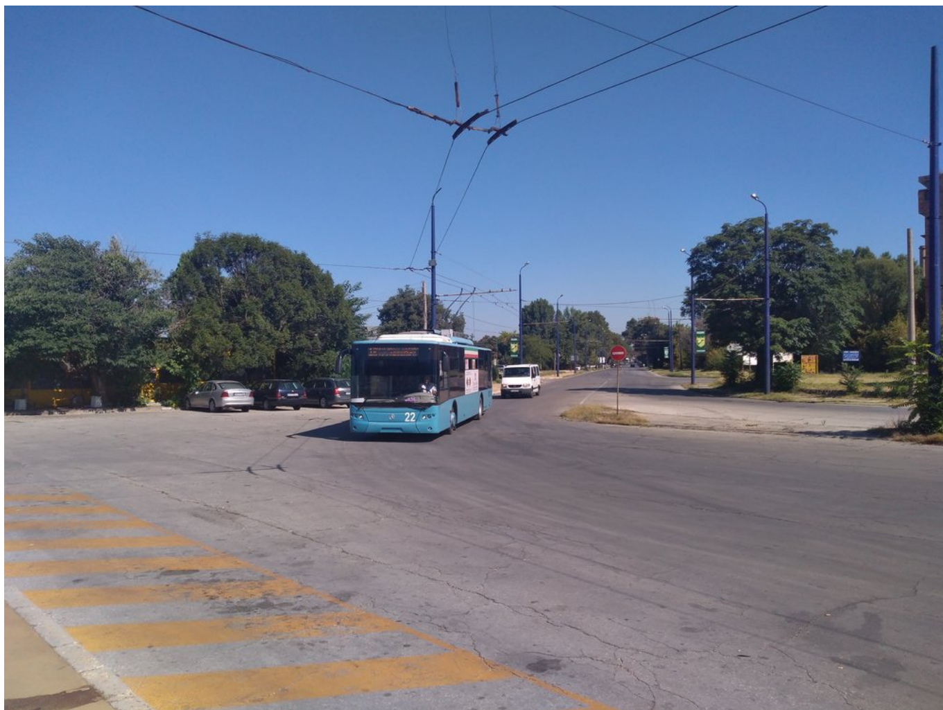
U nádraží (2x).

Z dlouho existujících linek 1, 1E, 2, 2E, 4 a 5 dnes trolejbusy potkáme jen na linkách 1 a 1E, které se od sebe liší pouze alternativním trasováním mezi centrem a jižně ležícím vlakovým nádražím. Linky 2, 2E a 4 jsou obsluhovány autobusy, oficiálně dočasně, avšak se nezdá, že by mělo město s obnovou přerušeno úseku naspěch (doprovce na náš dotaz, zda bude trať obnovena, nereagoval). Linka č. 5 jezdí jen mimo prázdniny (od září do května). Jízdních řádů se na zastávkách člověk obvykle nedočká, v trolejbusy jsou vylepeny na oknech poněkud amatérským způsobem. Web dopravce není co do jízdních řádů zcela jednoznačný a cizinec z něj jen sotva zjistí, co ještě platí a co ne. Trolejbusy každopádně začínají jezdit o půl šesté ráno a končí před desátou večerní, nabídka spojů je o víkendech redukována jen nepatrně . Místní provoz dnes zaujme snad už jen vozovnou ležící na sídlišti. Ve vozech LAZ nainstalovaná klimatizace salónu cestujících nefunguje a jezdí se s otevřenými okny. Interiér je místy značně opotřeben.