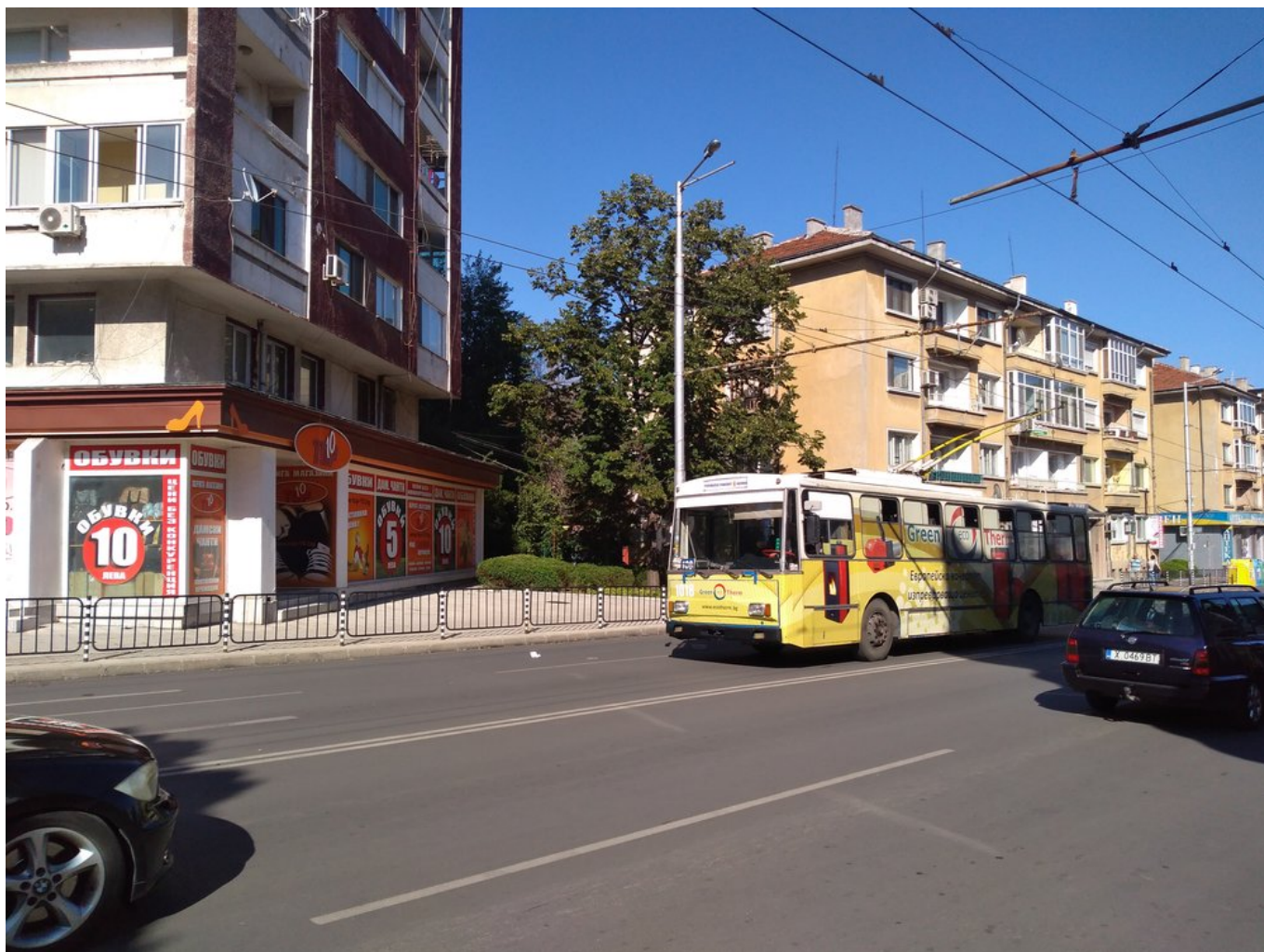
Ex-varenská 14 Tr.