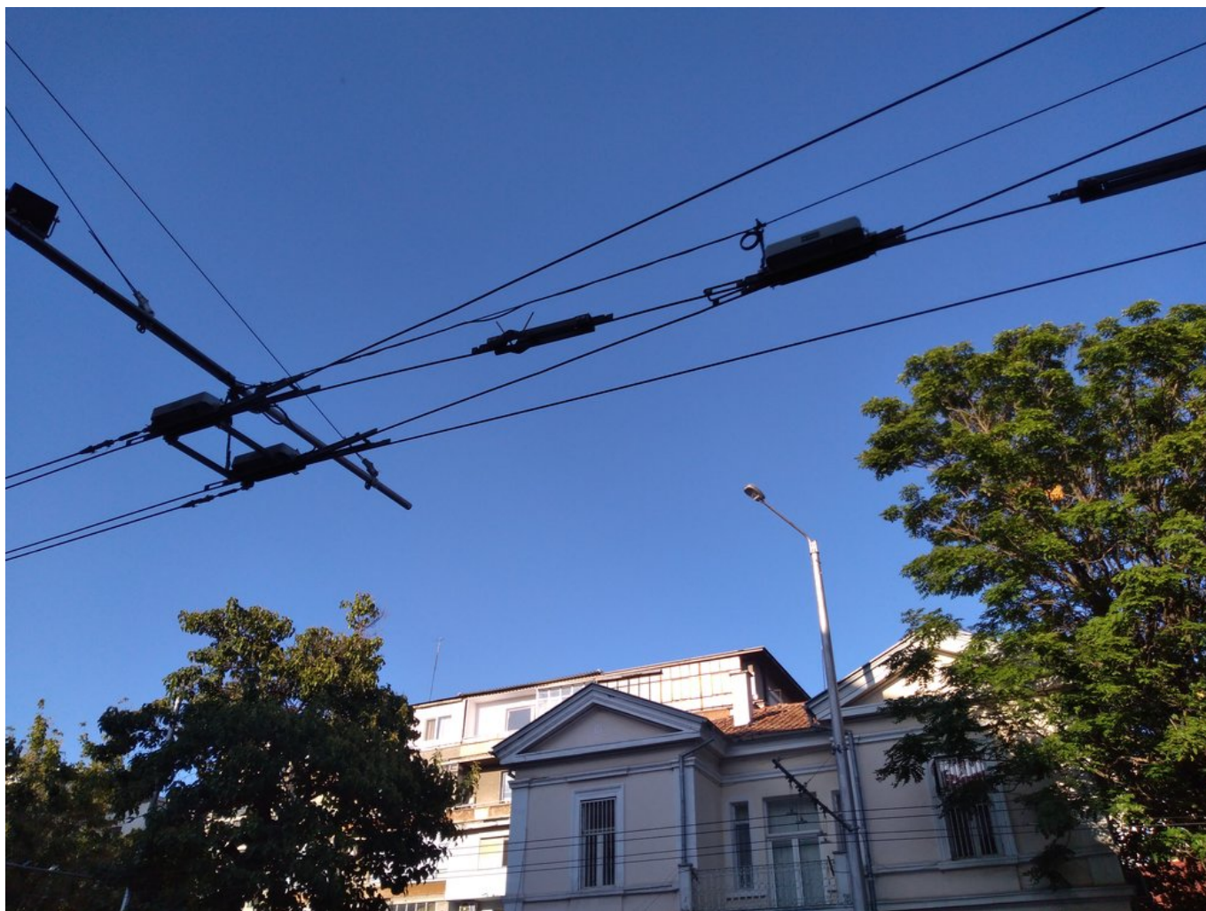
Výhybka od společnosti Elektroline.