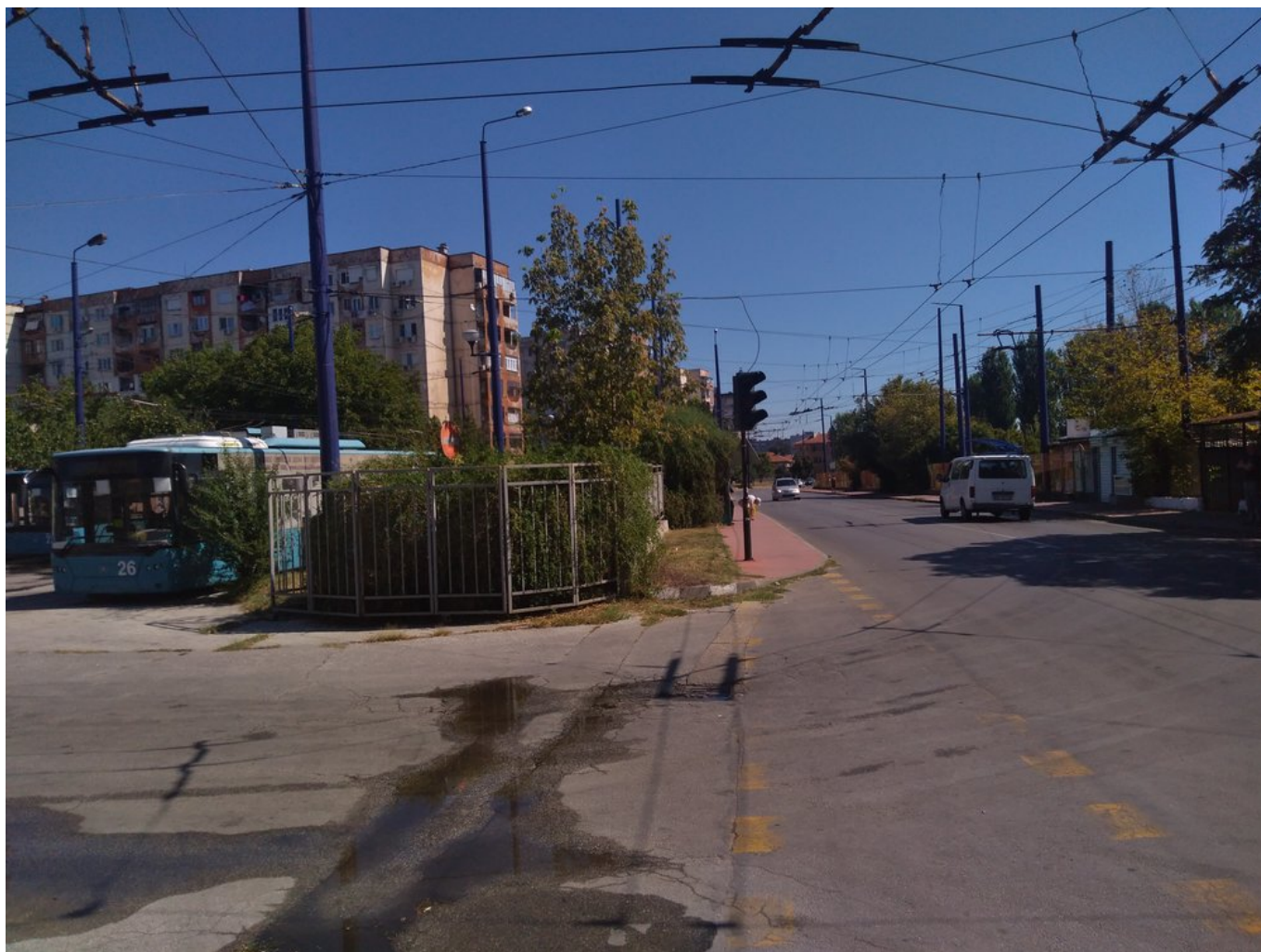
Výjezd z vozovny, pohled na sever.