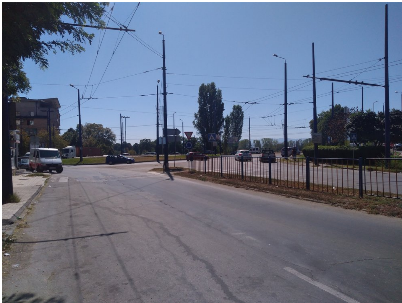
Zde vidíme napojení neprovozované trati u kruhového objezdu umístěného jižně od centra města.