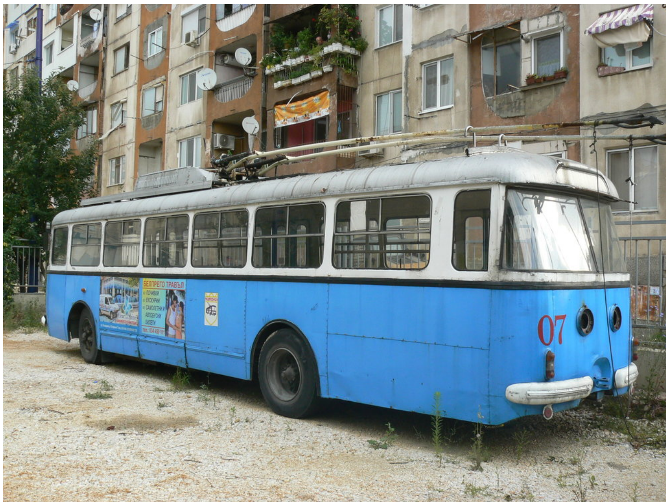
Ex-zlínská 9 TrHT28. Dojezdila teprve roku 2017.