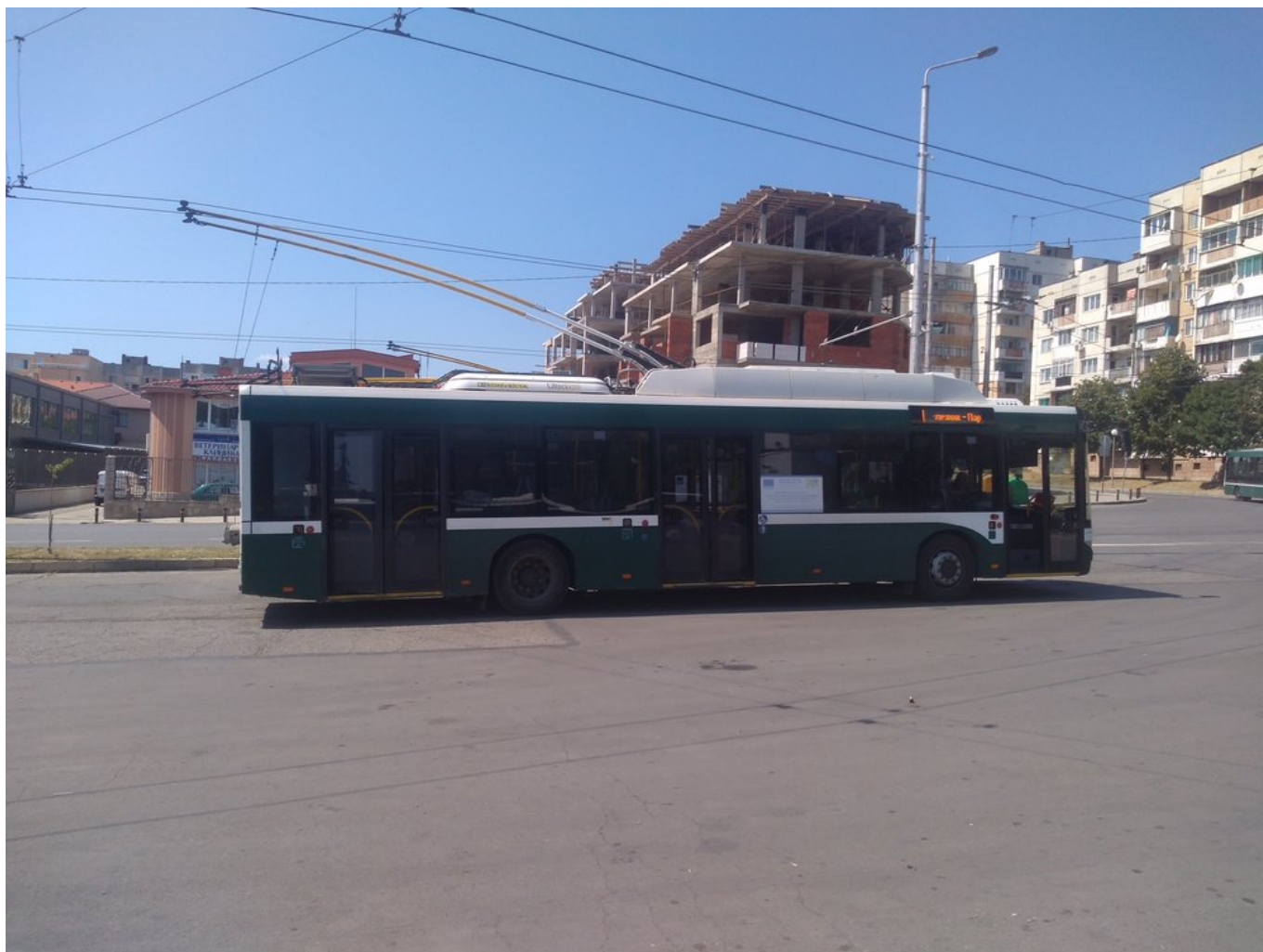
Konečná Železnik na západě města.