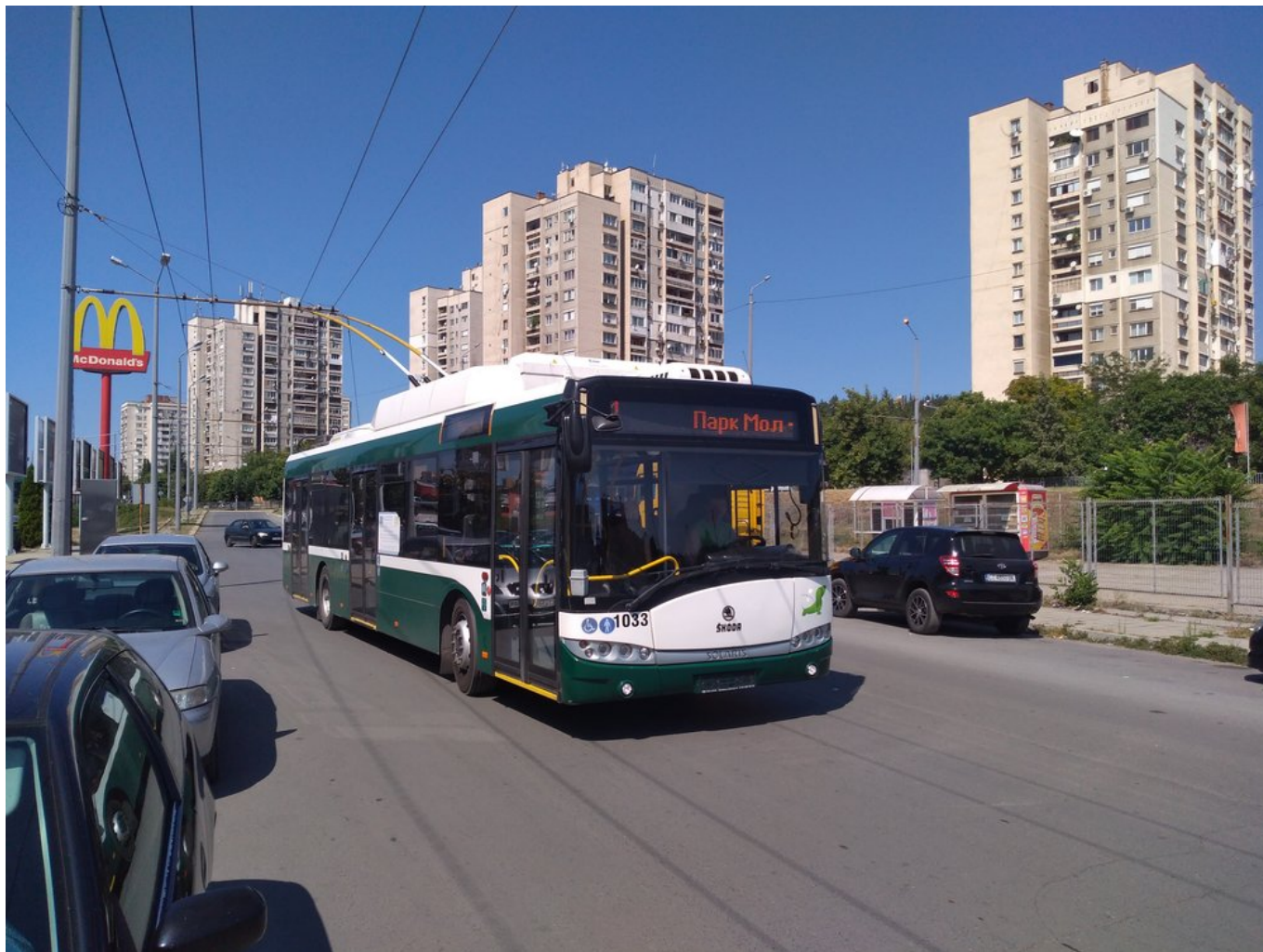
Konečná Park Mol na východě města (2x).