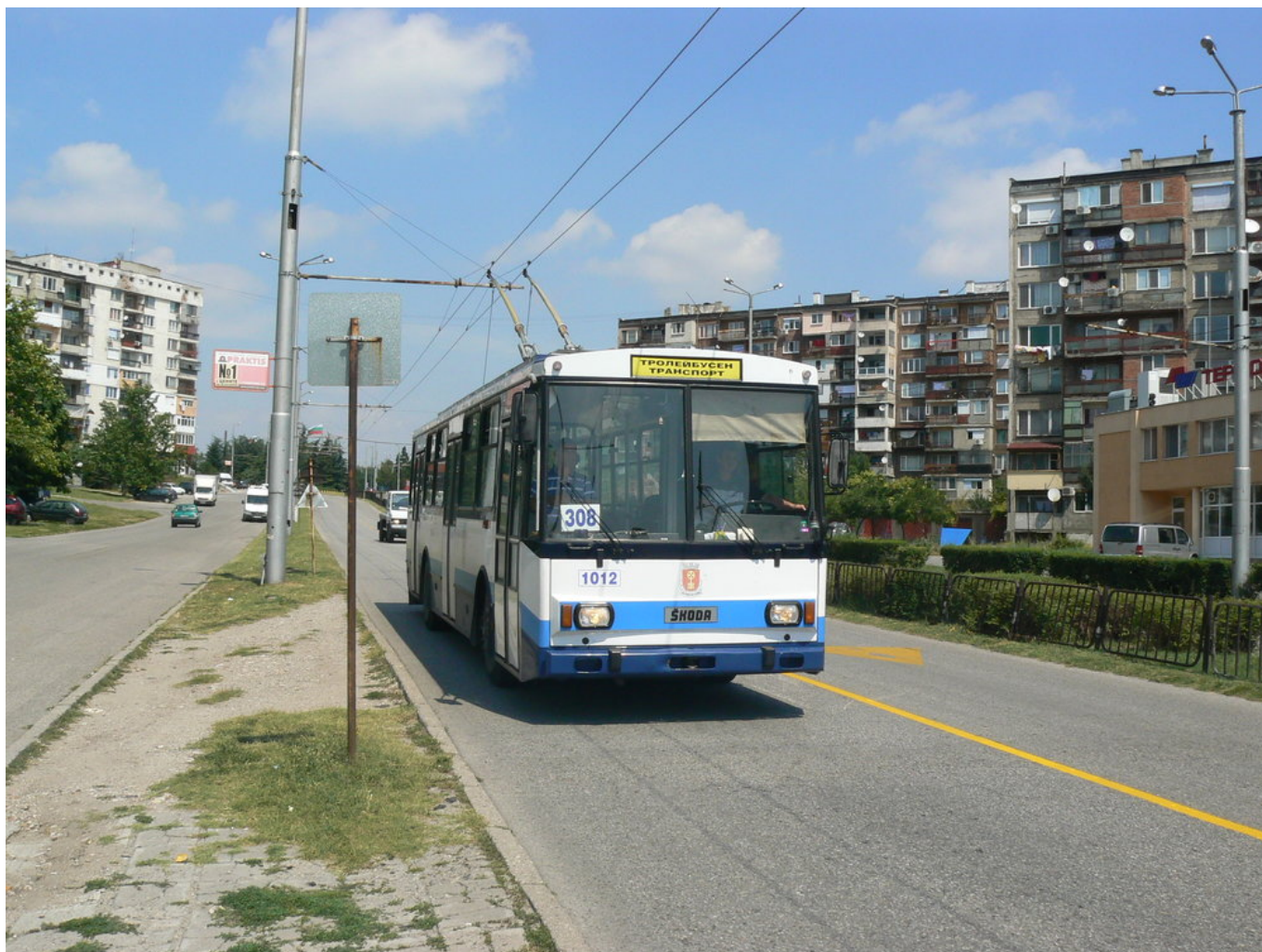
Snímky z roku 2014.