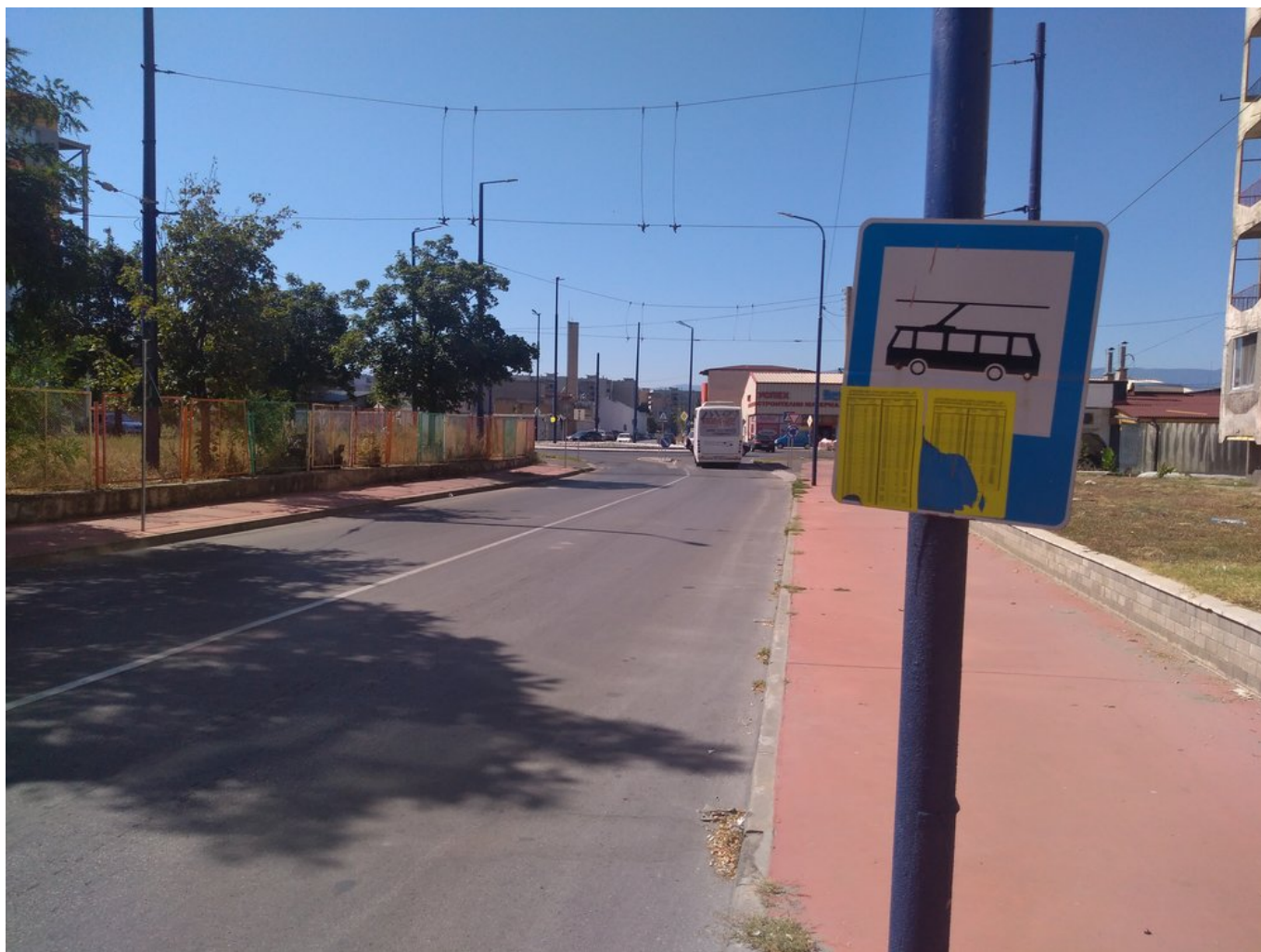
Úsek u nového kruhového objezdu, kde byla trolej přerušena.