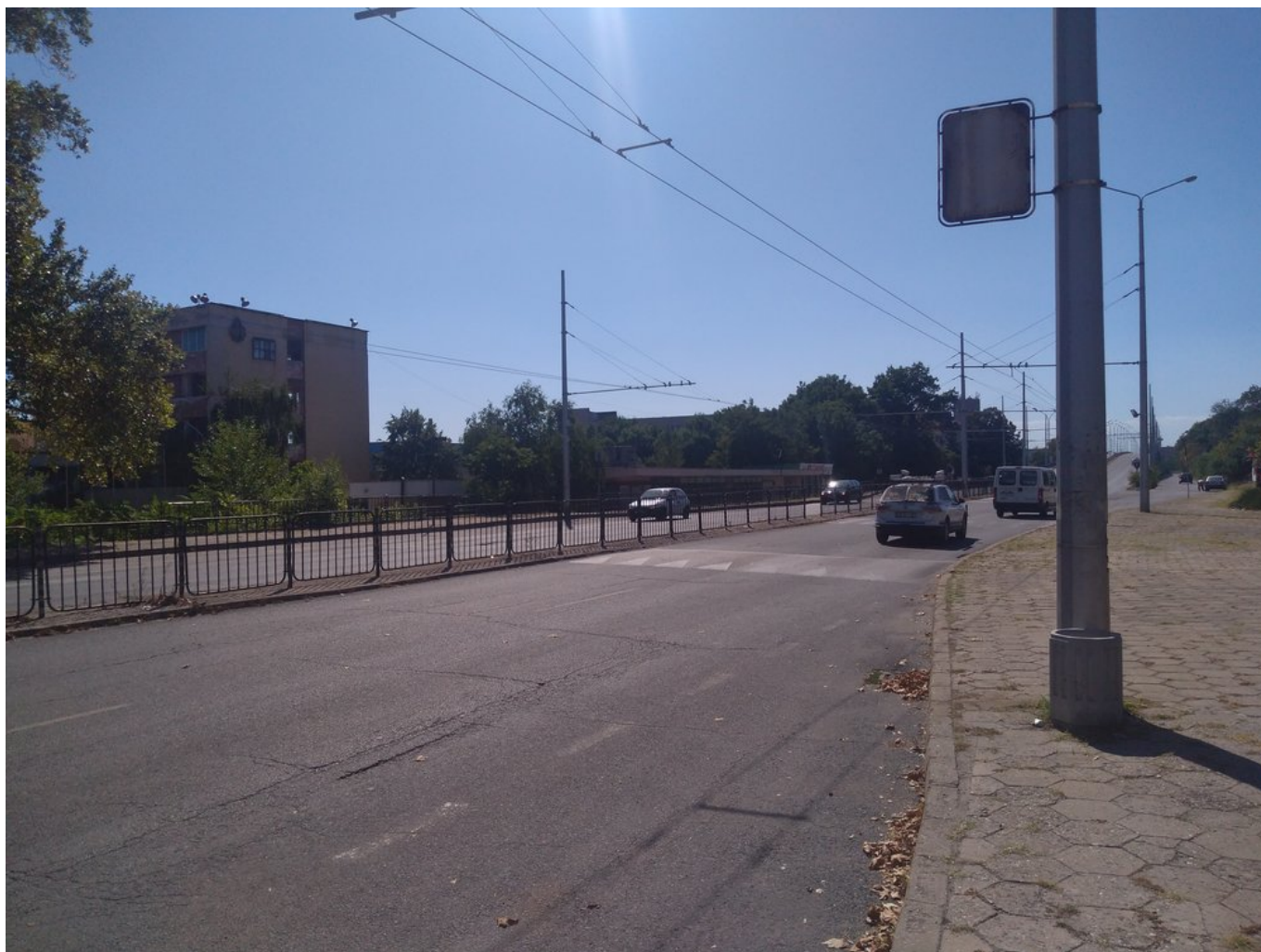
Pohled do centra.