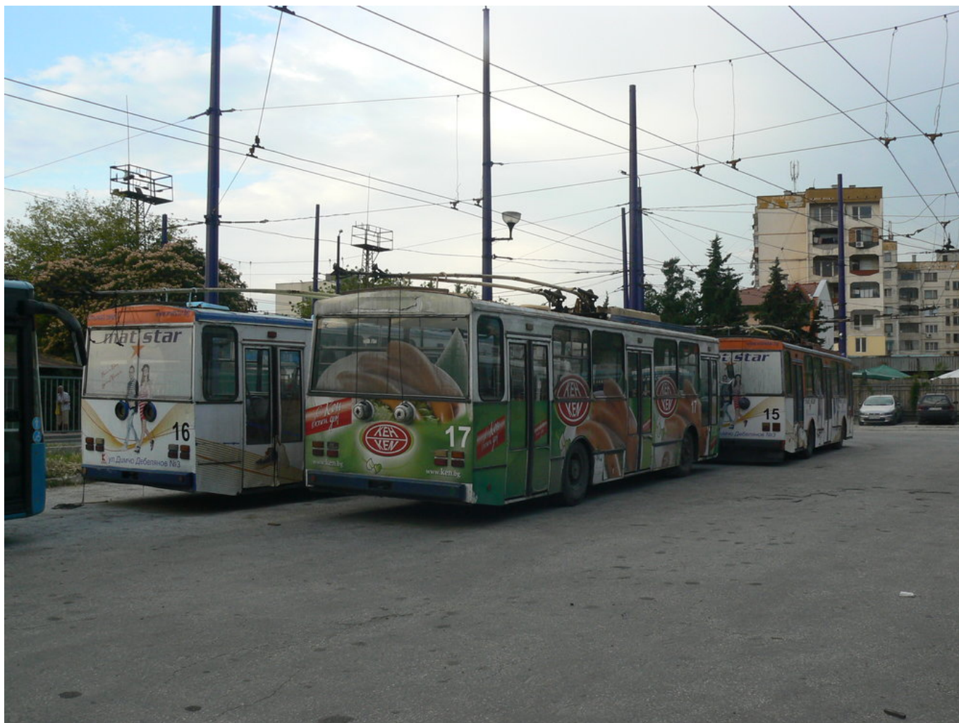
Následující galerie ukazuje snímky z roku 2014. První tři snímky jsou z vozovny.