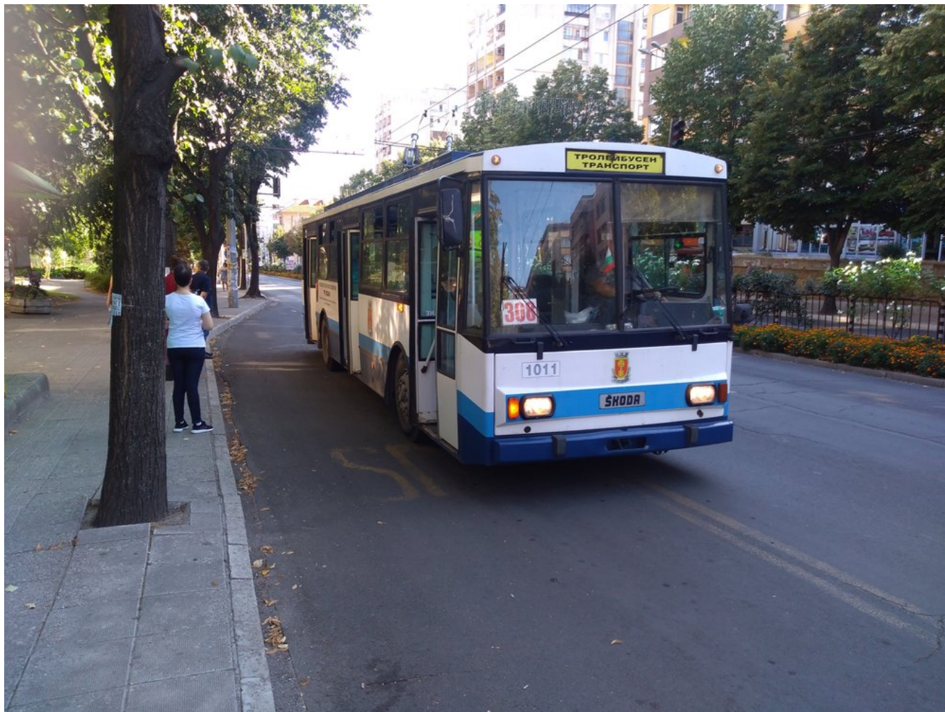
Severně od centra.