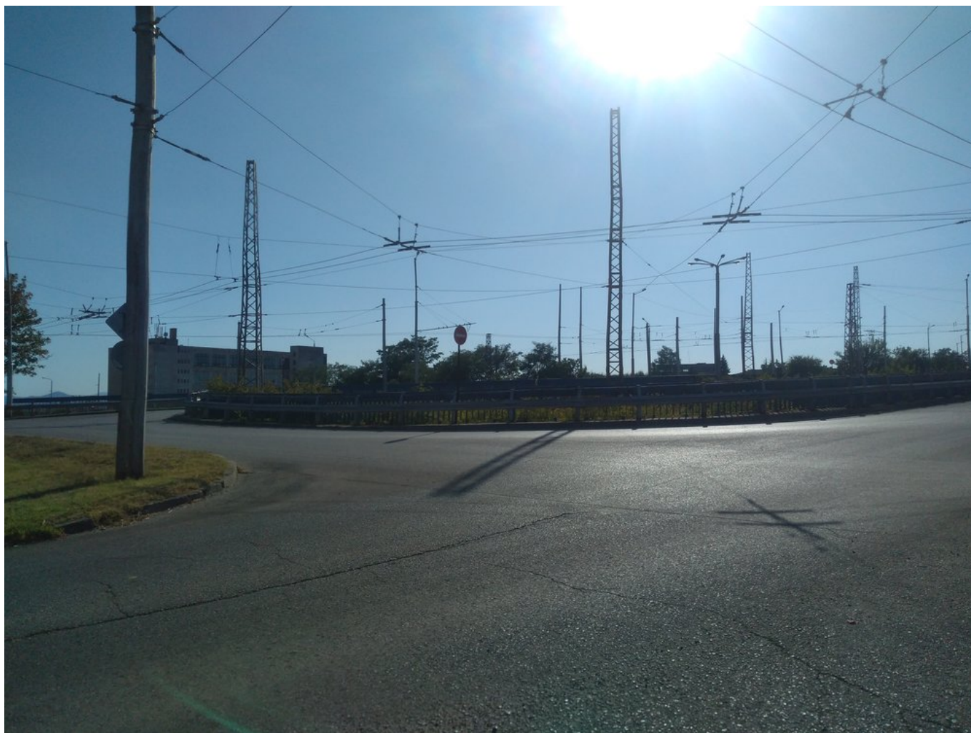
Nejsevernější bod sítě.