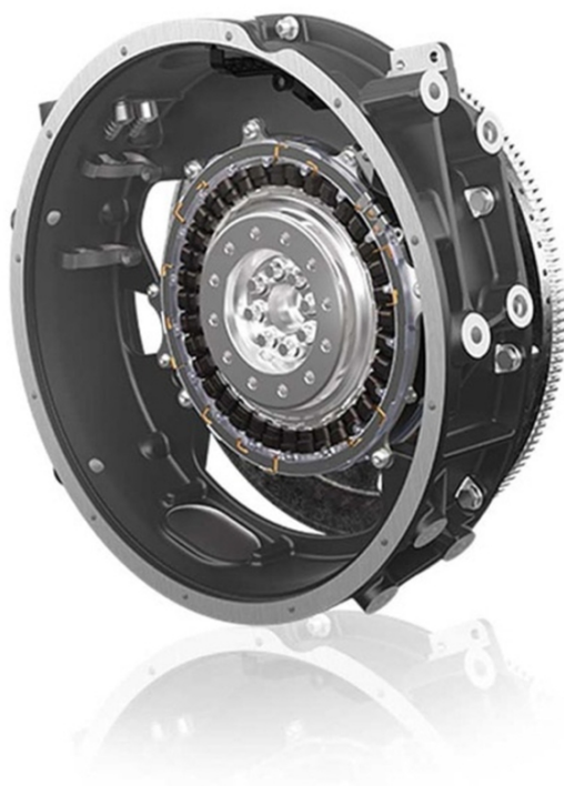
Nezvyklý diskovitý tvar elektromotoru o výkonu 14 kW.