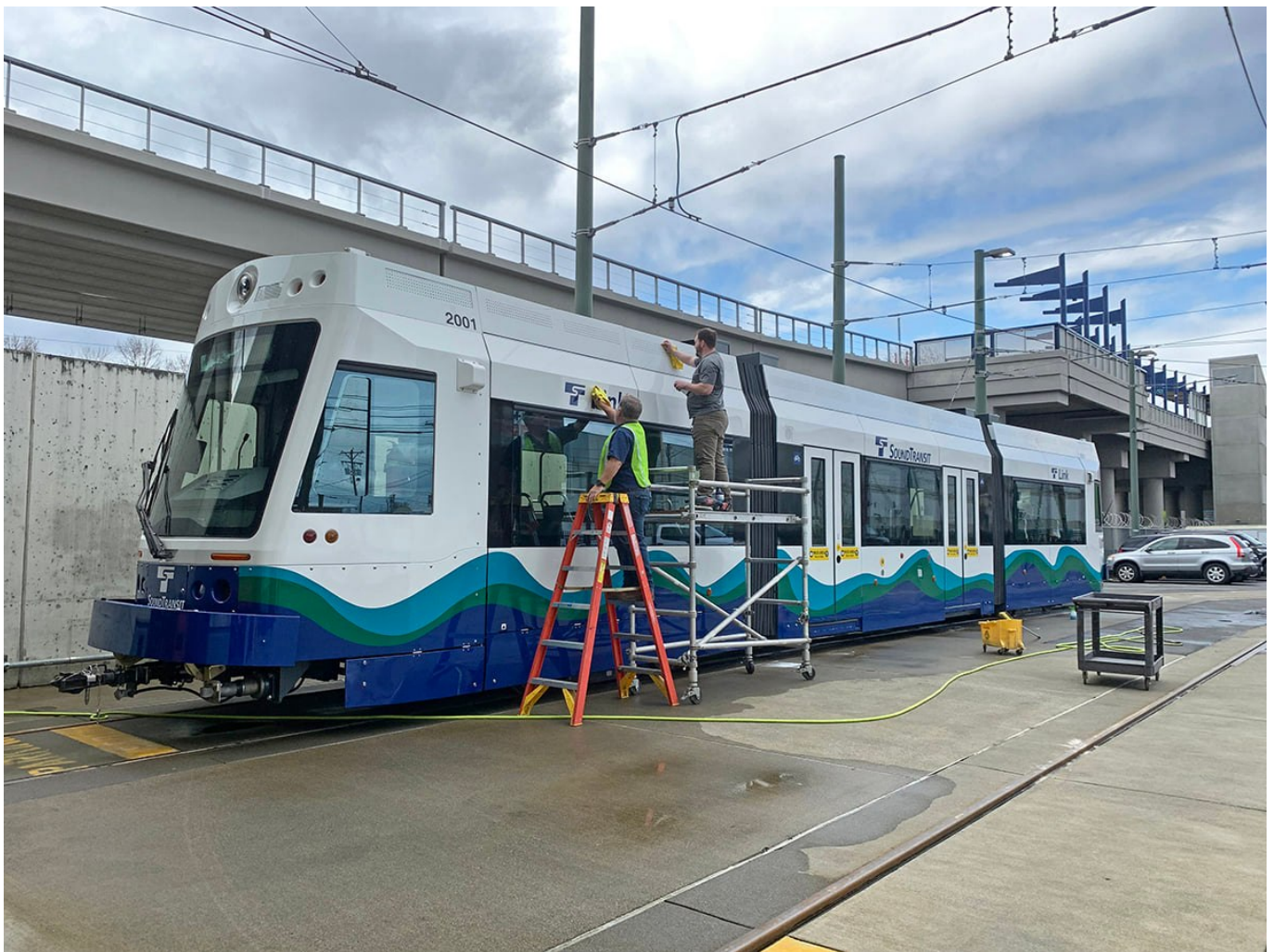
Tramvaj Liberty NXT na nádvoří (vozovny v Tacomě.)

Prodloužení tramvajové trati by mělo být do provozu uvedeno po dalším odkladu až počátkem roku 2023. Projekt se tak mezitím výrazně prodražuje. Ještě v roce 2021 vycházel na 217 mil. $, avšak do konce téhož roku poskočil na 252 mil. $. Letos v únoru bylo oznámeno, že bude nutné přisypat dalších 30 mil $, takže celková suma by se měla zastavit na 282 mil. $ (zhruba 6,5 mld. Kč). Po dokončení stavby se očekává zkrácení intervalu na 10 minut a zavedení jízdného.