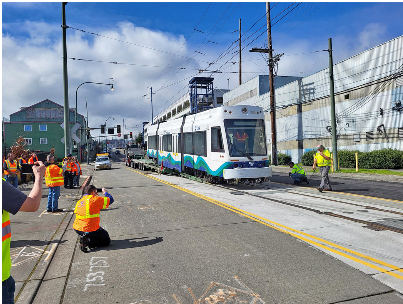
Vykládka prvního z pěti dodaných vozů Liberty NXT do Tacomy dne 23. 3. 2022.

Již v roce 2008 bylo voliči ve městě schváleno, že tramvajová trať se dočká prodloužení o 3,9 km do čtvrti Hilltop. Na trati bylo naplánováno 6 nových zastávek. Samotná stavba ale začala až v roce 2018, přičemž první koleje se na budoucí trati objevily v červnu roku následujícího. Předpokládalo se, že stavba bude ukončena v roce 2021, v březnu loňského roku však byla dokončena jen ze 75 % a nyní - o rok později - jde jen o 90 %. Na vině mají být především problémy v dodavatelských řetězcích v důsledku koronaviru. Ten měl nepříznivě dopadnout i na výrobce nových tramvají, které byly pro projekt prodloužení objednány.