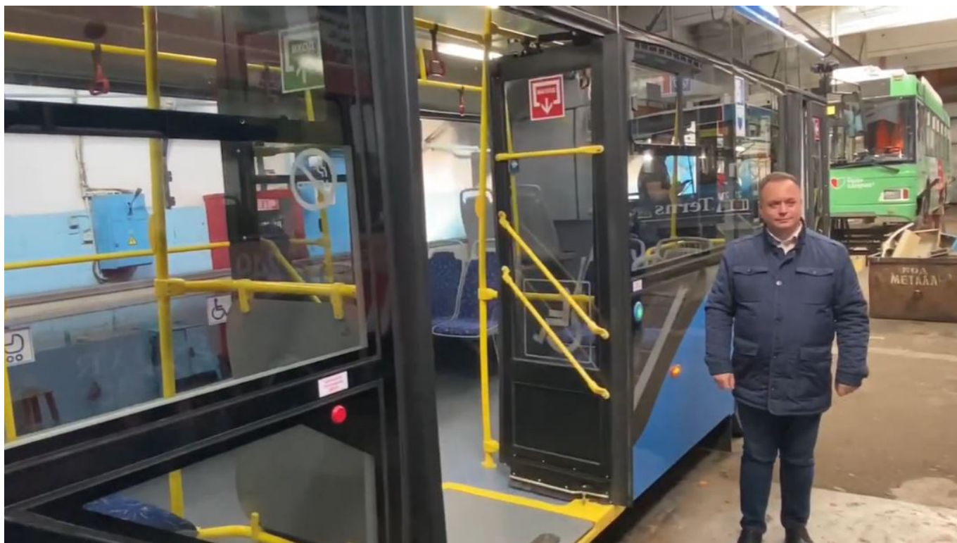
Z představení médiím dne 5. 10. 2021.

Přístup Čity k trolejbusové dopravě je naprosto opačný, než jaký razí dvě jiná města mající v Dálněvýchodním federálním okruhu trolejbusové provozy: Vladivostok a Chabarovsk. Tato dvě města totiž nechala své trolejbusové sítě v tomto století postupně zchátrat a pokrátit na minimum, přičemž se stále čeká, zda je jednou v dohledné době nezavřou. Čita naopak svou MHD staví téměř výhradně na trolejbusech a chce pro ně do dvou let vybudovat další dvě tratě.