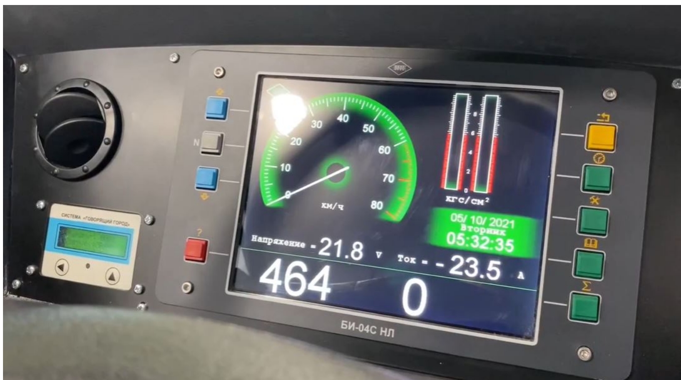
I kabina Avangardů se v posledních letech technologicky vylepšila.

Přístup Čity k trolejbusové dopravě je naprosto opačný, než jaký razí dvě jiná města mající v Dálněvýchodním federálním okruhu trolejbusové provozy: Vladivostok a Chabarovsk. Tato dvě města totiž nechala své trolejbusové sítě v tomto století postupně zchátrat a pokrátit na minimum, přičemž se stále čeká, zda je jednou v dohledné době nezavřou. Čita naopak svou MHD staví téměř výhradně na trolejbusech a chce pro ně do dvou let vybudovat další dvě tratě.