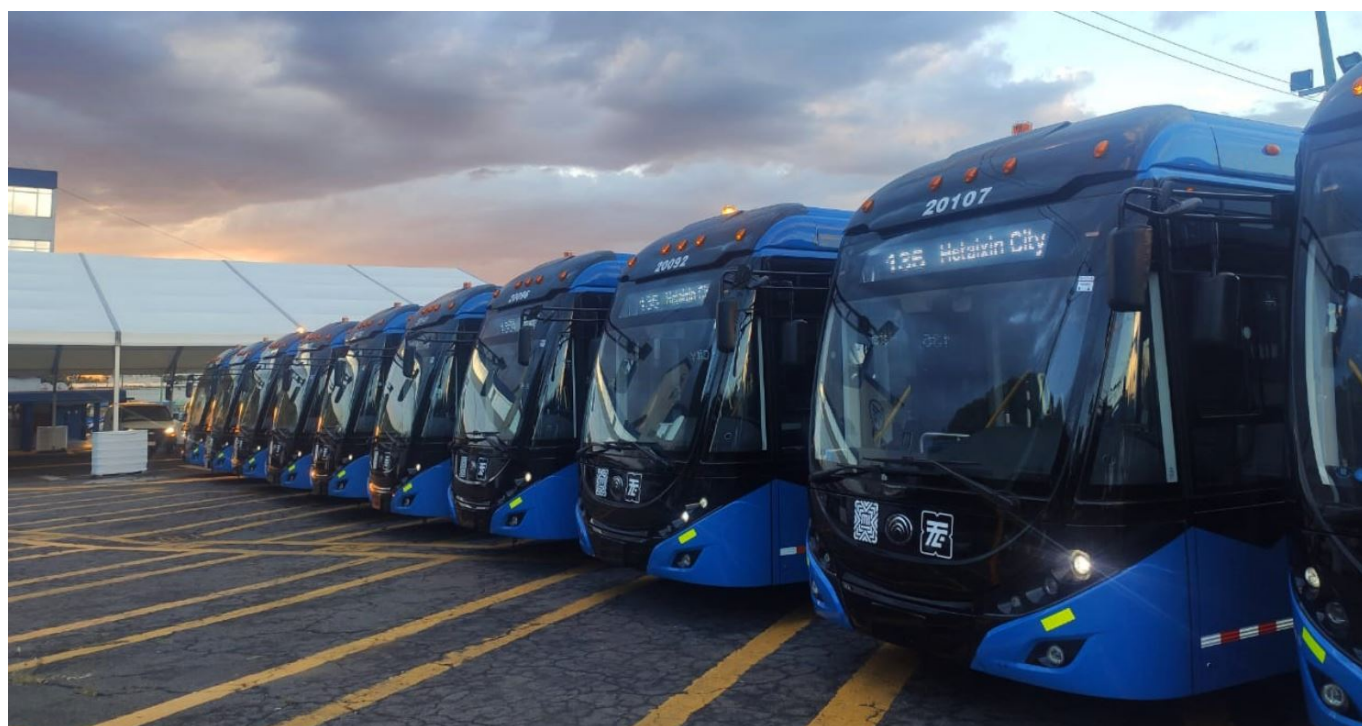
Nové trolejbusy.

Pokud jde o další nasazení sólo trolejbusů, ty půjdou opět na páteřní koridor „Corredor Eje Central“ a také na linky 2 a 7. Jak jsme již uvedli, kloubové trolejbusy poputují primárně na nadzemní trolejbusový BRT koridor.