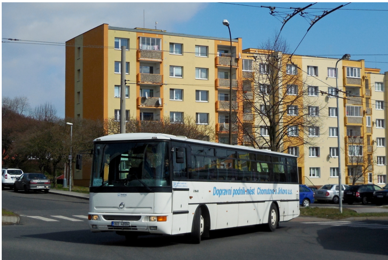
Dotčená Karosa C 954E.1360 zachycená 24. 3. 2016 v Jirkově ještě v plné síle.

Url: Co nabídne sobotní Autobusový den PID 2024?