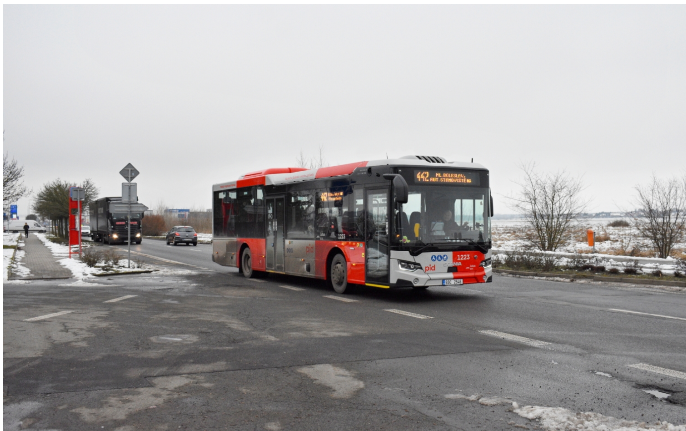
Scania Citywide LE ev. č. 1223 patřící společnosti Lutan vjíždí do Mladé Boleslavi.