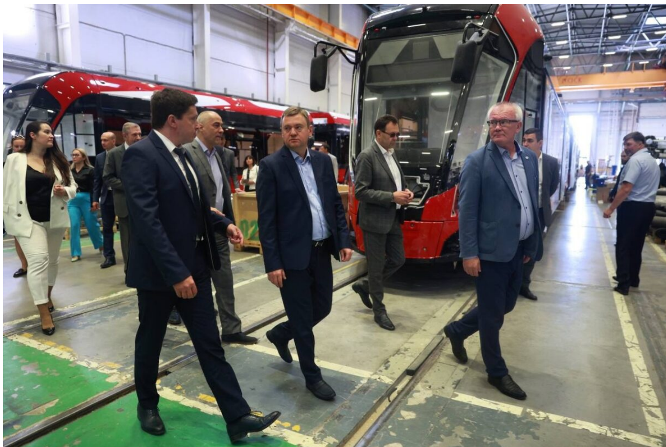
Výroba tramvají Něvskij na snímku z počátku července 2023.

Z celkem 116 tramvají jich bude 37 tříčlánkových (z toho jedna obousměrná), 62 dvoučlánkových a 17 jednočlánkových. Dodávky nových vozů budou rozloženy následovně: letos přijde 28 tramvají (8 tříčlánkových jednosměrných typu 71-931M „Vitjaz'-M“, jedna tříčlánková obousměrná typu 71-932 „Něvskij“, 19 typu 91-923M „Bogatyr'-M“), v roce 2024 dojde 49 tramvají, v roce 2025 34 tramvají a v roce 2026 posledních 5 kusů. Všechny tramvaje budou vybaveny bateriemi pro nouzový dojezd na vzdálenost 1,5 až 3 km. Celková hodnota zakázky činí zhruba 16,55 mld. RUB (nyní asi 3,86 mld. Kč), a tato částka odpovídá na kopějku přesně částce, která byla zadavatelem soutěže očekávána.