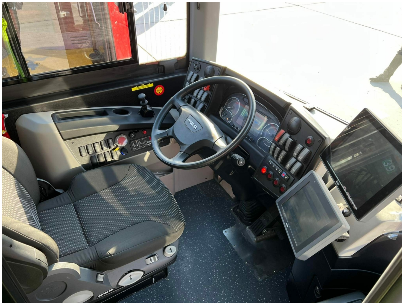
Stanoviště řidiče kloubového Kentu C pro Bratislavu.

První dodávka, který byla dne 17. 12. 2021 slavnostně představena, zahrnuje 8 autobusů, které by měly být po dořešení administrativních náležitostí postupně nasazeny do provozu. Technici bratislavského DP byli přímo přítomni během výroby těchto vozů a dohlíželi na její kvalitu. Zařazení nových autobusů znamená definitivní konec provozu autobusů Karosa B 741 v Bratislavě, a tím i v celém Československu. Jejich posledním provozním dnem byl 26. listopad 2021. Následně byly v souvislosti s vyhlášením nouzového stavu na Slovensku uzavřeny školy a snížena vypravenost, takže „sedmistovky“ už nebyly zapotřebí (v posledním období jezdily denně tři vozy na vybraných kurzech linek 31 a 75; celkově držel jako provozní rezervu DPB osm vozů B 741 CNG). Jejich další případné nasazení zůstávalo jen v teoretické rovině (pro případ zkrácení nouzového stavu, případně opoždění dodávek nových vozů), se zařazením nových autobusů z Turecka v kombinaci s prodlouženým nouzovým stavem ale tato varianta padá. Předpokládá se, že po zlepšení epidemiologické situace na Slovensku bude realizována s autobusy Karosa B 741 ještě finální rozlučka.