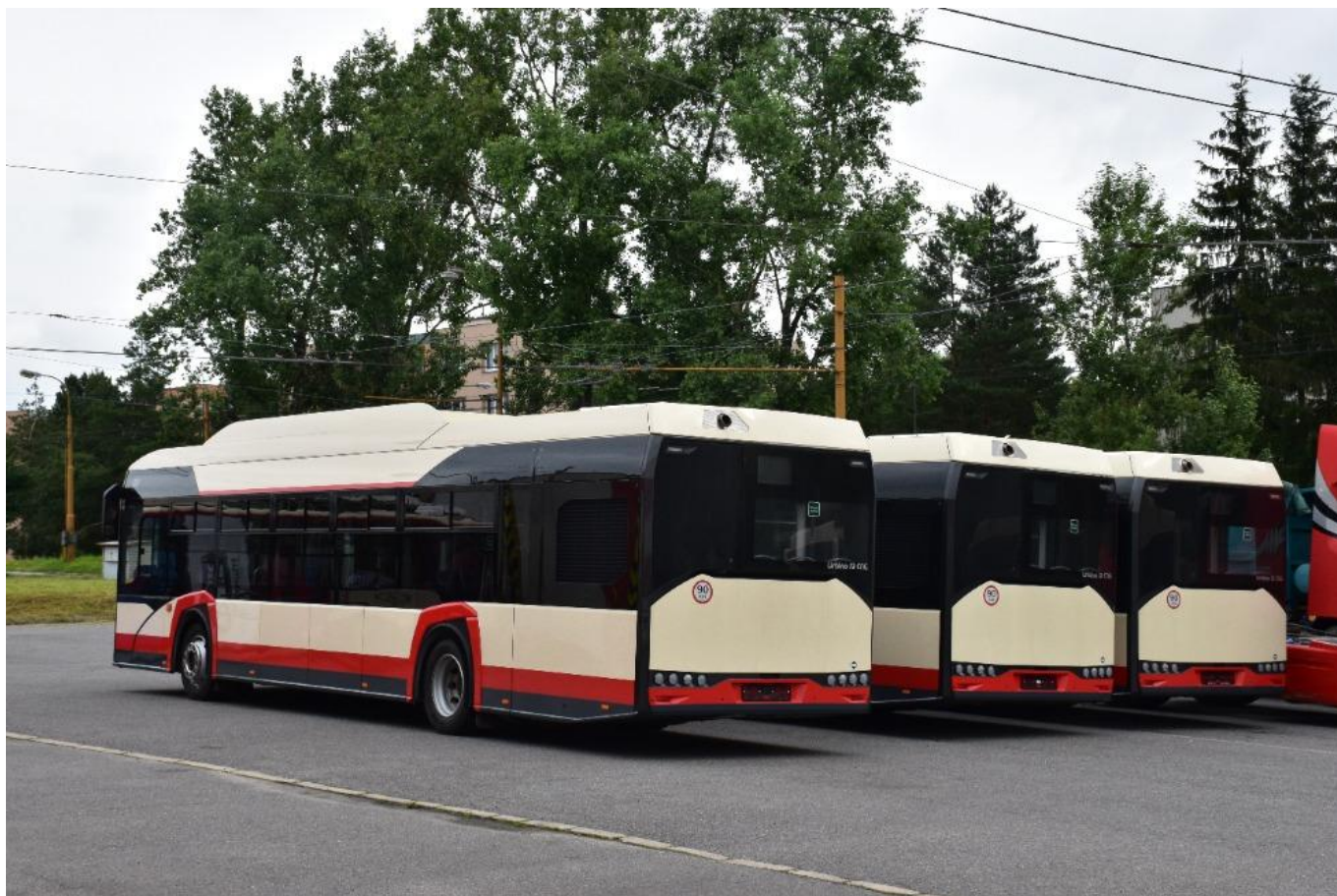
Ještě zadní pohled na část flotily nových vozů Urbino 12 CNG pro Jihlavu.

Nová Urbina obdrží ev. č. 235–239. Vyhotovery jsou v barevném provedení DPMJ, v interiéru jsou sedadla s čalouněním a textilním povrchem, doplňkem jsou USB nabíječky pro cestující, na druhé straně bychom však ještě marně hledali klimatizaci salónu. Ačkoli vozidla od Solarisu nejsou pro Jihlavu úplně neznámá, neboť v letech 2009 až 2011 bylo pořízeno celkem 23 trolejbusů (u nichž však jako finální dodavatel figurovala Škoda Electric), v případě autobusů jde pro výrobce ze skupiny CAF o první zářez ve městě s ježkem ve znaku.