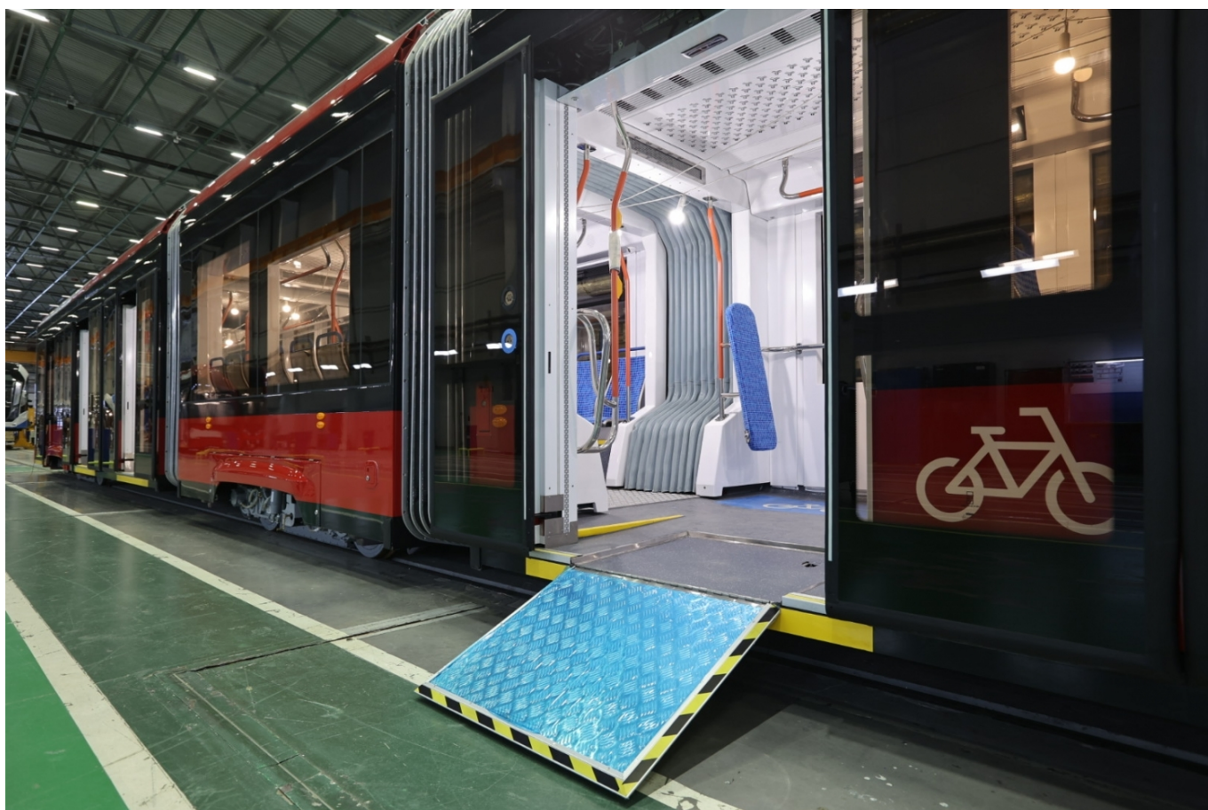
Nová tramvaj s výklopnou plošinou. (foto: 3x PK TS)