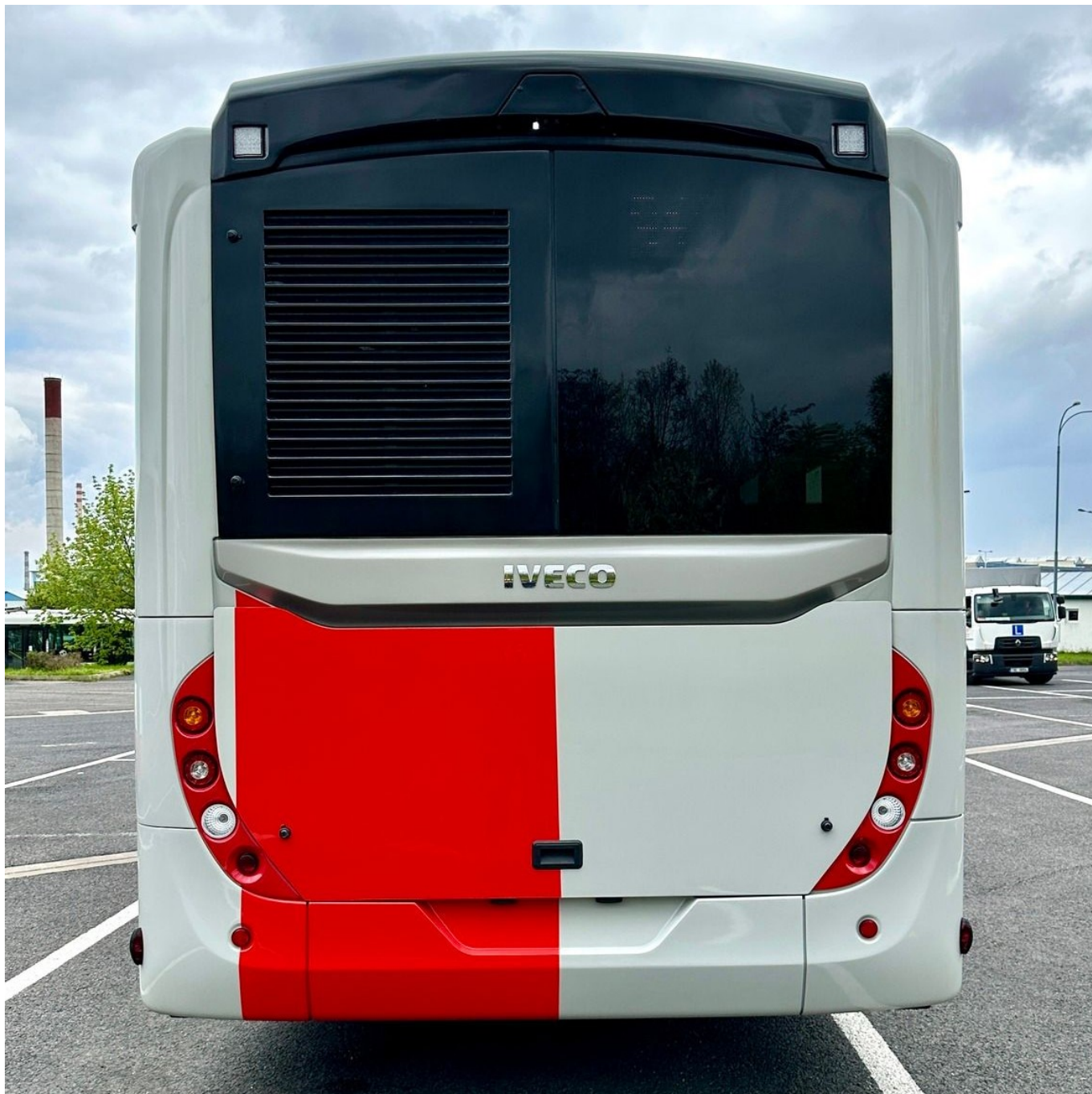
Pohled na zadní čelo autobusu Streetway.

Dne 26. 4. 2023 do areálu garáží Hostivař první přepravený autobus musí ještě projít tzv. akceptační procedurou, takže k samotnému předání do služeb DPP dojde až následně, přičemž v provozu s cestujícími by se měl Streetway objevit poprvé v průběhu května.