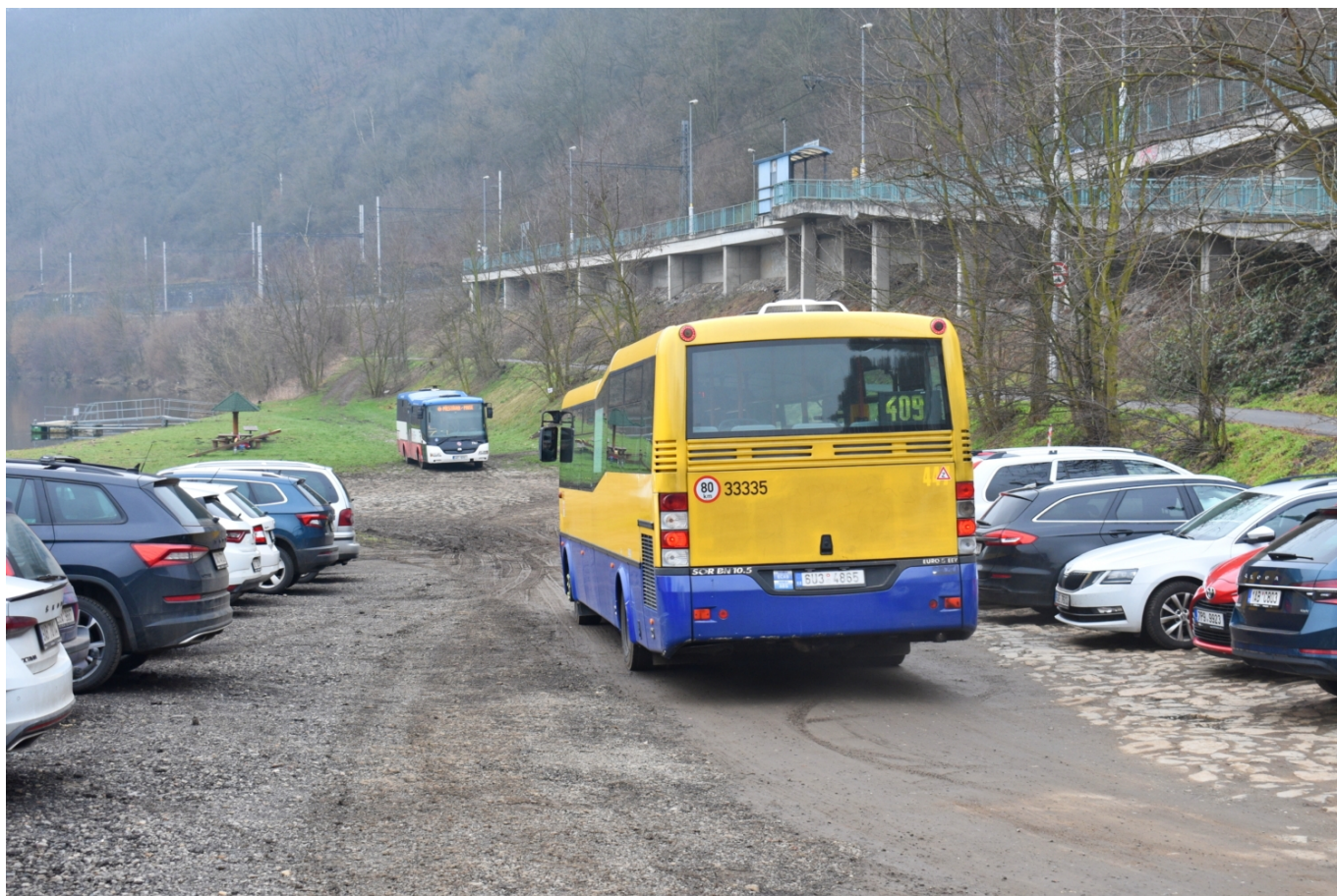
Setkání obou midibusů z linky 409 v obratišti Úholičky, železniční zastávka.

Celkem osm vozů SOR BN 10,5 zakoupila na leasing tehdejší společnost Veolia Transport Teplice na konci roku 2010. Autobusy obdržely ev. č. 443–450 a umožnily do hlavního města předat třeba ex-švédské vozy Scania OmniLink nebo některé autobusy značky Karosa. První čtyři stroje do podkrušnohorského lázeňského města dorazily v červeno-šedém laku Veolie Transport, zbytek výrobce dodal v bílé barvě, která sloužila jako podklad pro v Teplicích rozšířené reklamní polepy. V letech 2021 a 2022 se postupně všechny autobusy BN 10,5 s výjimkou reklamního vozu ev. č. 448 převlékly do teplického žluto-modrého schématu (ve formě polepu), který v jeho moderní podobě bez bílé barvy do té doby existoval pouze na trolejbusích.