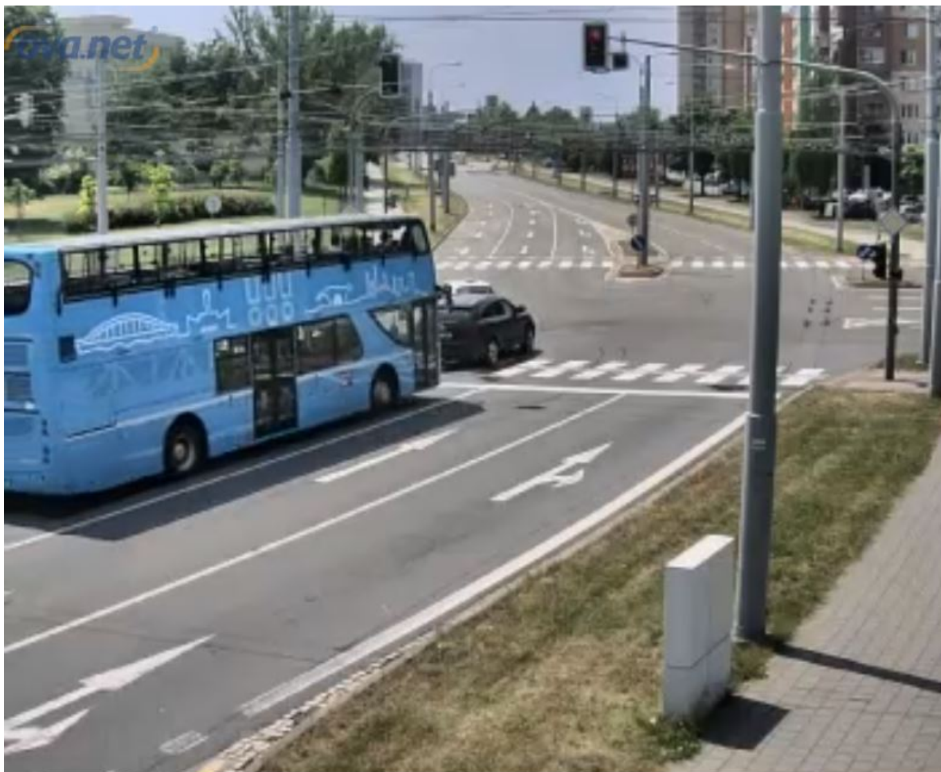
Dne 20. 6. 2021 krátce po 13:00 spoj do DOV u křižovatek Českobratrská/Hornopolní. Horní patro téměř prázdné.