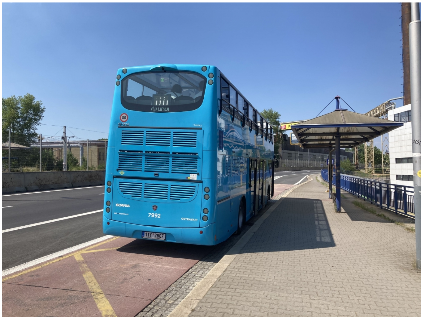
Doubledecker výjimečně na zastávce Dolní Vítkovice dne 19. 6. 2021 ve 14:48. V autobuse navzdory konání závodů v běhu v areálu DOV čekalo na svezení jen okolo pěti cestujících.