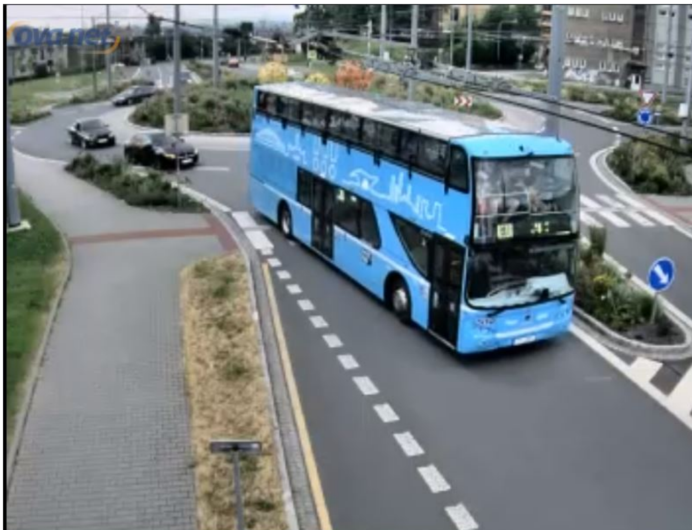
V sobotu 26. 6. 2021 spoj do DOV ve 13:00 od ZOO. Horní patro opět téměř prázdné.