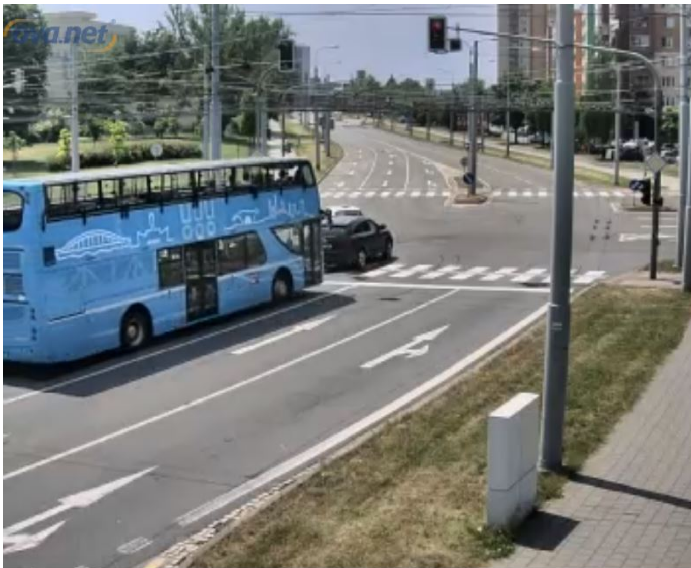
Dne 20. 6. 2021 krátce po 13:00 spoj do DOV u křižovatek Českobratrská/Hornopolní. Horní patro téměř prázdné.