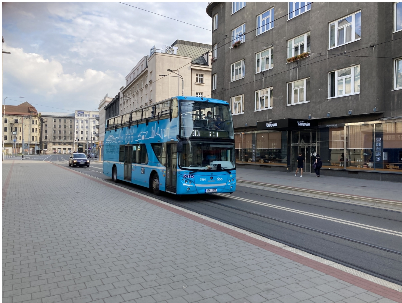
Následný spoj od DOVu dne 11. 7. v 17:22 projíždí kolem zastávky Elektra. Veze směrem k ZOO rovné dva cestující.