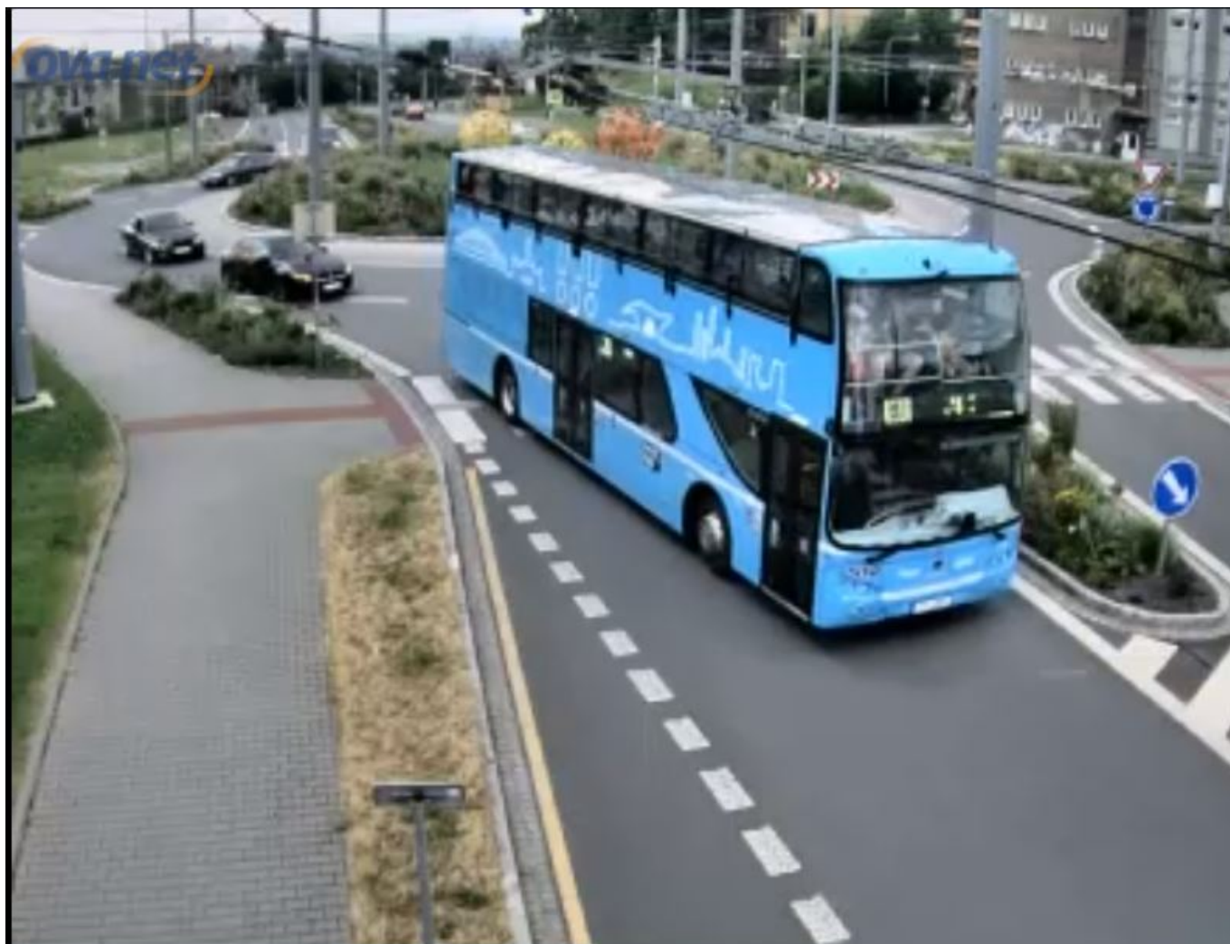
V sobotu 26. 6. 2021 spoj do DOV ve 13:00 od ZOO. Horní patro opět téměř prázdné.