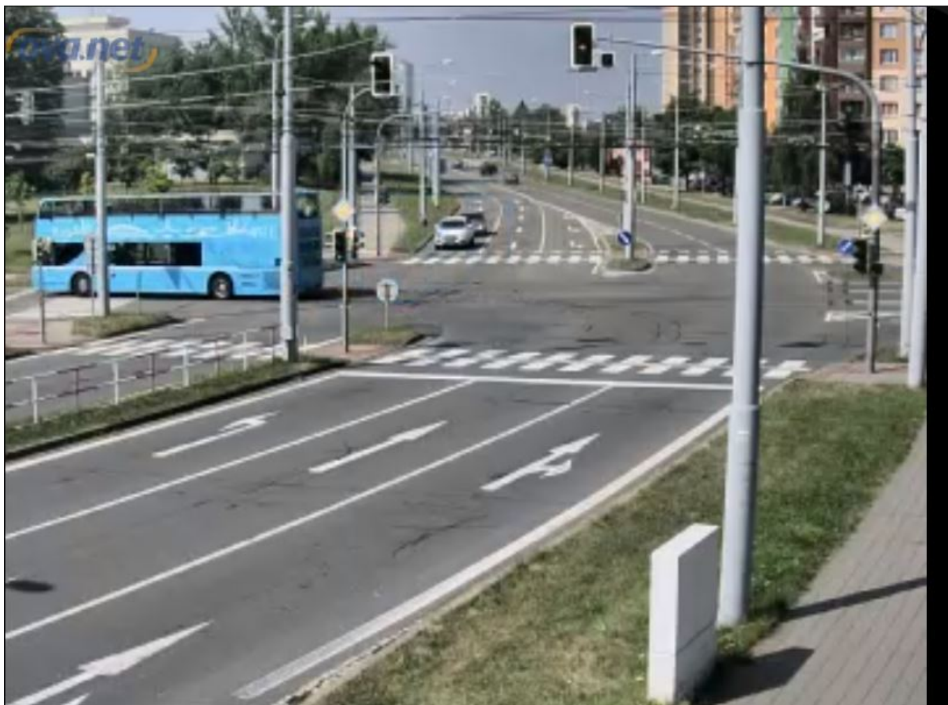
Tento spoj 11. 7. 2021 v 10:00 od ZOO jel od Konzervatoře prázdný.