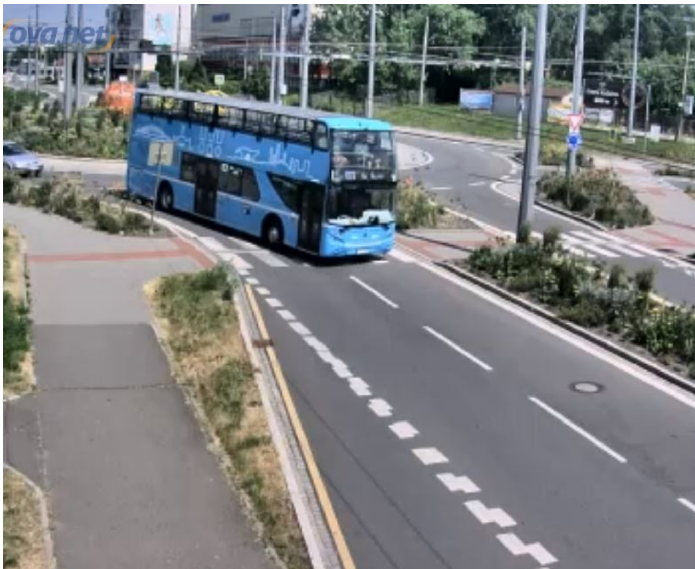
Dne 20. 6. 2021 „netáhl“ ani spoj ve 14:00 od ZOO.