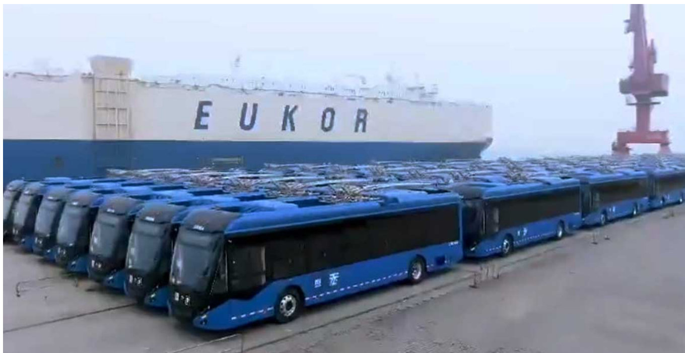
Trolejbusy v čínském přístavu.