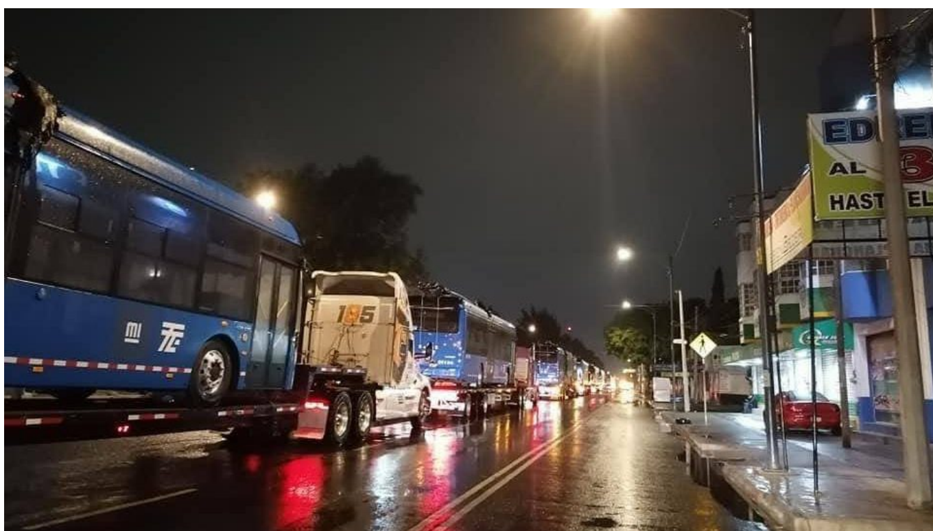
Záběr z příchodu nových trolejbusů do Mexika.

Všechny zbývající vozy dorazí do města nejpozději do konce tohoto roku.