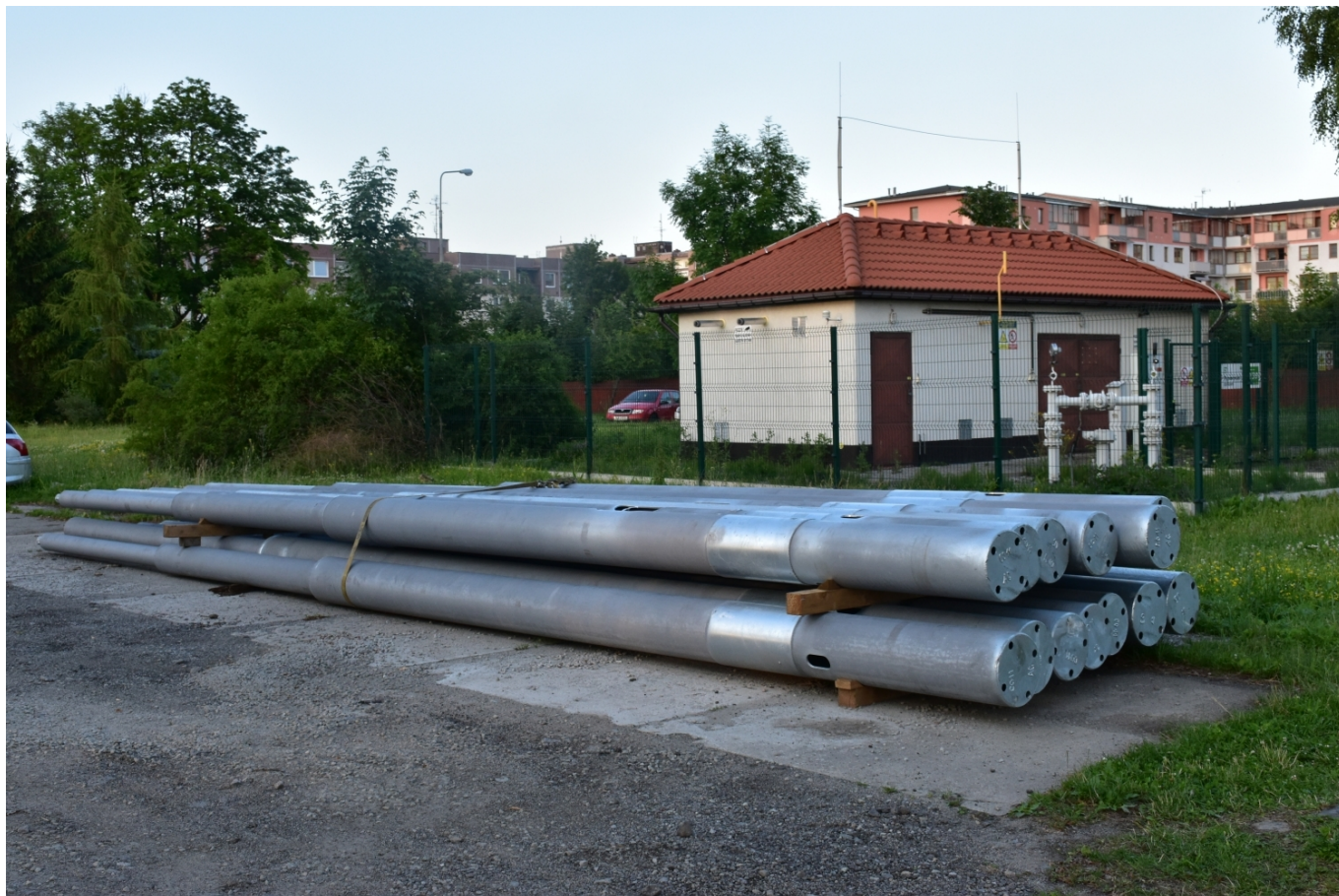
Sloupy na Rantířovské ulici v červenci 2021.

K tomu ještě dodejme i to, že Jihlava provádí průběžnou obnovu své trolejbusové infrastruktury, když postupně mění trakční vedení včetně nosné sítě. Nyní se také pustila do projekční přípravy rekonstrukcí nejstarších úseků (ul. Havlíčkova a ul. Brtnická), kde budou po více než 70 letech nahrazeny původní trakční stožáry, které pamatují počátky trolejbusového provozu a dokazují tak, že živostnost těchto základních trakčních zařízení je velmi dlouhá.