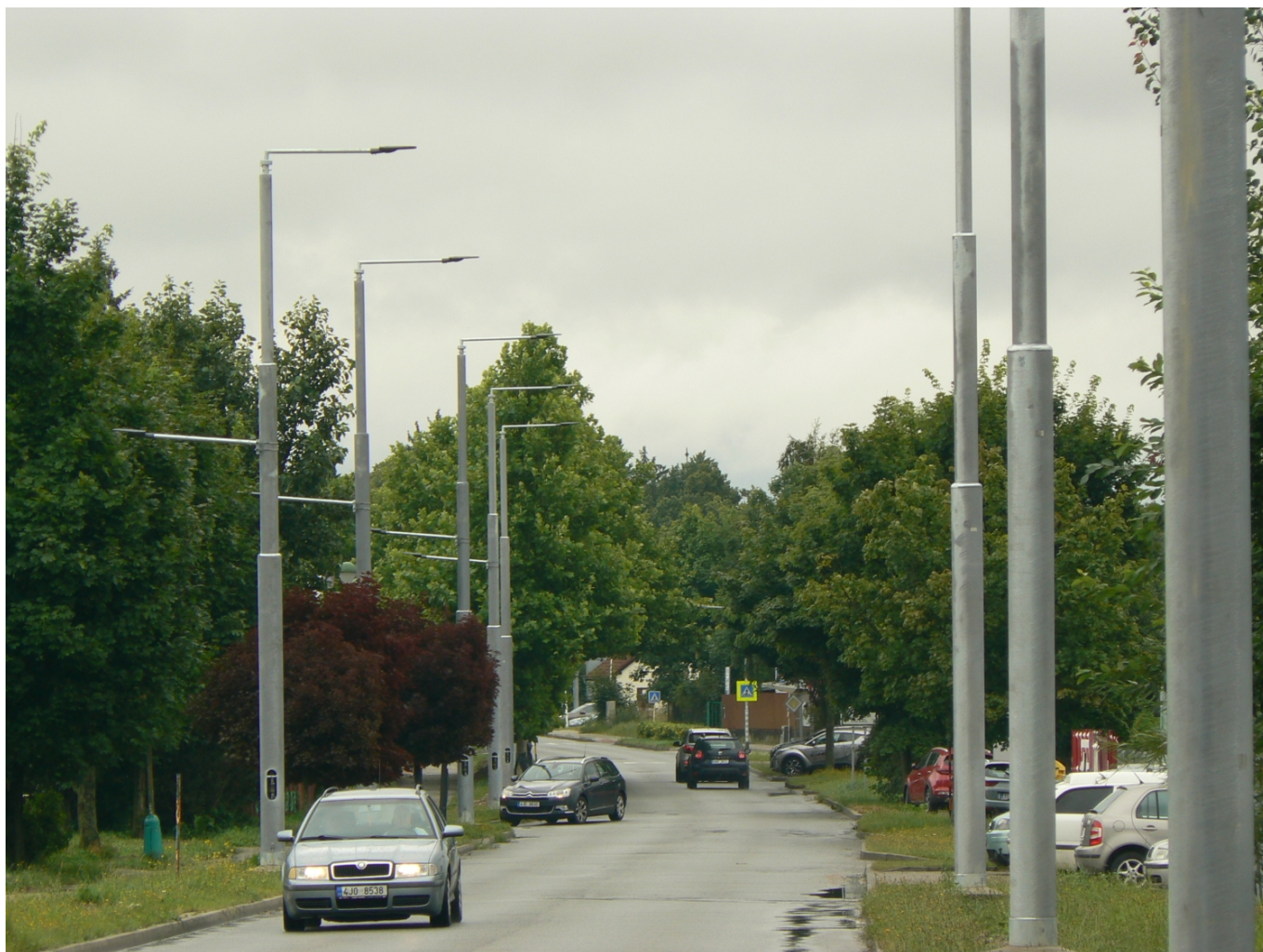
Sloupy na téže ulici v září 2021.

Jihlava počítá i s modernizací zázemí trolejbusové vozovny, kde se připravuje stavba nové měnirny a postupná obnova trolejového vedení. V rámci právě popsané masivní obnovy jihlavské trolejbusové sítě mj. postupně mizí, pro Jihlavu tolik typické, žlutohnědé zbarvení trakčních stožárů, které jsou nově přetírány šedou barvou.