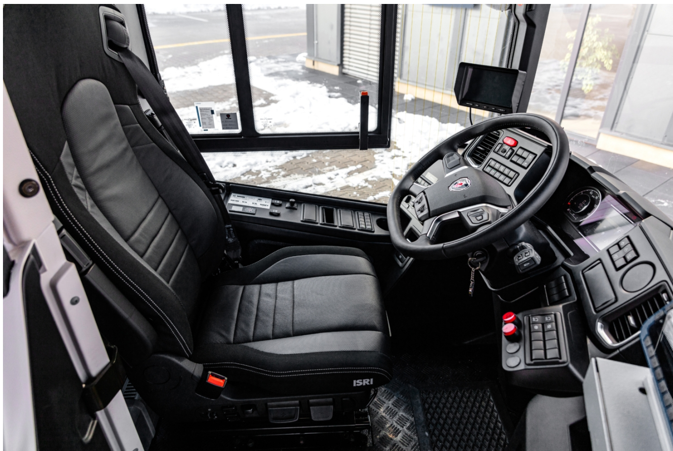
Pohled na kvalitně vybavené pracoviště řidiče.

Řidič má k dispozici odvětrávanou sedačku od ISRI nebo vlastní klimatizační jednotku. Autobus je zároveň vybaven celou řadou bezpečnostních prvků známých především z osobních automobilů, a to včetně sledování mrtvého úhlu nebo varování před kolizí se zranitelnými účastníky provozu (tj. s chodci a cyklisty). Nechybí ani zadní couvací kamera nebo Bi-LED světlomety.