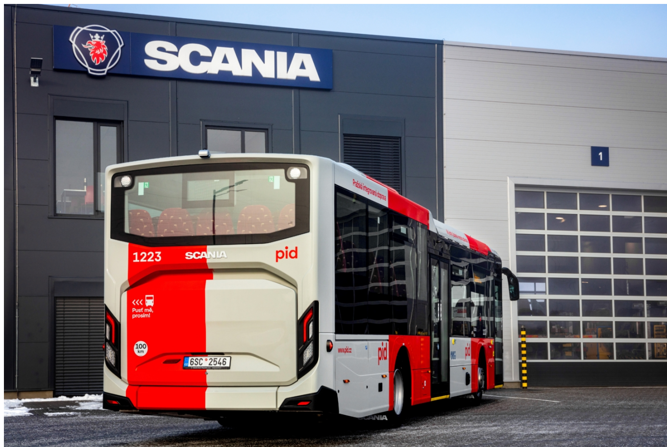
Záběr na ostře řezané zadní partie vozu.

Společnost Lutan si nový Citywide pořídila v příměstské, částečně nízkopodlažní variantě a samozřejmě také v laku vycházejícím z nového vizuálu Pražské integrované dopravy. Přední dveře jsou jednokřídlé a společně s dveřmi druhými řešené jako předsvuné, což je na tuzemské poměry věc spíše ojedinělá. Vozidlo je dlouhé 12 095 mm, šířka činí standardních 2 550 mm a výška poté 3 303 mm. Pohonné ústrojí je poté založeno na motoru DC09 140 vlastní provenience o výkonu 235 kW, jenž plní emisní normu EURO VI-E a je spřažen s automatizovanou 12stupňovou převodovkou GRS895R pocházející rovněž z dílny Scanie.