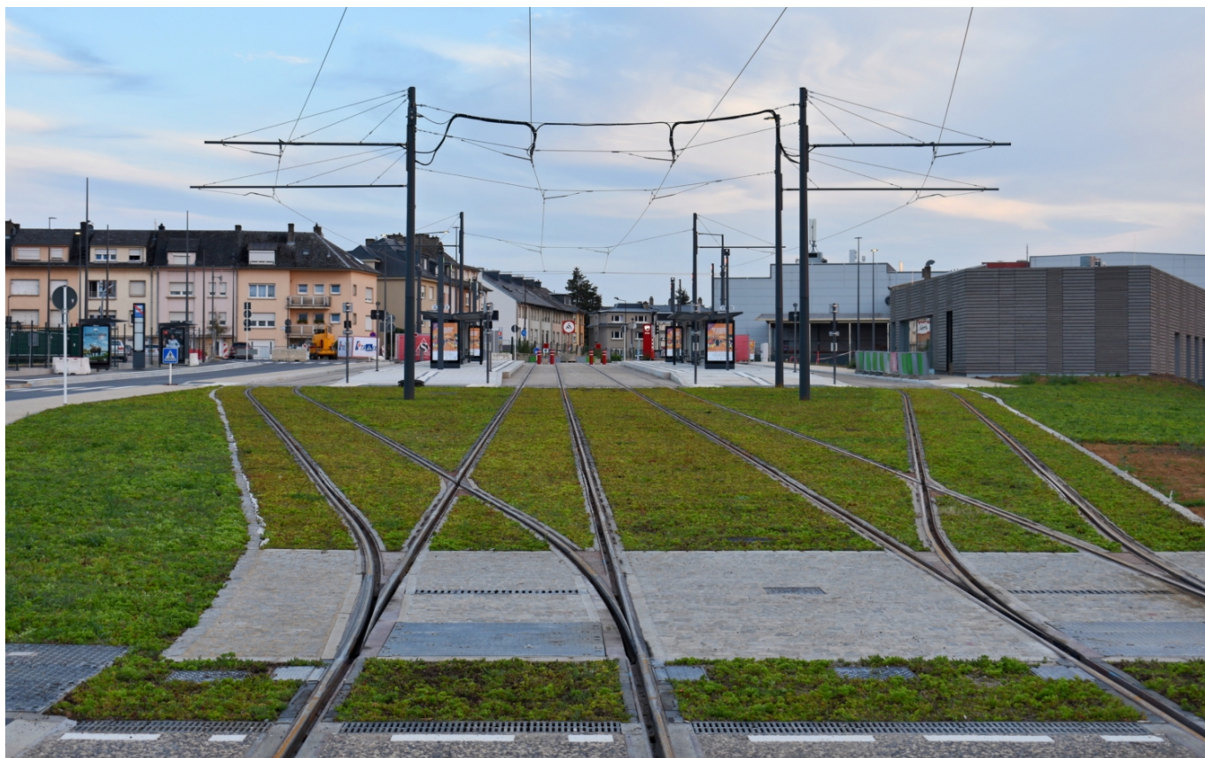
Příjezd do zastávky Lycée Bouneweg.

Na konci nového úseku je situováno malé tramvajové „nádraží“ o čtyřech kolejích, z nichž obě krajní jsou kusé a zbylé budou výhledově pokračovat do Howaldu a Cloche d’Or. Součástí je i přestupní terminál na autobusové linky - šestý z plánované desítky na základní trati o délce 16 km. Popisovaná koncová zastávka dostala podle nedalekého technického lycea název Lycée Bouneweg, mezilehlá stanice získala pojmenování Leschte Steiwer / Dernier Sol, jež odkazuje na 19. století a hostinec „Zum leschte Steiwer“ v ulici Dernier Sol, kde rolníci z Hesperange a Roeser utráceli své poslední mince na cestě z trhu v Lucemburku.