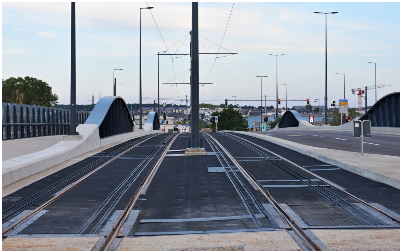
Rozšířený most Jeana-Pierra Buchlera situovaný nad jižním zhlavím stanice Luxembourg.

Výstavba zatím posledního prodloužení označovaného písmenem „C“ do čtvrti Bonnevoie byla zahájena v dubnu 2021, první koleje se budované trase objevily v létě stejného roku. Trať o délce 1,2 km spojí zastávku Gare Centrale před lucemburským hlavním nádražím se čtvrtí Bonnevoie, trasována je přitom podél jižního zhlaví stanice přes pro potřeby tramvaje rozšířený most Jeana-Pierra Buchlera na Route de Thionville, odkud pokračuje dále po novém městském bulváru N3 až po ulici Ranweg, kde je ukončena.