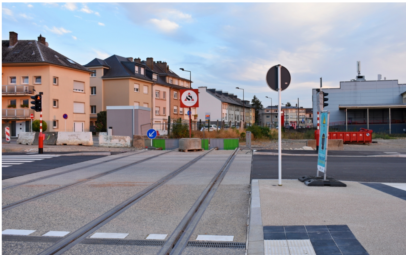
Příprava na prodloužení linky T1 do Cloche d'Or.

Další rozvoj tramvajové sítě nejen po Lucemburku jako městu, ale i po Lucembursku jako takovém, objasňuje Plan national de mobilité à l'horizon 2035 (Národní plán mobility) představený 22. dubna 2022. Do inkriminovaného roku 2035 se mají v ulicích Lucemburku rozjet další 3 tramvajové linky – červená, modrá a žlutá. Zásadním bude vznik druhé tratě v centrální severojižní ose. Dnešní fialová linka poté výhledově zamíří až do druhého největšího města Lucemburska Esch, resp. jeho nové čtvrti Schifflange a obcí Belval a Belvaux. Rychlodrážní trať umožní rychlost až 100 km/h a nabídne obyvatelům alternativu k železničnímu spojení, jež vede nepřímo přes Bettembourg. Za čtvrtí Cloche d'Or je s ohledem na nalajnovaný rozvoj plánována výstavba druhé vozovny, celkem má na síti působit až 80 vozidel.