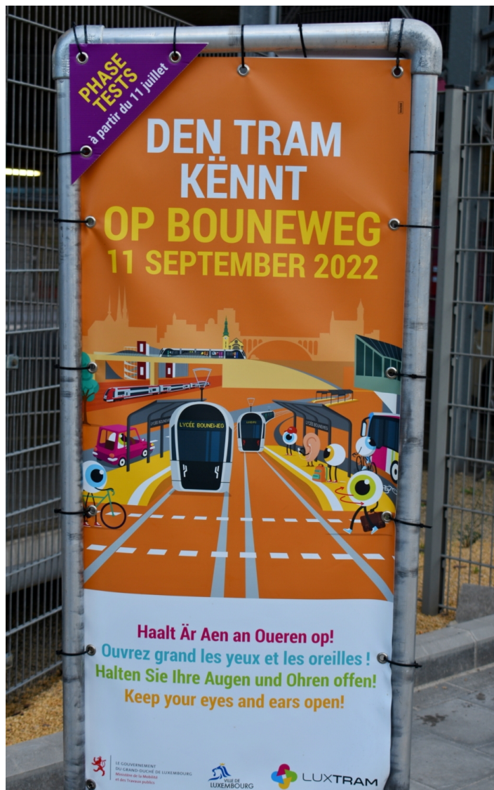
Tramvají k Lycée Bouneweg od 11. září.

Od úterý 2. 8. 2022 se následně testy a zkoušky překloupily do druhé části, a sice do provozu bez cestujících, ale za reálných podmínek. Tyto zkušební jízdy už probíhaly v pravidelných časech a intervalech. Pravidelný provoz na prodloužení „C“ bude zahájen těsně před příchodem nového školního roku v neděli 11. 9. 2022. Cesta z Gare Centrale na konečnou zastávku Lycée Bouneweg tramvajím zabere 3 minuty a 40 sekund. Provoz bude pokrytý již dříve zařazenými tramvajemi CAF Urbos 3, které v lucemburské metropoli jezdí v počtu 29 kusů z finálních 32.