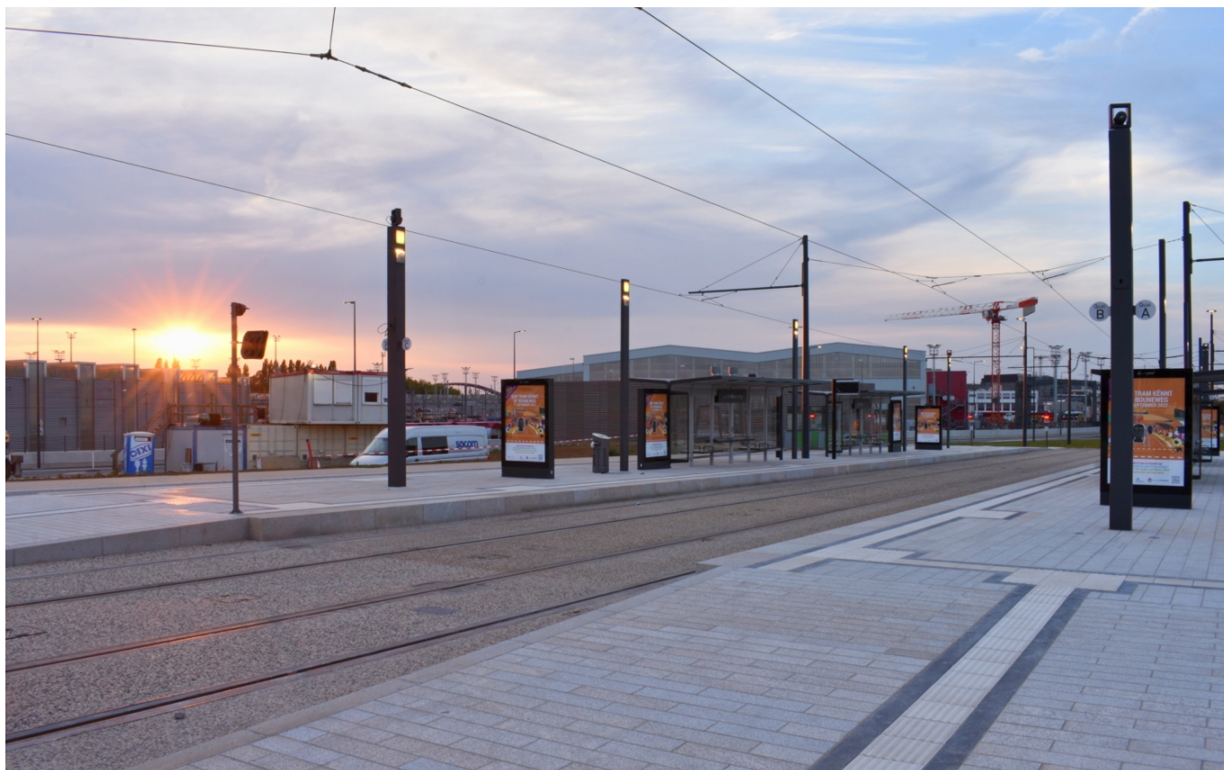
Tramvajové „nádraží“ v podobě zasávky Lycée Bouneweg.

Zkušební provoz na nově vybudovaném úseku tramvajové linky T1 byl zahájen 11. 7. 2022, už od 8. července je poté pod napětím trolejové vedení, jež v úseku na rozdíl od posledních dvou prodloužení tratě poježděných na superkondenzátory tentokrát nechybí. První zkušební jízda s vozem CAF Urbos 3 ev. č. 115 z roku 2019 se odehrála za rychlostí 3 až 5 km/h, aby se ověřilo, že v úseku nedochází ke kolizi tramvaje např. s nástupišti.