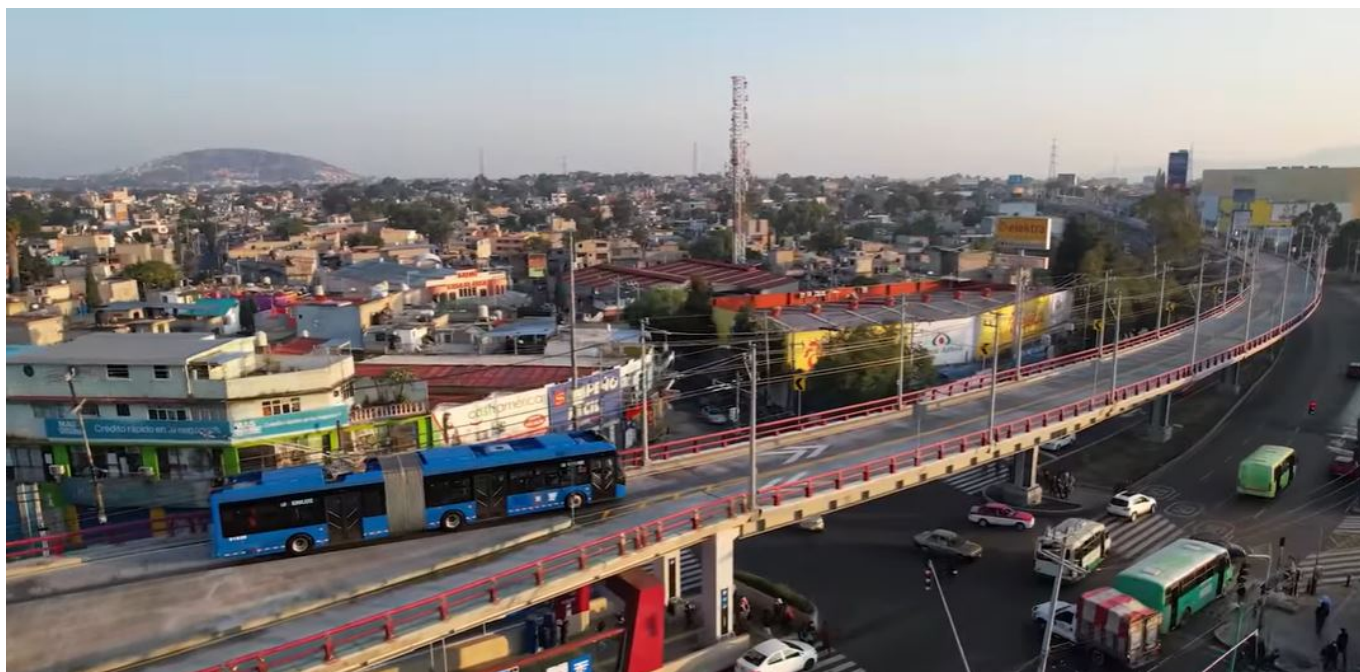
Trolejbus na koridoru.

Dodejme ještě, že pokračuje dodávka 100 nových sólo Yutongů. Před pár hodinami dorazily do vozovny v Ciudad de México další desítky vozidel. Dodávky by měly co nevidět skončit.