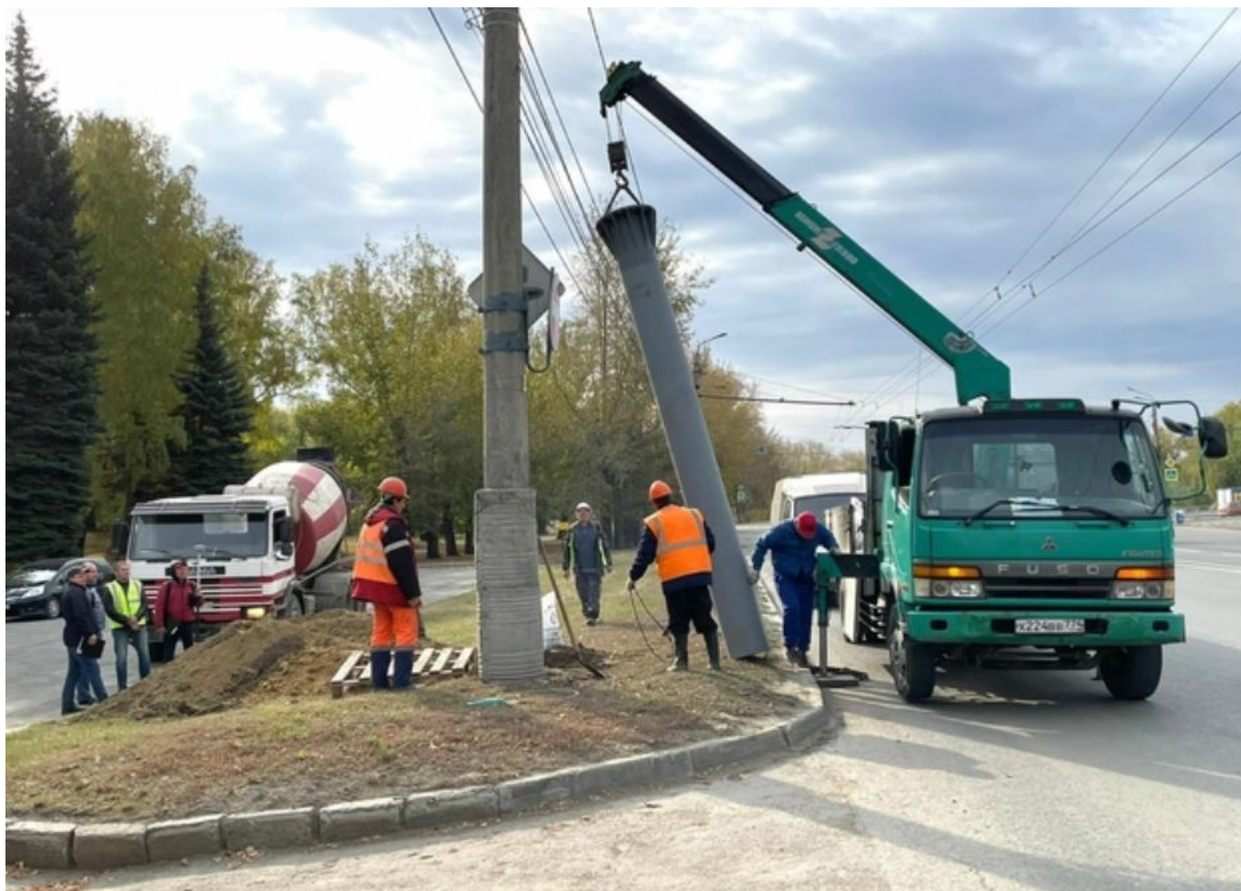
Výměna trakčních stožárů na snímku z podzimu 2022.