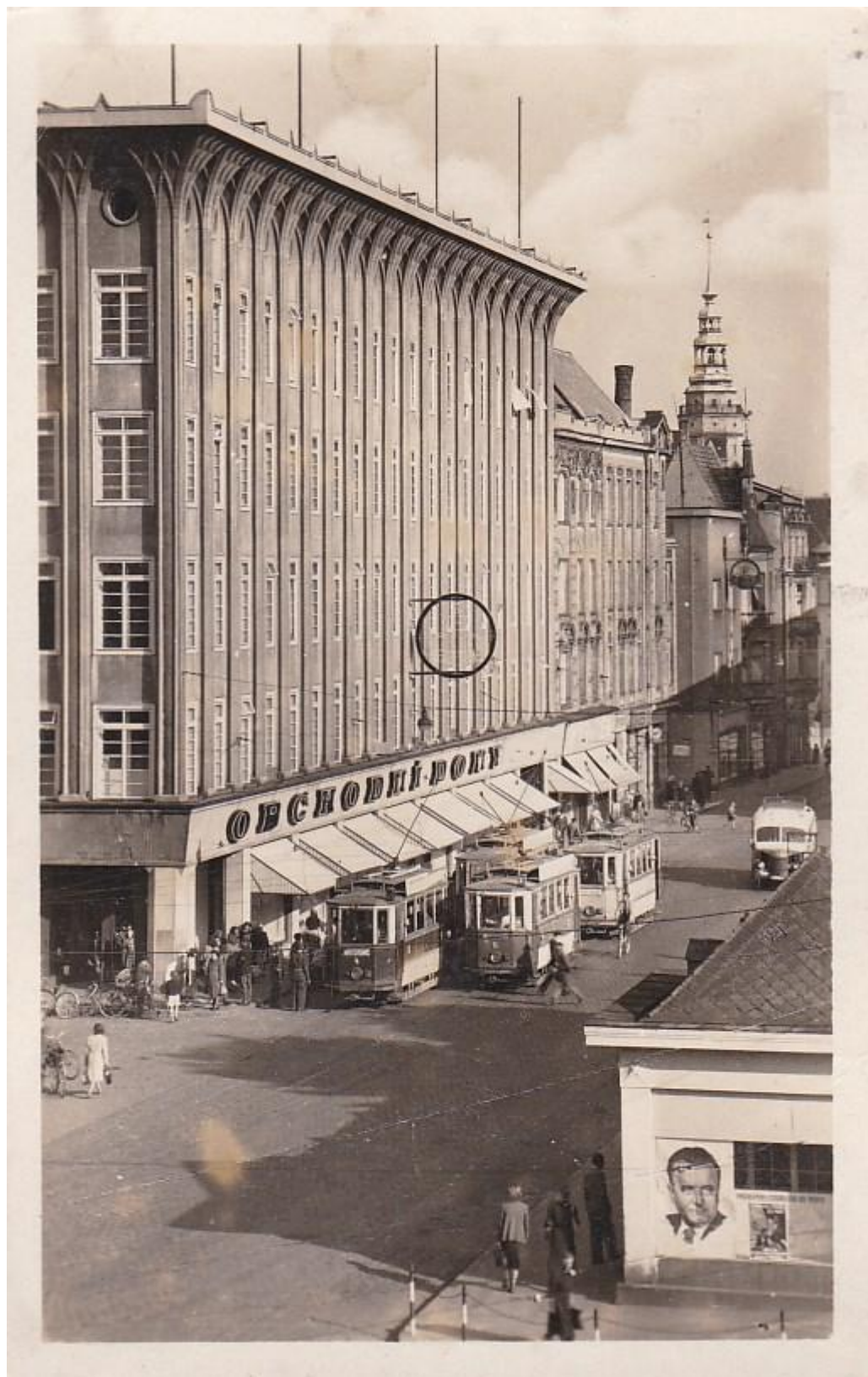
Poválečný snímek od obchodního domu Breda s opavskými tramvajemi.

V oblasti veřejné dopravy si za centrum své pozornosti zvolil opavskou pouliční dráhu (1905-1956), jejíž historii nesmírně precizně zpracoval. Díky osobnímu obcházení ještě žijících pamětníků nashromáždil obrovské množství dat, informací i fotografií, které byly následně použity v řadě dalších publikací o opavské MHD. Publikačně se tématu opavských tramvají věnoval naposledy v roce 2014 na stránkách tištěného vydání Československého Dopraváka, kdy společně s jedním