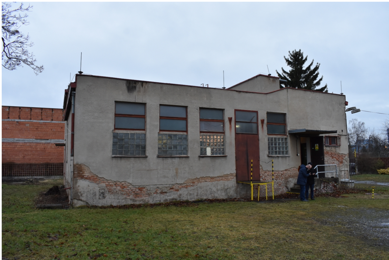
Původní trolejbusová měnírna v Letňanech se opět dočká využití pro potřeby trolejbusů.

Délka trolejového vedení má být celkově zhruba 15 km (obousměrně), samotná stavba zahrnuje trolejové vedení o délce 11,234 km, přičemž ve výsledku bude trolej pokrývat přibližně 50 % trasy současné autobusové linky 140, zbytek bude obsluhován v režimu na baterie. Po dokončení stavby a zprovoznění trolejbusů má dojít k přečíslování na trolejbusové číslo 58. To v sobě skrývá symboliku – stejným číslem byla označena linka, jež spojovala Libeň s Čakovicemi v letech 1952 až 1965. Trolejbusy nové linky sice budou mít podobné směrové vedení, s výjimkou už dnes existujícího úseku na Prosecké ulici a části od Palmovky kolem Libeňského zámku však budou vedeny po jiných silnicích a ulicích. Přesto dojde i využití jednoho původního objektu staré „osmapadesátky“. V Letňanech (na ulici Příborské) totiž dodnes existuje areál původní trolejbusové měnírny, kterou si dnes mohli novináři prohlédnout. Z ní sice bylo demontováno původní (již nepotřebné) technologické vybavení, avšak objekt zůstal nadále v majetku pražského DP, který jej využíval k nejrůznějším potřebám (k opravě a dobíjení palubních baterií, jako zámečnickou dílnu atp.). Kromě této měnírny bude vybudována pro napájení trolejbusové sítě ještě jedna nová, v Čakovicích vznikne nabíjecí stopa a dalších 18 nabíjecích stop bude zřízeno v areálu garáží Klíčov.