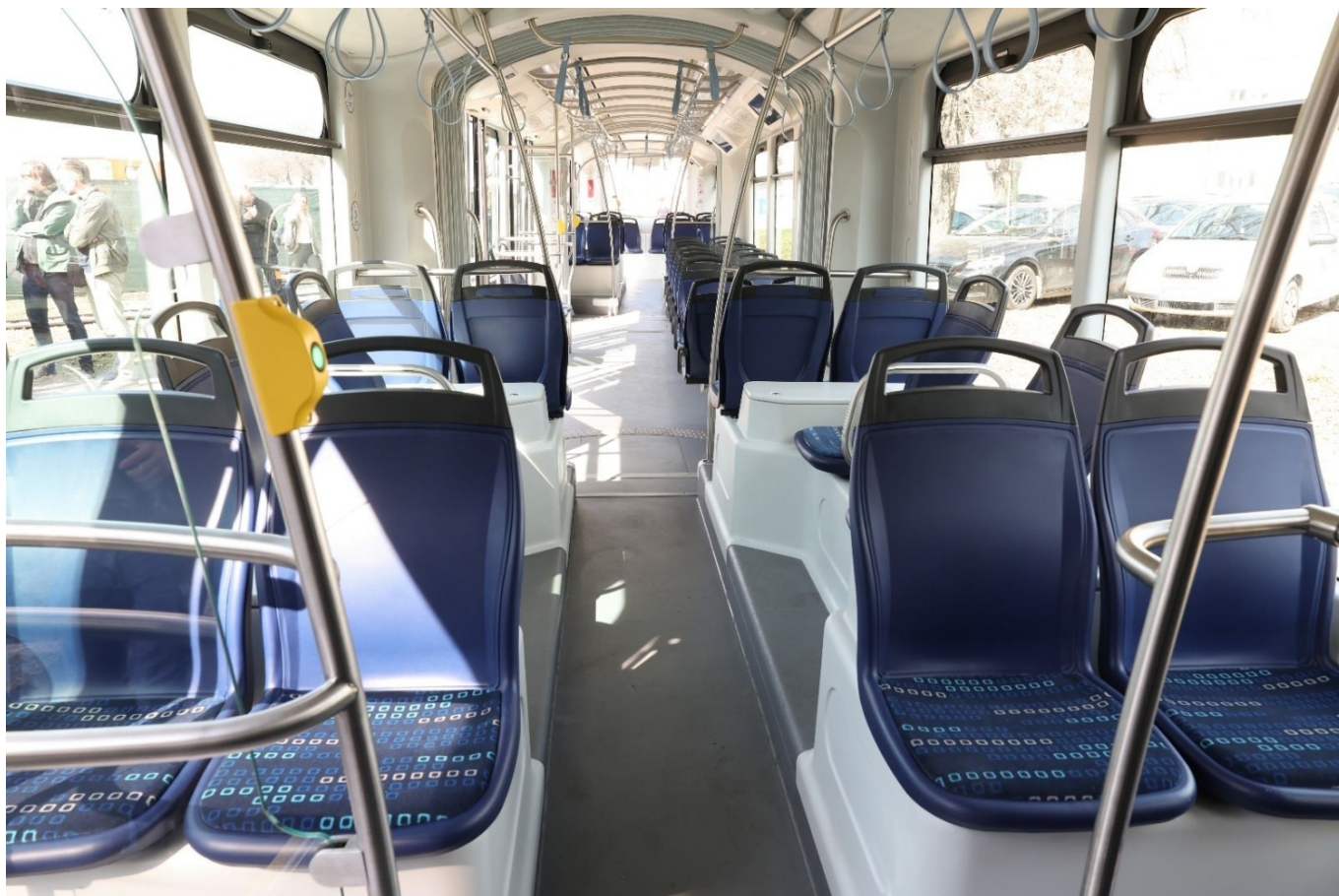
Interiér vozu Končar TMK 2500 pro Osijek

Samostatně se podařilo zajistit financování nových tramvají. Na základě uzavřené smlouvy jich může Osijek objednat až 30, první objednávka ale zahrnuje jen 10 vozů. Média uvádějí, že cena jednoho vozidla činí 2,3 mil. €, jde ovšem o částku s DPH. Bez DPH jde o sumu 1,845 mil. €, tj. přibližně 48,18 mil. Kč za vůz, což je jen nepatrně více, než za kolik dodává Končar takřka identické tramvaje (ty pro Osijek jsou ovšem širší) do Záhřebu. Připomeňme, že kromě Končaru se výběrového řízení v Osijeku účastnila i polská PESA, ta ale překročila odhadovanou hodnotu nabídky, a byla proto vyloučena.