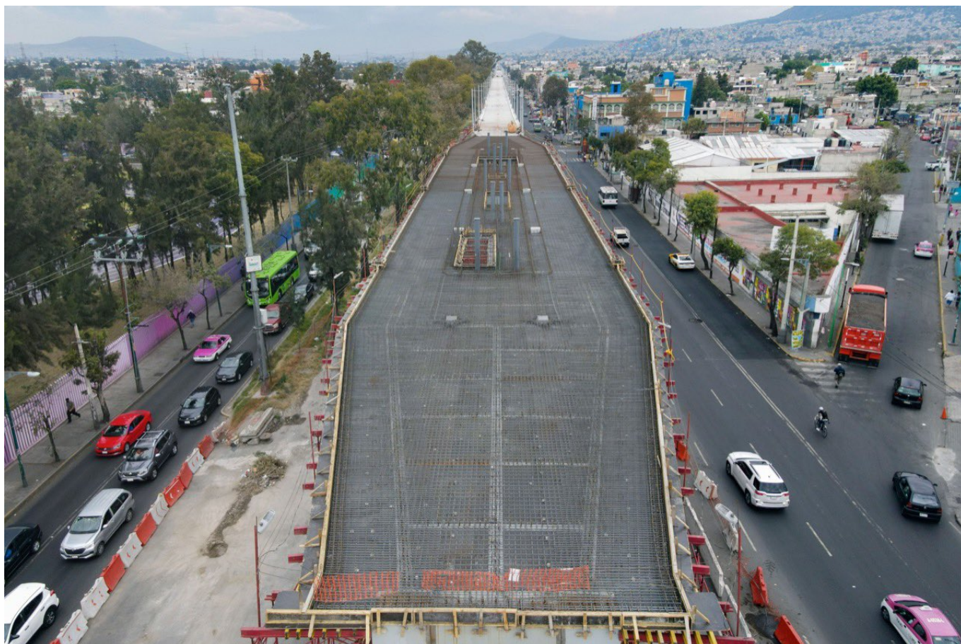
Obří stavba má být dle nového termínu hotová do května 2022.

Připomeňme, že koridor Constitución de 1917 - Santa Martha má mít délku 8 km, avšak koncový úsek UACM - Santa Martha o délce několika set metrů se zatím nestaví, neboť se jedná o komplikovaný úsek kolidující s obří mimoúrovňovou křižovatkou a tratí metra. Dokončeno bude tedy v příštím roce jen 7,2 km. Při ročním bilancování odboru veřejných staveb a městských služeb hlavního města dne 26. 11. 2021 ovšem zazněl nejen dříve oznámený záměr prodloužit trolejbusovou dopravu z konečné Santa Martha dále na jihovýchod směrem k Chalcu , ale nově byl také ohlášen záměr prodloužit nadzemní koridor o 16 km směrem na západ do čtvrti Mixcoac. Tím by vzniklo 16 km nové trolejbusové trati.