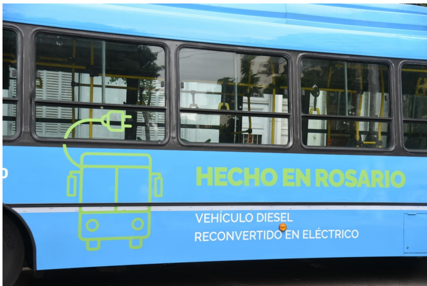
Trolejbus vyroben v Rosariu.