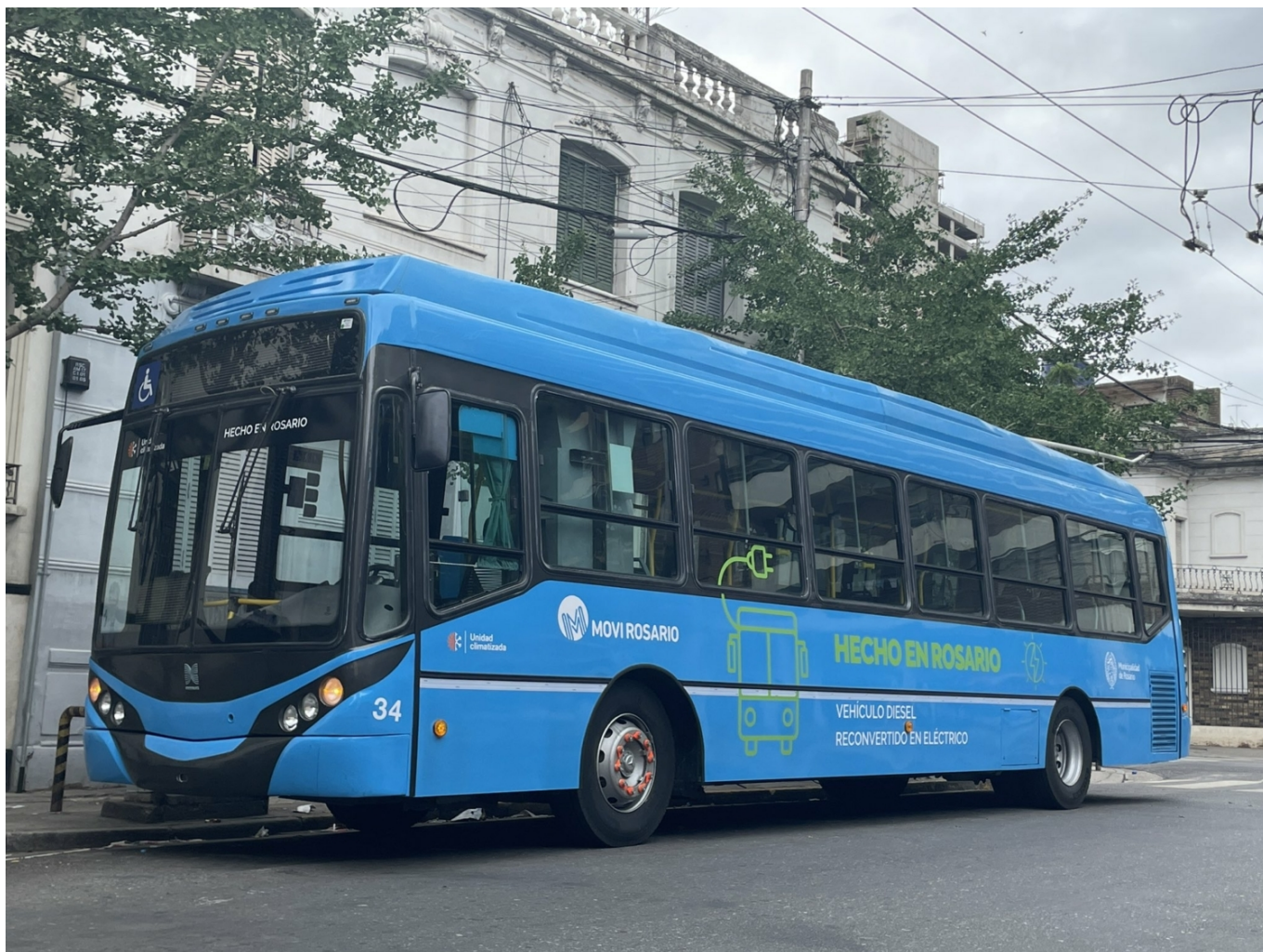
Ještě jeden pohled z vnějšku.