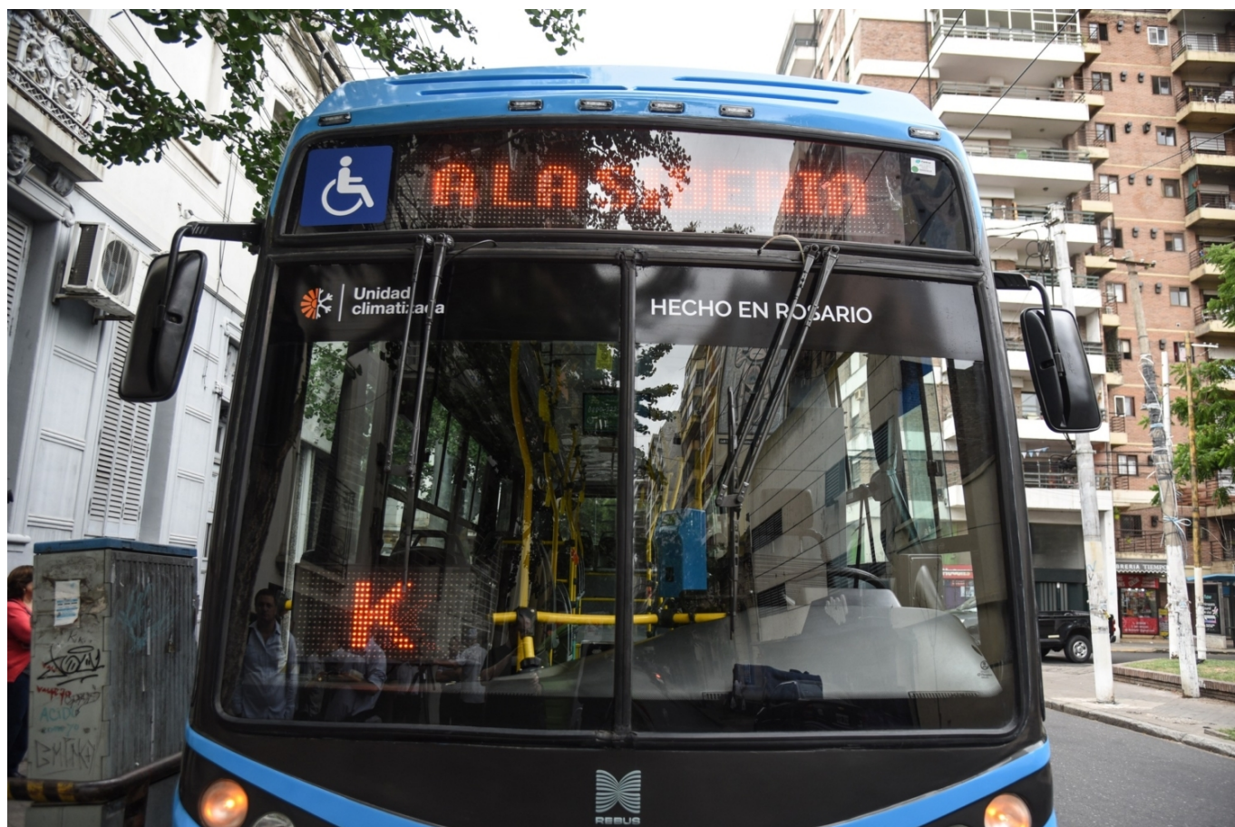
Příd' nového trolejbusu.