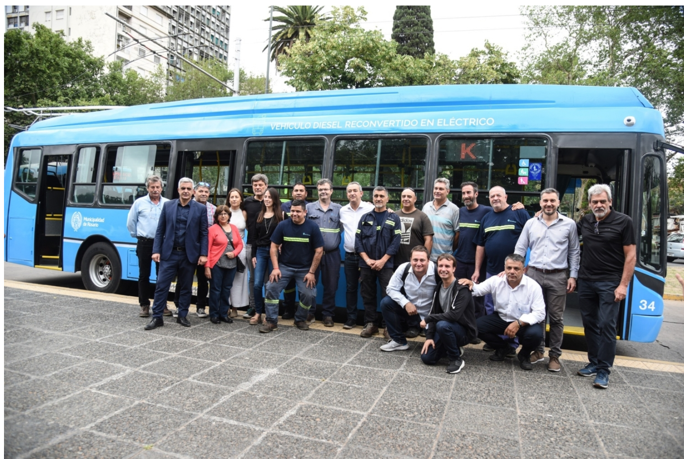
Ze včerejší prezentace.

V plánu bylo postavit celkem 20 trolejbusů a zatím se od něj neupustilo. Tempo výroby ovšem mělo být rychlejší, nakonec se však podařilo letos dodělat jen první sériový trolejbus. Nový trolejbus je stejně jako prototyp vybaven částečně sníženou podlahou, klimatizací salónu, informačními panely i moderními led světly. Zatím ještě není vybaven bateriemi, aby se mohl stát parciálním, vývojáři nicméně pracují na řešení, které poté může být uplatněno na další předělávané vozy a případně také na ty, které už přestavbou prošly. Primátor města uvedl, že po výměně starých brazilských trolejbusů na lince K by měl přijít na řadu comeback trolejbusů na kdysi zrušenou linku M.