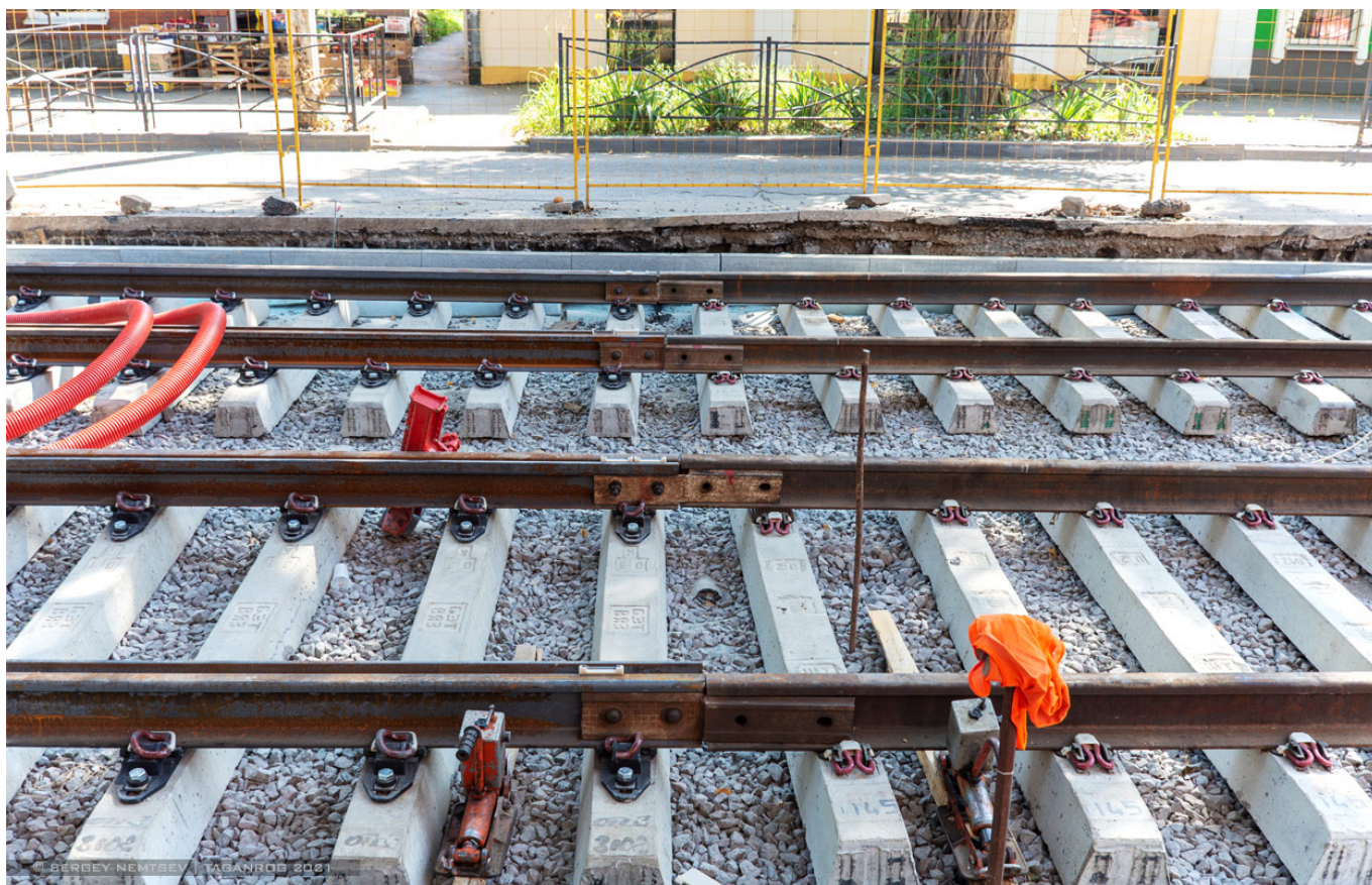
Pohled na koleje. Snímek je z 18. července 2021.

jako petrohradské Metelice, jelikož typ 71-628 představuje sólo vůz.