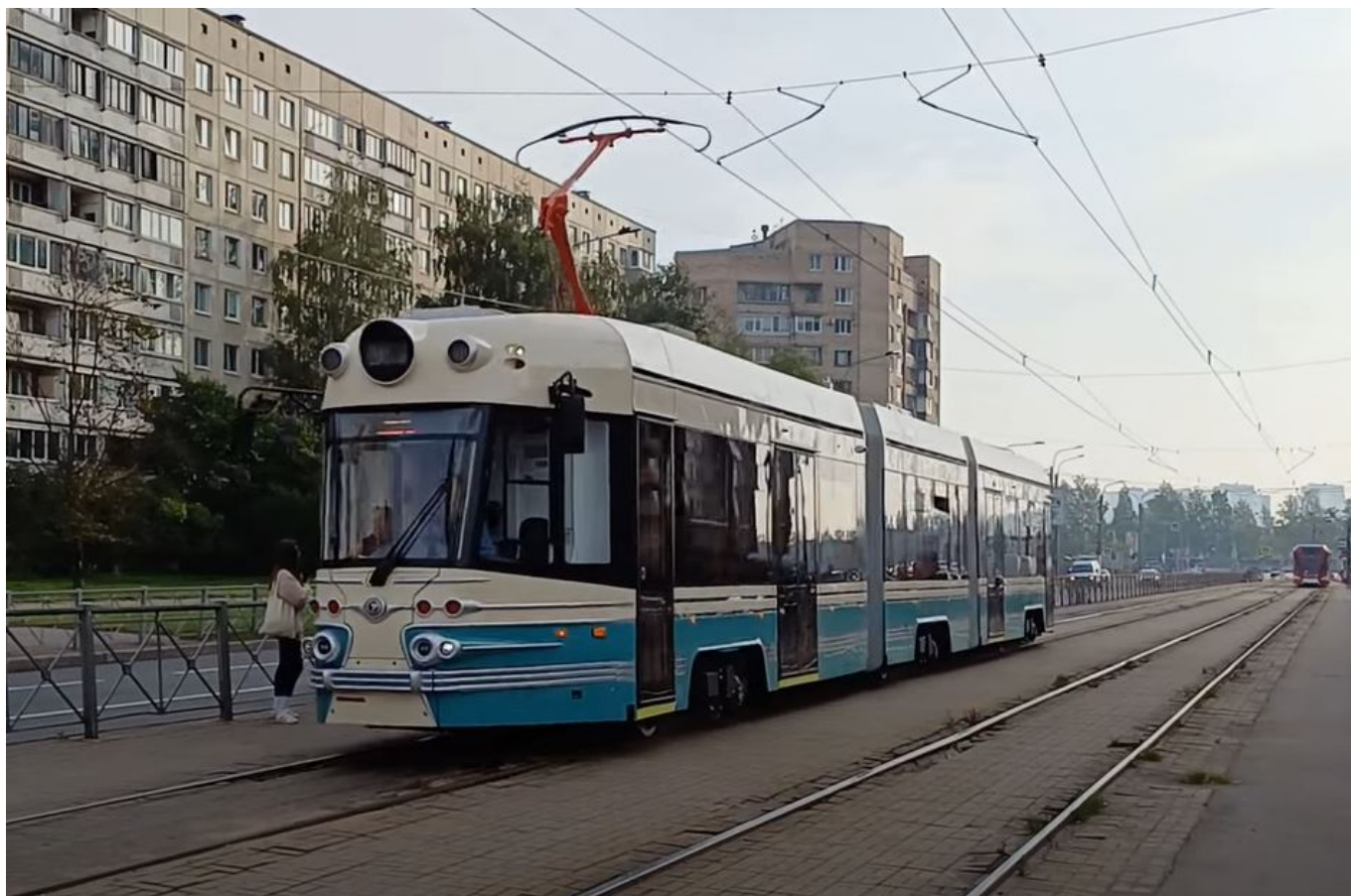
Nová tramvaj na zkouškách na konci září 2023.