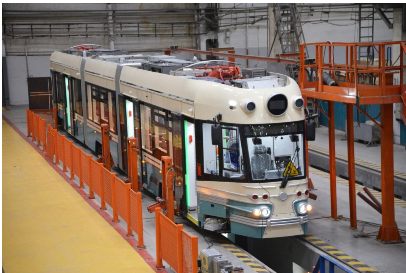
Nová tramvaj.