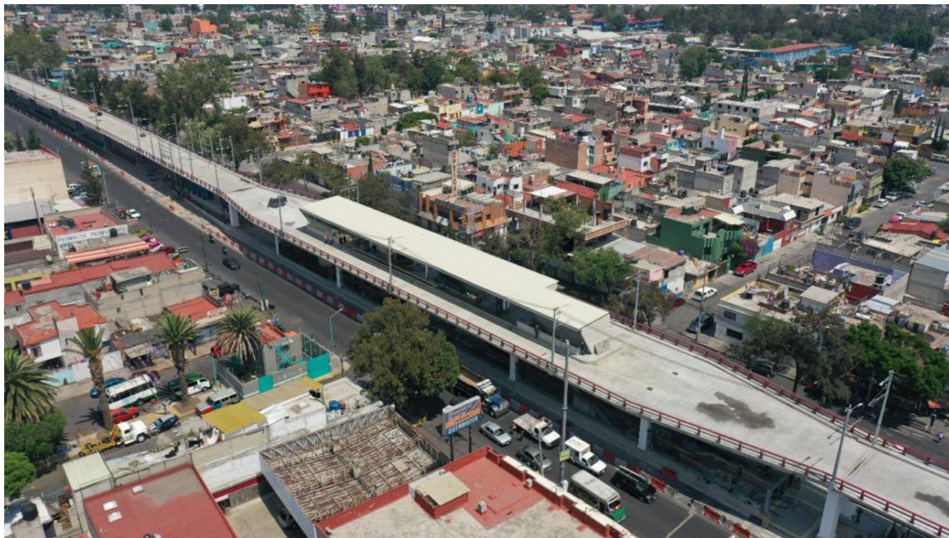
Další tři snímky.

Město dne 12. května 2022 vypsal dva tendry, kterými hledá realizátora přístupových ramp na západním konci BRT koridoru. V místě západní konečné Constitución de 1917 se díky těmto rampám budou moci trolejbusy v budoucnu dostat do úrovně ulice Ermita Iztapalapa a pokračovat dále směrem ve vyhrazených postranních pružích stávající vozovky na západ města až do čtvrti Mixcoac (stávající koridor má jen jednu přístupovou rampu, a to před východní konečnou UACM; viz snímek na konci článku). Právě až do této čtvrti chce radnice postavit novou trolejbusovou trať o délce zhruba 15 km. Původní záměr byl takový, že se nadzemní koridor prodlouží až Mixcoacu, avšak aktuální výběrová řízení ukazují, že se plány změnilly. Každopádně platí, že pokud se postaví trolejbusová trať z konečné Constitución de 1917 do Mixcoacu, vznikne na území hlavního města obří metrobusový koridor o délce více než 20 km, na který bude přímo navazovat další meziměstský o délce zhruba 19 km, který bude směřovat do jihovýchodně ležícího města Chalco .