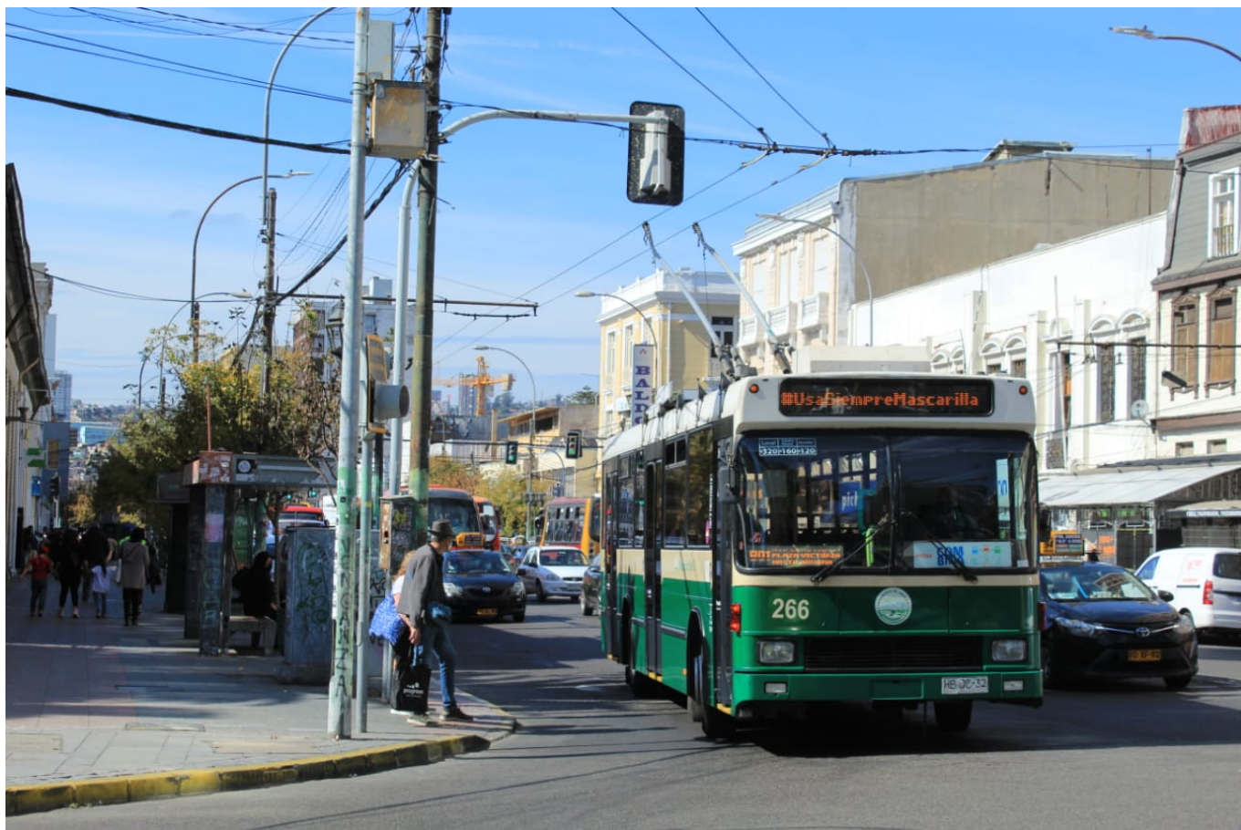
Trolejbus na lince 801 dne 4. 5. 2021. První spoj vyjel v 9:33 ze třídy Argentina a v 10:16 byl po jednom „kole“ zpět ve výchozí zastávce.

Soukromý dopravce Trolebuses de Chile S.A. se musí potýkat poslední rok a půl s citelným úbytkem tržeb. Od podzimu 2019 jej nejprve zasáhly celospolečenské protesty v chilských městech, které byly ve Valparaísu obzvláště silné, a občas o sobě dávají vědět i v roce 2021 (trolejbusy se naštěstí podařilo uchránit od větších škod), a k tomu se ještě před více než rokem připojily vládní sanitární a karanténní restriktce. Tím poptávka po MHD spadla na minimum a poslední měsíce je provoz omezen tak, že trolejbusy zatahují do vozovny už po 16. hodině.