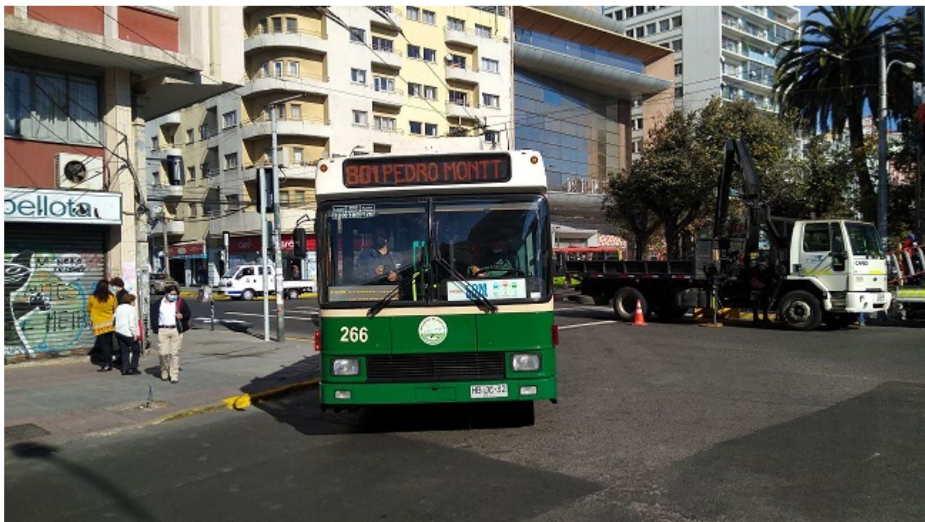
Trolejbus vjíždí z centra Valparaísa na třídu Pedro Montt.