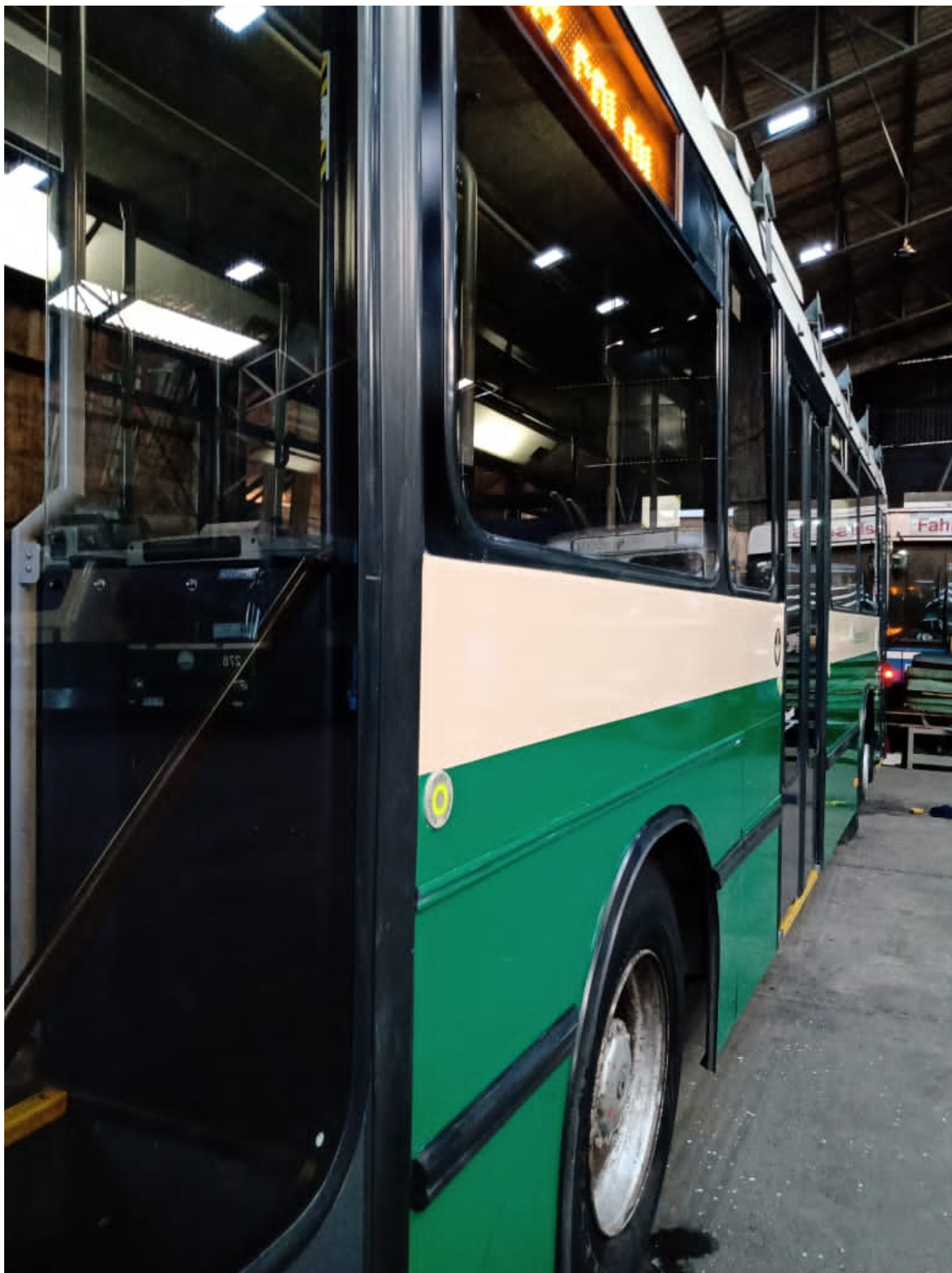
Trolejbus ev. č. 266 byl před včerejší první jízdou na lince 801 pořádně vyčištěn i navoskovan.