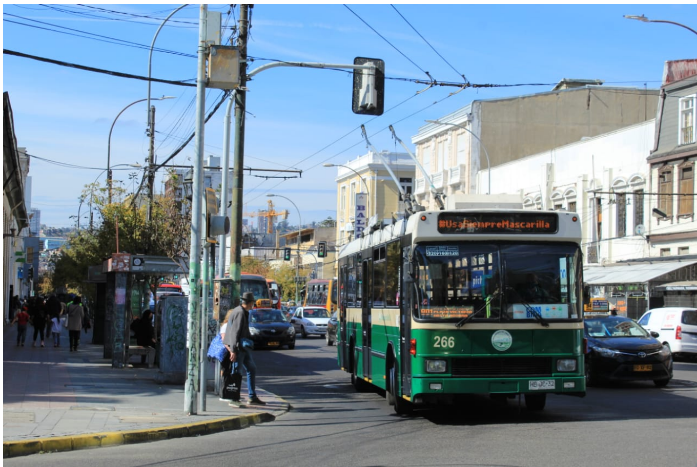
Trolejbus na lince 801 dne 4. 5. 2021. První spoj vyjel v 9:33 ze třídy Argentina a v 10:16 byl po jednom „kole“ zpět ve výchozí zastávce.

Soukromý dopravce Trolebuses de Chile S.A. se musí potýkat poslední rok a půl s citelným úbytkem tržeb. Od podzimu 2019 jej nejprve zasáhly celospolečenské protesty v chilských městech, které byly ve Valparaísu obzvláště silné, a občas o sobě dávají vědět i v roce 2021 (trolejbusy se naštěstí podařilo uchránit od větších škod), a k tomu se ještě před více než rokem připojily vládní sanitární a karanténní restriktce. Tím poptávka po MHD spadla na minimum a poslední měsíce je provoz omezen tak, že trolejbusy zatahují do vozovny už po 16. hodině.