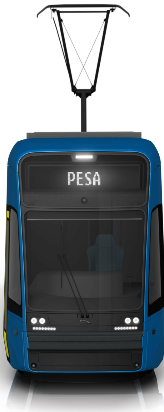
Vizualizace čela tramvaje Pesa Twist pro Jeruzalém.

Celková investice do vybudování modrých linek tramvají v Jeruzalémě má činit 4 mld. € – podíl Pesy v tomto kontraktu činí zhruba jednu desetinu, tedy 400 mil. € (zhruba 9,8 mld. Kč). Součástí je i zajišťování údržby vozidel. Dodávky prvních vozů by měly být zahájeny v roce 2027.