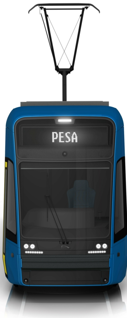
Vizualizace čela tramvaje Pesa Twist pro Jeruzalém.

Celková investice do vybudování modrých linek tramvají v Jeruzalémě má činit 4 mld. € – podíl Pesy v tomto kontraktu činí zhruba jednu desetinu, tedy 400 mil. € (zhruba 9,8 mld. Kč). Součástí je i zajišťování údržby vozidel. Dodávky prvních vozů by měly být zahájeny v roce 2027.