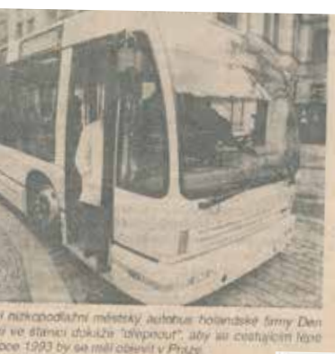
První nízkopodlažní městský autobus holandské firmy Den ve stanici obkružuje "výpravou", aby se cestujícím lépe podařilo nastoupit. V roce 1993 by se měl objevit v Praze.