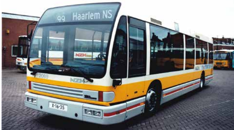
Ještě jeden snímek z podzimu 1991 na novotou zářící vůz Den Oudsten B90 ve službách dopravce NZH. V Praze byl provozován v identickém barevném řešení i s místním evidenčním číslem.

Časový plán se tímto vývojem neustále posouval. Ještě 1. 7. 1991 bylo uváděno, že by k podpisu smlouvy mělo dojít do tří měsíců (tedy do začátku října 1991), načež se měla ihned odpočítávat šestiměsíční fáze náběhu výroby, během níž mělo dojít i ke schválení prototypových vozidel. Ta se měla vyrobit ještě v Nizozemsku, avšak již z československé součástkové základny. V říjnu 1991 se ovšem nadále jen jednalo a o výrobě vozidel dle pražských požadavků nemohla být vůbec řeč. Ve dnech 24. a 25. 10. 1991 se sešli zástupci obou stran v Praze, aby se otázka vstupního kapitálu konečně rozřešila. Od počátku se ale naráželo na zcela protichůdné představy. Den Oudstenu se zdály požadavky pražského DP ve věci výše splátek za budovu nadále přehnané, kontra návrhy zase připadaly Dopravnímu podniku podhodnocené. Zástupci firmy Den Oudsten nakonec nabídli,