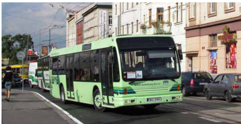
Autobusy Den Oudsten ve verzi B96 se dostaly do ČR až jako ojeté. V roce 2012 si šest vozů pořídily ČSAD Autobusy Karlovy Vary.

Celý projekt začal opět krachovat na penězích a nechtěti Dopravního podniku učinit vymahatelný závazek. V prosinci 1992 a v lednu 1993 navštívili Prahu zástupci dvojice nizozemských bank ( Netherlands Investment Bank a Internationale Nederlanden Bank ). Investiční kapitál pro Den Oudsten, resp. společný podnik, byl fakticky zajištěn, stále však nebyla dořešena oblast získání provozního kapitálu. Ty byly obě banky ochotny poskytnout pouze tehdy, pokud by pražský DP poskytl Den Oudstenovi neodvolatelný akreditiv, tedy bankovní záruku. Ta měla činit 88,5 mil. Kčs. Čerpána měla být pouze tehdy, pokud by pražský DP nesplnil své závazky stran odběru autobusů. Dopravní podnik hl. m. Prahy na urgenci ze strany Den Oudstem ve věci této bankovní záruky uvedl, že závazek odběru 200 vozů potvrzu-