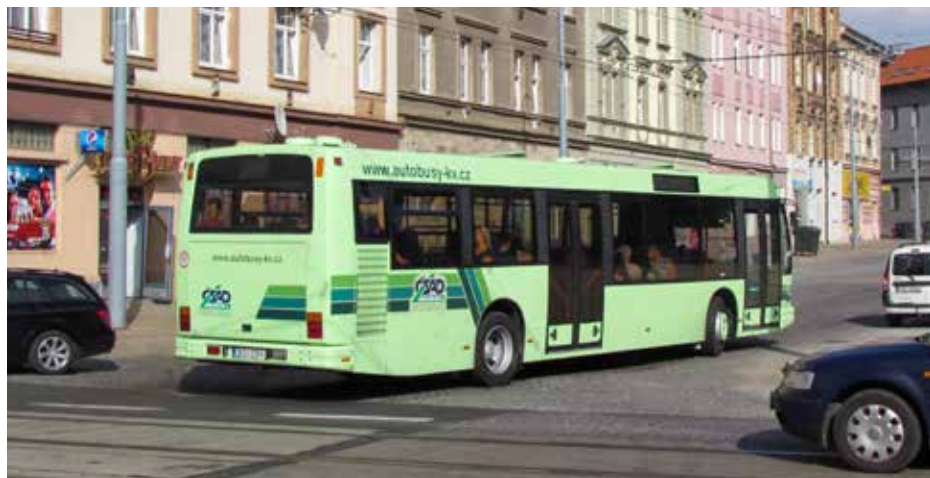
Autobusy vyráběné po roce 1992 již měly upravenou délku i převisy. I přední dveře tedy bylo možné koncipovat jako dvoukřídlé.

je, avšak žádnou bankovní záruku neposkytne. Tím se dostal projekt znovu do slepé uličky. Nizozemci ovšem zůstali vytrvalí a dopisem z 25. 2. 1993 žádali o sdělení „skutečných příčin odmítnutí akreditivu“, tedy zda jde o odmítnutí ze strany banky, vysoké náklady spojené s udržováním akreditivu, anebo nedostatek investičních prostředků na straně DP.