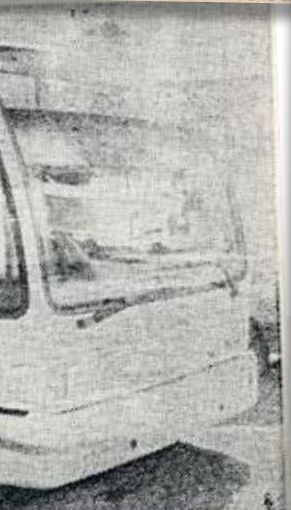
Instalavla včera v Praze městský měl Dopravní podnik hlavního města Prahy v pražských opravách.