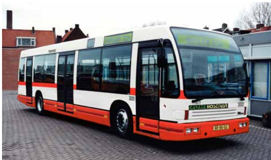
Tato fotomontáž odpovídá provedení, které bylo popsáno v rámci specifikace z podzimu 1992. Podle ní měly být v Praze vyráběny třídvéřové vozy, jež by měly první a poslední dveře pouze jednokřídlé. Foto: Wijnand Keesmaat, grafická úprava: Honza Tran

mace o této firmě. Současně bylo uvedeno, že navrhované podmínky vzniku společného „es er óčka“ jsou pro DP „zcela nepřijatelné“. Předložený návrh proto nebyl přijat. Současně ale též představenstvo uvedlo, že doporučuje dále o tomto tématu jednat, nepovažovalo však za reálné, aby došlo k získání peněžitého vkladu do navrhované společnosti a souhlasilo se založením společného podniku se vstupním kapitálem pouhých 100 000 Kčs.