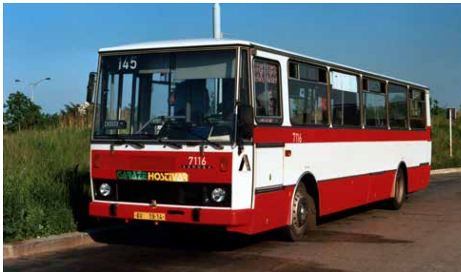
Do série 150 vozů Karosa B 732.1658 dodané v letech 1993 až 1994 patřil i vůz ev. č. 7116 na snímku, jenž sloužil v Praze do roku 2003. Později se objevil ve službách DP měst Mostu a Litvínova, kde byl však provozován ve dvoudveřové úpravě (poslední dveře byly zaslepeny).

Obsaditelnost autobusu ve verzi pro Prahu byla udávána 28 sedících a 62 stojících osob (celkem tedy