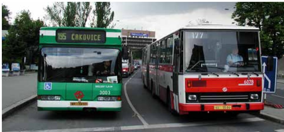
Dva ze tří pražských autobusů Neoplan N 4014/3 byly smontovány v roce 1994 a 1995 v Praze. Ani tento námět na kooperační výrobu ale neskončil úspěšně. Na snímku sekunduje vozu ev. č. 3003 autobus Karosa B 741 ev. č. 6078, jež byla rovněž vyrobena v roce 1995.

Zajímavé je, že spoluprací s firmou Nova BUS si Den Oudsten vytvářel fakticky novou konkurenci na severoamerickém trhu. Kanadské podnikání New Flyeru se totiž Janu den Oudstenovi podařilo zachránit společ-