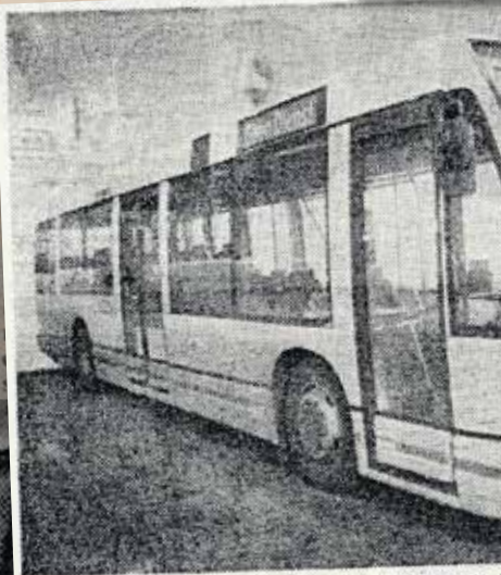
Nizozemsko-kanadská firma Den Oudsten před nízkopodlažní autobus Alliance City, který by v Praze vyráběl s využitím našich součástí MHD v Hostivaři