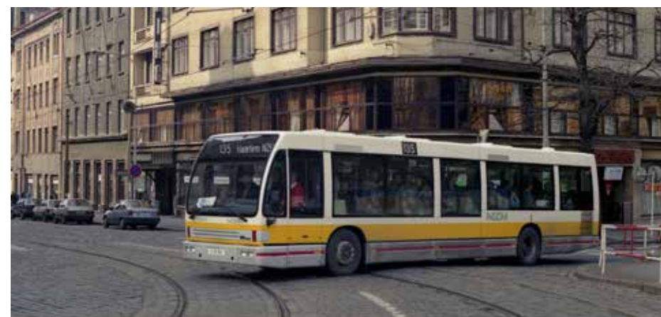
Dne 21. 3. 1992 se mohli cestující svěřit s autobusem Den Oudsten B90 na lince č. 135. Na snímku vidíme vozidlo na náměstí Míru. Autobus během svého pobytu v ČSFR zvládl i krátké předváděcí turné a ukázal se v Brně, Plzni a Teplicích. Všude ale jen zástupcům dopravních podniků. Cestující zde nevozlí.

Dne 18. 3. 1992 se s vozidlem obeznámili pracovníci pražského DP, a to detailně v garážích Kačerov (dopoledne) a v ústředních dílnách v Hostivaři (odpoledne). Na 19. a 20. března 1992 byly naplánovány prezentace zástupcům DP v dalších městech. První den se měl autobus podívat do Brna, kam byli rovněž pozváni zástupci DP z Bratislavy, Jihlavy, Zlína, Olomouce a Ostravy. Druhý den byl vůz nejprve prezentován v Plzni, kam byla navíc pozvána reprezentace z Mariánských Lázní, a poté ještě v Teplicích, kam obdrželi pozvánku zástupci z Chomutova, Mostu, Ústí nad Labem a Děčína.