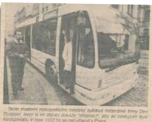
Tento moderní nízkopodlažní městský autobus holandské firmy Den Oudsten, který si ve zkratce dokáže „dřepnout“, aby se cestujícím lépe nastupovalo. V roce 1992 by se měl objevit v Praze.

třídvéřový autobus se silnějším motorem, prostorem pro invalidní vozíky, s životností až 12 let a dalšími změnami přizpůsobenými našim podmínkám by měl z hostivařských opravny vyjet v příštím roce.