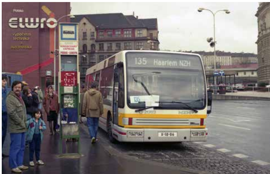
Jeden jediný den se mohli cestující v Praze svěřit prezentačním vozem Den Oudsten B90. Nasazen byl na linku číslo 135.

ky Den Oudstena i DP hl. m. Prahy, vedoucí pozice ale měli zastávat pouze zástupci zahraničního partnera. Klíčové profese se měly dočkat proškolení přímo ve výrobním závodě, přičemž se kupodivu hovořilo o školení pouze v Kanadě, nikoli v Nizozemsku, třebaže produkce kanadských autobusů byla značně odlišná.