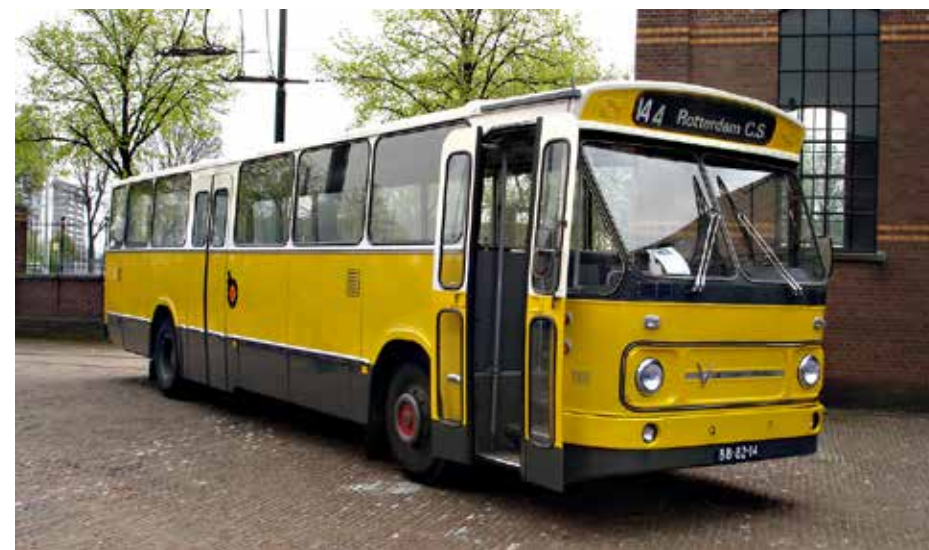
Stejně jako řada dalších západoevropských zemí, vytvořilo si i Nizozemsko předlohu tzv. standardního autobusu, který měl být v základních parametrech unifikován napříč různými výrobci, a tím zajišťovat dopravcům jednoduché obstarávání náhradních dílů. Postupně se do konce 80. let zrodilo několik variant standardních městských i linkových autobusů. Den Oudsten dominoval v oblasti dodávek těchto linkových. Z více než 5 500 vozů, které byly vyrobeny v letech 1967 až 1988, vyrobil Den Oudsten 4 706 ks. Na snímku vidíme zástupce první série standardních linkových autobusů na podvozku Leyland (Leyland-Verheul LVB668).

Na úvod je nutno říci, že Den Oudsten nepocházel ani z Jižního, ani ze Severního Holandska, ale z provincie Utrecht (konkrétně z města Woerden). Přesto je možné v dobových dokumentech často narazit na spojení, že jde o holandského výrobce, stejně tak již zmíněná konzultační firma INB byla označována jako holandská. Vyplývá to z tehdejší běžné praxe aplikace synekdoch pro územní celky, kdy se prakticky po celá 90. léta používala v běžné mluvě i tisku nesprávná označení menších jed-