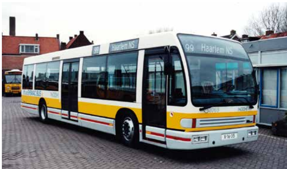
S tímto snímkem se v rámci této brožurky setkáme ještě několikrát, byť ve formě fotomontáží. Zde ovšem vidíme originál, který vyobrazuje autobus, jenž byl zkoušen v březnu 1992 v Praze, ve svém působišti v Nizozemsku na podzim 1991. Tehdy šlo o druhý vyrobený prototyp, který byl dlouhodobě pronajat dopravci NZH. Na snímku je dobře patrný krátký přední převis, který záhy výrobce u sériové produkce opustil.

Konkrétně se mělo jednat nejprve o 300 vozů ročně po dobu prvních šesti let. Ne všechny tyto autobusy ale měly končit u pražského DP, protože 130 vozů měly odebrat další městské dopravní podniky v ČSFR (případně další zájemci z řad provozovatelů MHD). Pražský DP se měl zavázat k převzetí vždy 170 vozů ročně. Toto číslo vycházelo z rozboru stávajícího vozového parku, který provedli kanadští odborníci Den Oudstenu, resp. New Flyeru. Ti do Prahy zavítali počátkem roku 1991 a měli mj. za úkol prověřit, zda by skutečně bylo možné areál ústředních dílen pro montáž nových autobusů použít, přičemž závěrem jejich zprávy bylo, že v ČSFR by bylo možné vyrábět vozidla „stejně kvality jako v Kanadě“. Trojice mužů s kanadskými pasy přitom navštívila nejen pražský DP, ale během deseti dnů zvládla objet minimálně 32 společností, které přicházely v úvahu coby subdodavatelé vybraných dílů. Právě díky těmto dodavatelům se mělo podařit stlačit cenu na minimum.