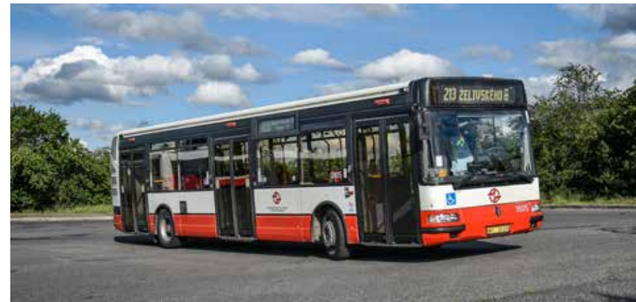
Nízkopodlažních autobusů ve větších sériích se Praha dočkala až od roku 1996, kdy začal nákup autobusů Karosa-Renault Citybus, které pak průběžně s nákupem vysokopodlažních Karos běžely až do roku 2004 (později jako Irisbus Citybus 12M). Celkem bylo pořízeno 321 Citybusů délky 12 m a v letech 2001 až 2004 ještě 53 vozů člankových (Irisbus Citybus 18M). Na snímku vidíme vůz ev. č. 3005 z první série z roku 1996.