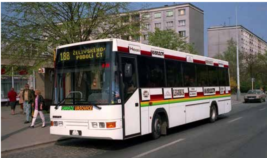
Ve sbírkách Technického muzea v Brně se dodnes uchoval prototyp „B19“ známý jako Legobus. V Praze byl tento autobus testován krátce v dubnu 1992. Ačkoli oficiálně šlo o zástupce typu B 732 (konkrétně model B 732.1670), „hranatou Karosu“ by ve výsledném produktu spatřoval málokdo. Vůz byl vyhotoven s hliníkovou karoserií, nicméně Karosa se tímto směrem nevydala a svou obchodní strategii již ladila s Renaultem.

že předají do šesti dnů výkresy zcela nové haly vyhovující záměrům dané výroby a DP na základě těchto materiálů zajistí nezávislý odhad na výstavbu takové haly v československých podmínkách, což měl zvládnout do tří týdnů. DP dokonce začal vytipovávat na svých pozemcích vhodný prostor, kde by mohl být taková hala vystavěna, pakliže by dohoda o pronájmu stávající opravárenské haly krachla.