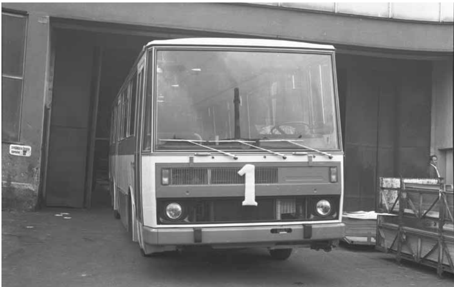
Výroba autobusů Karosa řady 700 se rozeběhla v létě roku 1981. Na snímku opouští výrobní závod v srpnu 1981 vůbec první vyrobený autobus, který odpovídal linkovému provedení C 734. Dvoudveřových autobusů se dočkal i pražský DP, který měl ve své flotile celkem 102 těchto vozů. Ty poslední obdržel až v roce 1994.

notek pro celý stát. Slovem „Anglie“ tak bylo zpravidla myšleno celé Spojené království Velké Británie a Severního Irsku a analogicky „Holandsko“ pod sebe ukrývalo celé Nizozemsko.