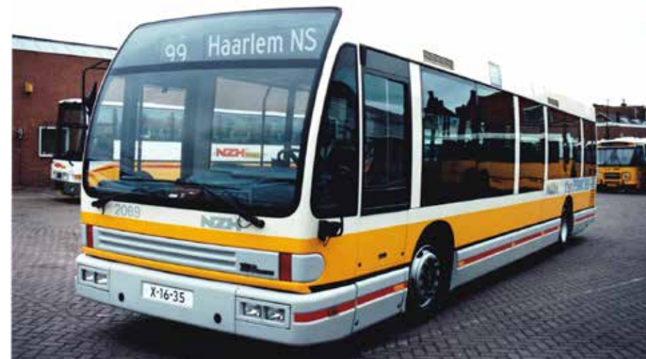
Ještě jeden snímek z podzimu 1991 na novotou zářící vůz Den Oudsten B90 ve službách dopravce NZH. V Praze byl provozován v identickém barevném řešení i s místním evidenčním číslem.

Časový plán se tímto vývojem neustále posouval. Ještě 1. 7. 1991 bylo uváděno, že by k podpisu smlouvy mělo dojít do tří měsíců (tedy do začátku října 1991), načež se měla ihned odpočítávat šestiměsíční fáze náběhu výroby, během níž mělo dojít i ke schválení prototypových vozidel. Ta se měla vyrobit ještě v Nizozemsku, avšak již z československé součástkové základny. V říjnu 1991 se ovšem nadále jen jednalo a o výrobě vozidel dle pražských požadavků nemohla být vůbec řeč. Ve dnech 24. a 25. 10. 1991 se sešli zástupci obou stran v Praze, aby se otázka vstupního kapitálu konečně rozřešila. Od počátku se ale naráželo na zcela protichůdné představy. Den Oudstenu se zdály požadavky pražského DP ve věci výše splátek za budovu nadále přehnané, kontra návrhy zase připadaly Dopravnímu podniku podhodnocené. Zástupci firmy Den Oudsten nakonec nabídli,