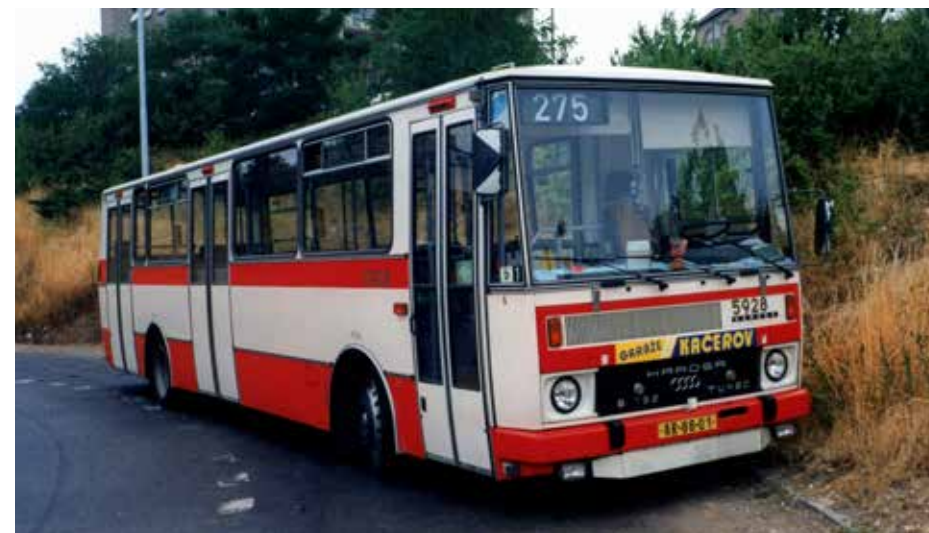
Ačkoli pražský DP nenechal na autobusech Karosa řady 700 na počátku 90. let nit suchou, ukázalo se nakonec, že šlo přece jen o jediný typ, který si mohli dovolit pořídit. Už v době jednání s Den Oudstenem nakupoval článkové vozy B 741. V případě autobusů standardní délky vyčkával, jak se vyvinou sny o kooperační produkci, nakonec kvůli špatnému stavu flotily musel sáhnout ještě v roce 1992 po autobusech B 732, když v létě uvedeného roku nakoupil deset vozů B 732.1640, na něž pak navázalo v průběhu let 1993 a 1994 hned 150 vozů B 732.1654. Na snímku vidíme vůz ev. č. 5928 z uvedených dodávek, který v Praze sloužil v letech 1993 až 2001.

O tehdejší produkci Den Oudstenu měl pochopitelně DP povědomí, neboť mu byl výrobce představen již na konci roku 1990 v doporučení poradenské firmy INB. Vyjádření z listopadu 1991 o tom, že je autobus „neznámý“, je nutno vnímat jako jeden (jak ještě uvidíme) z mnoha úskočných manévřů pražského DP, kterým byla příprava celého podniku provázena. Dopravní podnik sice o založení společného podniku stál, hledal však cesty, jak minimalizovat finanční nároky (nahodnocený posudek na budovu dílen, který měl posloužit coby 40% vklad do společného podniku, byl první z nich) a jak nedat žádný skutečný závazek stran odběru vozidel. Není přitom jasné, jak chtěl DP zaručit odběr 130 vozů od dalších československých dopravců, když sám nebyl s to se (jako spolujednatel podniku) zavázat písemně k vlastní části (původně 170, později 120 vozidel). Hodí se uvést, že ačkoli se po celou dobu hovořilo o 300 kusech, na počátku se kromě nákupu nízkopodlažních autobusů zmiňovaly i možné dodávky dalších typů a provedení vozidel, konkrétně vozů se standardní