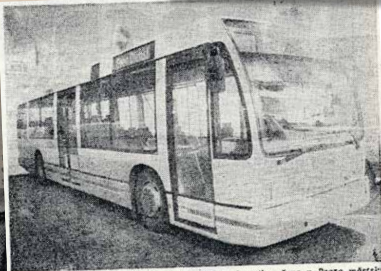
Nizozemsko-kanadská firma Den Oudsten představila včera v Praze městský nízkopodlažní autobus Alliance City, který by měl Dopravní podnik hlavního města Prahy vyrábět s využitím našich součastek v pražských opravárnách MHD v Hostivaři.