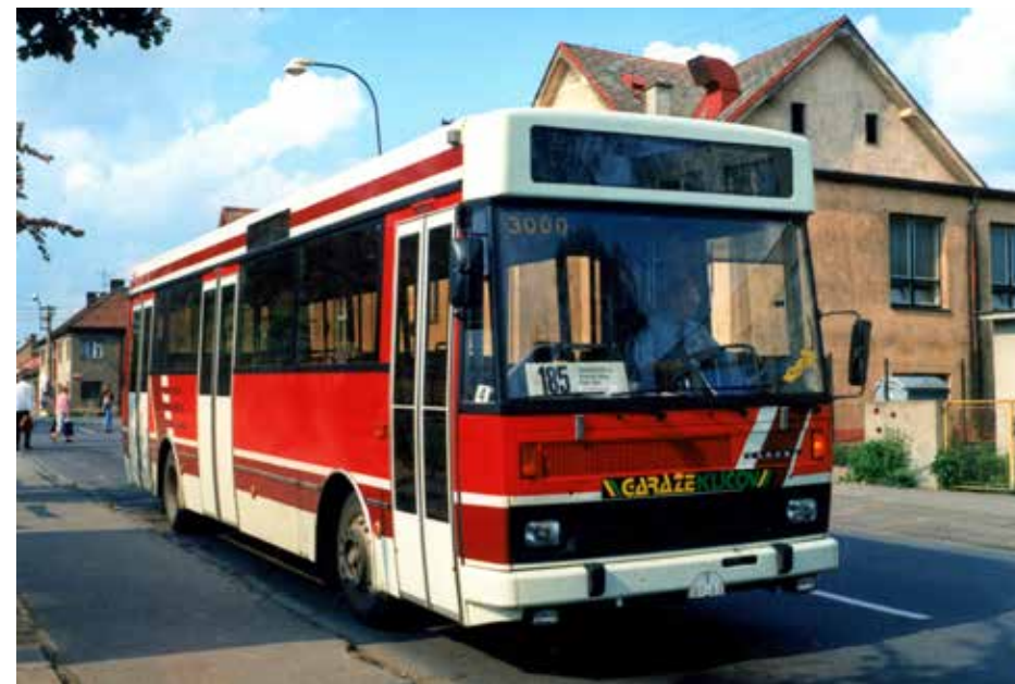
Karosa Vysoké Mýto se pod tlakem trhu pokoušela modernizovat stávající výrobní řadu. Jedním z těchto pokusů byl i nezvyklý prototyp vozu B 732.1661 (B17, označovaný též jako „model 92“), který ale neměl své pokračovatele. Autobus se vyznačoval lepenými okny, vyvýšenou střešinou s velkými transparenty, modernějším řešením interiéru atp. DP v Praze si vůz nejprve od roku 1993 pronajal, teprve v roce 1995 jej dopravce odkoupil a provozoval jej až do roku 2001. Autobus později přešel přestavbou na přepravník závodního vozu a v rámci další úpravy obdržel i nové čelo a další prvky z vozů řady 900. V červenci 2024 je vůz stále provozní.

prezentováno jako potvrzení vyspělosti a schopnosti městské společnosti realizovat tak náročný úkol, jako by byla montáž autobusů. Ve skutečnosti je nutné hledat za rozhodnutím Den Oudstena pragmatismus. Kolem Karosy Vysoké Mýto již v té době kroužili zájemci z francouzského Renaultu (i Francouzi měli v ČSFR své „nezávislé“ poradce), Škoda Ostrov se zase soustředila primárně na výrobu trolejbusů a koketování se Škodovkou zahájil Siemens. Případná dohoda o výrobě autobusů v Karose či Škodě Ostrov ale nepřinášela nizozemskému producentovi to hlavní – jistotu odběru jeho vozidel. Společnosti Karosa ani Škoda totiž nemohly garantovat, že by od nich kooperačně vyráběné autobusy někdo odebíral, naopak Den Oudsten, jenž věděl, že Praha bude potřebovat vozový park autobusů tak jako tak obnovovat, a cítil, že sám pražský DP má o možnost kooperační výroby eminentní zájem, mohl v rámci utvoření společného podniku přijít s požadavkem, aby se Praha už v rámci dohody o založení takového joint venture zavázala k minimálnímu odběru určitého počtu vozidel po stanovenou dobu.