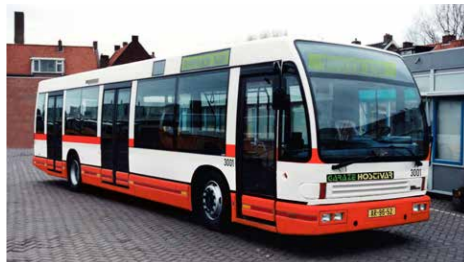
Zde vidíme verzi se zadními dvoukřídlými dveřmi, která se objevila ve formě kresby na jednom z propagačních materiálů k testovacímu provozu v březnu 1992. Pozdější popisy ale uváděly poslední dveře ve verzi pro Prahu jen jako jednokřídlé. Foto: Wijnand Keesmaat, grafická úprava: Honza Tran

Mezi květnem a říjnem 1992 komunikovaly obě strany pouze korespondenčně, teprve 13. 10. 1992 se konala další schůzka v Praze. V mezičase byl ze strany pražského DP návrh Den Oudstenu prakticky bez výhrad přijat. S ohledem na celkové uskromnění plánů měl být připraven nový business plán reflektující snížené počty výroby, jenž měl být následně předán bankám, od nichž si hodlal i Den Oudsten na rozjezd českoslo-