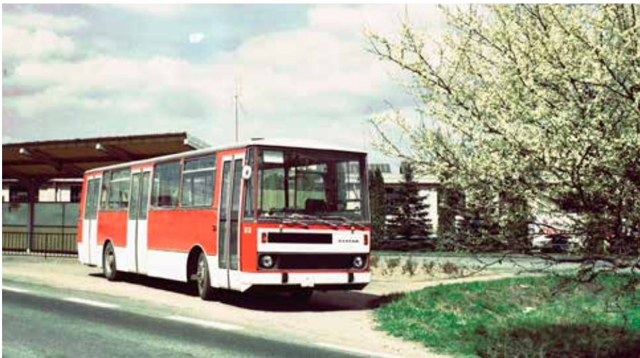
Prototyp autobusu Karosa B 731 s interním označením B2 vznikl již v roce 1974. Třebaže do začátku sériové výroby uběhla ještě dlouhá doba (první vozy začaly opouštět linku až v roce 1982), nelze rozhodně říci, že by na počátku 90. let autobusy byly konkurenceschopné ve světovém měřítku. Navíc kvalita výroby byla, jako u většiny československých produktů té doby, bez nadsázky mizerná. Většina dopravců tak autobusy z Vysokého Mýta odebrat nechtěla. Zdroj: archiv Iveco Czech Republic

vždycky doufalo (a s ním i ostatní státy sovětského bloku), že jeho nové produkty půjde alespoň po nějakou dobu udat i v dalších (rozumějme kapitalistických) zemích mimo Radu vzájemné hospodářské pomoci (RVHP), což by přinášelo do chřadnoucího hospodářství tolik potřebné prostředky v tvrdých valutách. Když se projekt řady 800 v roce 1990 definitivně rozplynul, nezbyvalo než pokračovat ve výrobě autobusů stávajících – tedy řady 700, kde vznik prototypů spadal do období první poloviny 70. let.